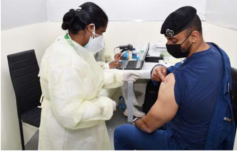
جانب من العمل في المركز