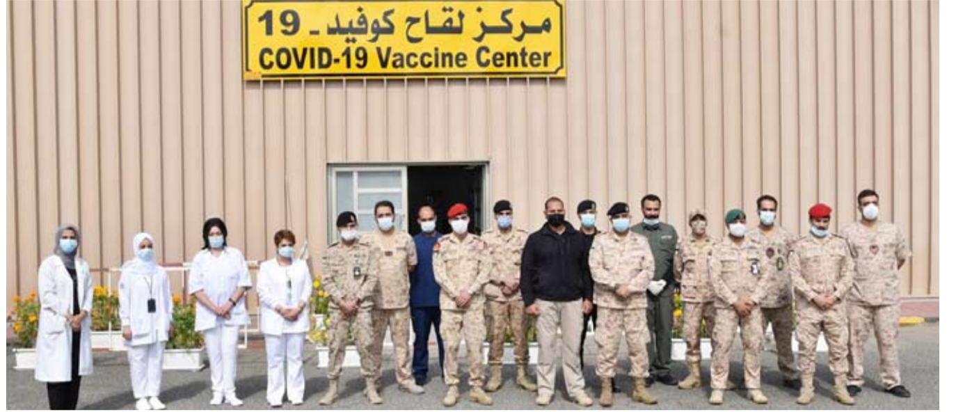
لقطة جماعية خلال افتتاح مركز التطعيم

عبر المنصة الإعلامية التابعة لوزارة الصحة عن طريق الرابط https://cutt.ly/EkvrXu8 وستكون أوقات العمل ابتداءً من يوم غد الثلاثاء من الساعة 3 مساءً إلى 10 مساءً طوال أيام الأسبوع عدا يوم الجمعة.