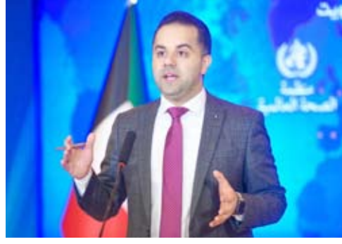
د. عبدالله السند

الرعاية الطبية في أقسام العناية المركزة بلغ 56 حالة، ليصبح بذلك المجموع الكلي للحالات التي ثبتت إصابتها بمرض (كوفيد 19) ولا زالت تتلقى الرعاية الطبية اللازمة 3198 حالة. وأضاف أن عدد المسحات التي تم إجراؤها في الساعات الـ 24 قبل الماضية بلغ 4662 مسحة، ليلبغ مجموع الفحوصات 1190287 فصلاً. ودعا المواطنين والمقيمين لمداومة الأخذ بسبل الوقاية كافة وتجنب