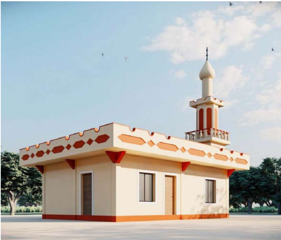
أحد مساجد «النجاة الخيرية» في الفلبين