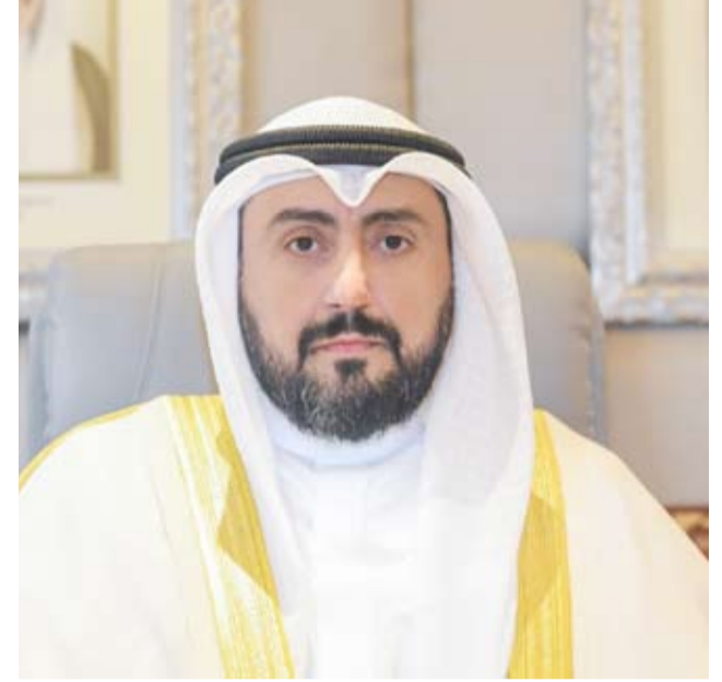
الشيخ الدكتور باسل الصباح