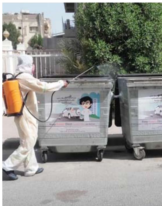
تعقيم الحاويات في «حولي»

في ظل الجهود التي تبذلها بلدية الكويت لمجابهة تداعيات فيروس كورونا المستجد بناء على القرارات والتعاميم التي أصدرها مدير عام بلدية الكويت م. أحمد المنقوحي تنفيذًا للقرارات التي أصدرها مجلس الوزراء المؤرق وقرارات وزارة الصحة ضمن الإجراءات الاحترازية والوقائية التي اتخذتها البلدية تجنبًا لانتشار فيروس كورونا المستجد، قامت الفرق الرقابية ببلدية العاصمة بتعقيم 1133 حاوية مختلفة الأحجام ورفع حمولة 4066م3 من المخلفات مجهولة المصدر.