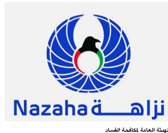
الهيئة العامة لمكافحة الفساد

وأضاف وزير أن الهيئة باشرت بجمع المعلومات والبيانات على مستوى النطاق المحلي والتواصل مع الجهات ذات الصلة وفتح قناة اتصال مع لجنة مكافحة الفساد الماليزية (إم اي سي سي) لتبادل المعلومات وجمع الاستدالات.