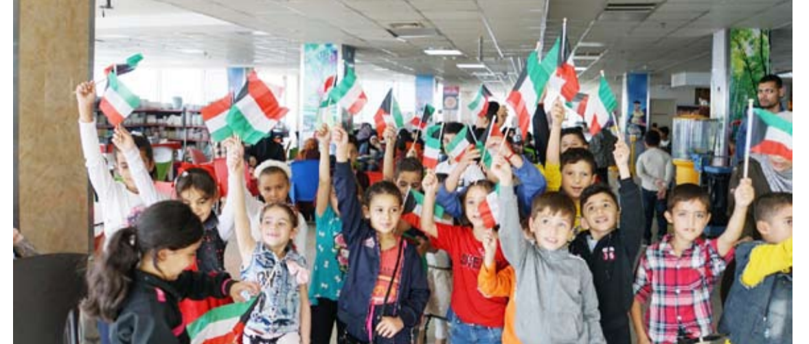
أيتام اللاجئين السوريين

بصورة جيدة، فحرص على التعاقد مع الجمعيات الرسمية المعتمدة في البلدان الخارجية، وكذلك نسلم الكفالات يبدأ بيد ونعمل جاهدين على تذليل الصعاب التي تواجه الأيتام، ونقوم كذلك بعقد اللقاءات والحفلات لتكريم الأيتام، ونحرص على شحذ هممهم ويزرع فيهم الأمل في غد أفضل بإذن الله تعالى. وختم الرويشد تصريحه قائلاً: أشكر المحسنين الكرام شركائنا في النجاح الذين يحرصون على رسم البسمة على شفاه الأيتام، تلك التي رحلت برحيل والدهم، فجزاهم الله خيراً على ما يقدمون لمشاريع كفالة الأيتام.