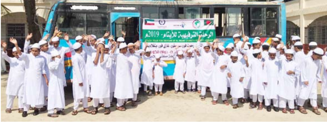
رحلات ترفيحية للأيتام