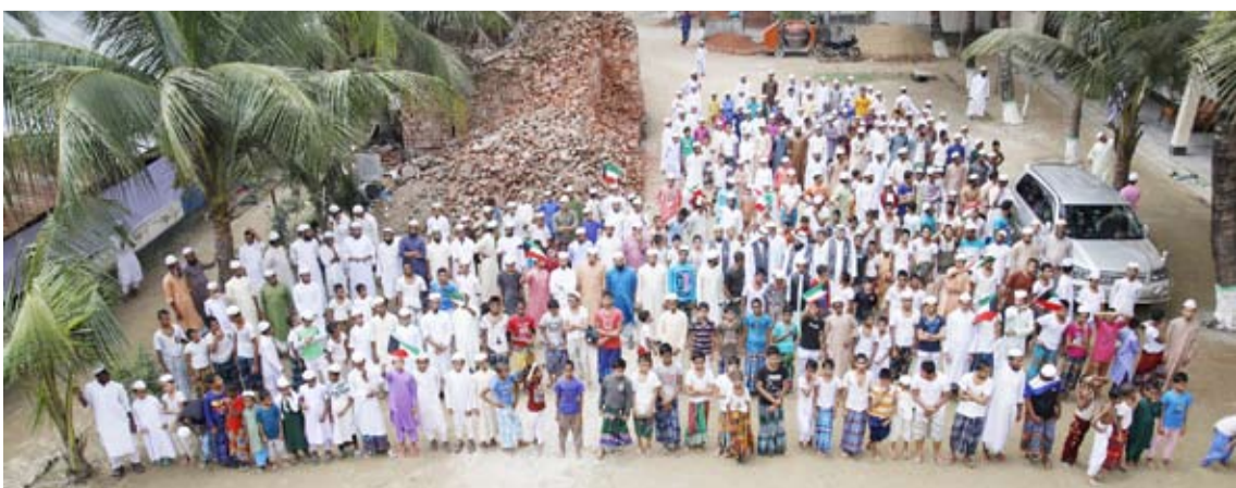
رعاية الأيتام أهم أولويات الجمعية