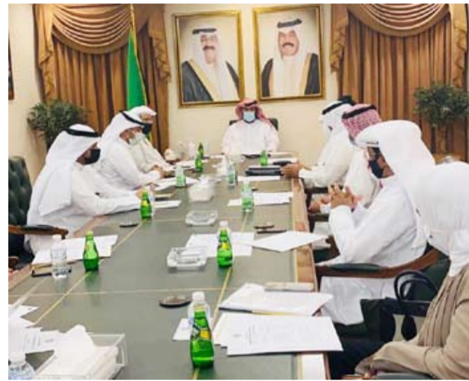
محافظ العاصمة يترأس الاجتماع

بجهود دوؤبة، تتبنى تحديد الأهداف والأولويات في مشاكل المحافظة والتعامل معها بروح الإنجاز والبحث عن حلول واقعية بعيداً عن أية معوقات، وبالتعاون مع مسؤولي الجهات المعنية، تسير خطى محافظ العاصمة الشيخ طلال الخالد، لتحقيق الطفرة المرجوة في تطوير وتنمية المحافظة، والذي "عبر عن خالص تفاؤله بتحقيق طموحات المحافظة وإدراك عمليات التنمية والتطوير بين رحابها رغم المعوقات والمخالفات العميقة المتراكمة منذ سنين مضت"، لافتاً إلى أنه "يلبس وفرق عمل المحافظة عمليات إنجاز مرحلية مباشرة على مختلف المستويات".