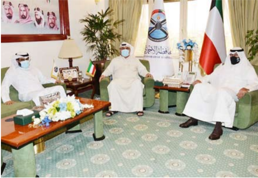
جانب من لقاء محافظ الأحمدى ووفد الاتحاد

حيث رحب بالتعاون مع الاتحاد خلال الفترة المقبلة خاصة في البرامج والأنشطة المجتمعية، لافتاً إلى أن الاتحاد نظم كثير من الفعاليات في الكويت والعديد من الدول العربية منها مصر والأردن، مؤكداً أن هناك الكثير من الفعاليات المستقبلية الجاهزة للتطبيق ولكن ظروف الجائحة التي يشهدها العالم حالياً حالت دون تنفيذها، أملاً زوال هذا الوباء في القريب العاجل لتعود الحياة إلى طبيعتها.