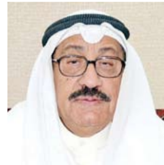
الفنان عبدالعزيز المرفج

الفنية على المستوى المحلي والخارجي وتطوير محتواها، برؤية إعلامية عصرية تواكب المستجدات في عالم التكنولوجيا، مع التركيز على دور رواد الفن الكويتي بكافة مجالات الفن، ودور فنانين الكويت من جيل الشباب لإبرازهم إعلامياً وتسليط الضوء على إنتاجاتهم الفنية. وقد رشح مجلس إدارة جمعية الفنانين الكويتيين المخرج عبدالله عبدالرسول أمين سر جمعية الفنانين الكويتيين ورئيس لجنة الشؤون لمرسحة لرئاسة لجنة وضع الرؤية لتأسيس قاعدة ومنظومة المعلومات الإلكترونية خاصة بجمعية الفنانين الكويتيين تحت عنوان «فنون الكويت»، والتي تشمل مواقع التواصل الاجتماعي والنشر الإلكتروني لتقديم المعلومات