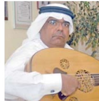
الموسيقار أنور عبدالله