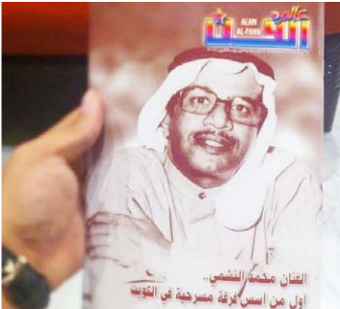
غلاف عدد سابق للمجلة