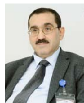
أ.د. يسري العصار

المواد العسكرية، وعقود بنك الكويت المركزي، وعقود مؤسسة البترول، نظراً للطبيعة الخاصة لكل منها، كما يستثنى من قانون المناقصات أيضاً، العمليات الاستثمارية اليومية والتعاقد بين الأشخاص العامة.