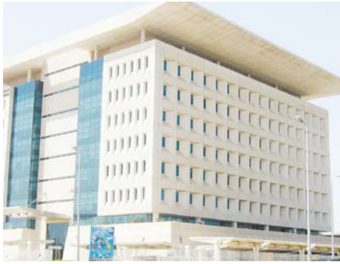
ديوان الخدمة المدنية

وتمن جهود الموظفين في الصفوف الأمامية والمساندة، داعياً الجهات الحكومية التي وردت ملاحظات على كشوفها لمستحقي المكافآت بسرعة الاستجابة وموافاة الديوان بالكشوف المعدلة تمهيداً للتدقيق عليها مجدداً واعتمادها.