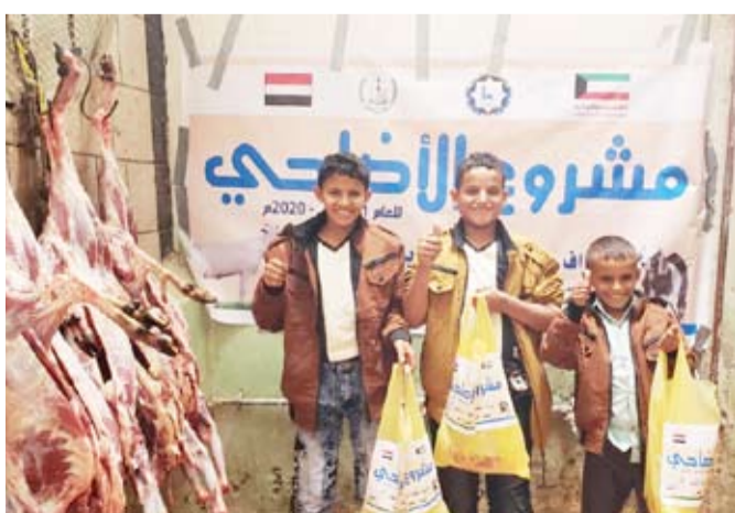
توزيع الأضاحي في اليمن

تعالى: «فَكُلُوا مِنْهَا وَأَطْعَمُوا النَّبِئِيسَ الْفَقِيرَ». مبيناً أن التبرع للمشروع يكون عن طريق الاتصال هاتفياً، أو زيارة مقر زكاة الرميثية للزكاة والصدقات.