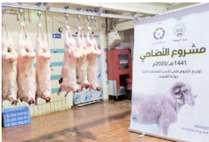
الأضاحي داخل الكويت للأسر المتعففة