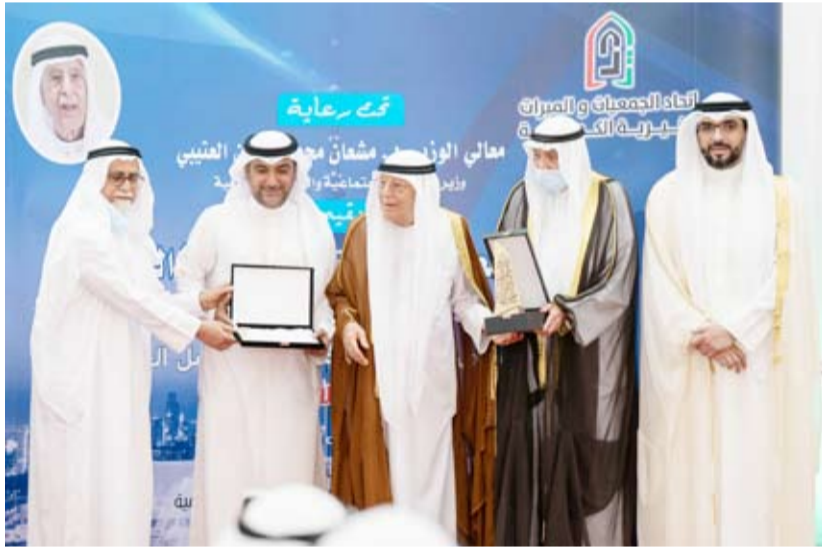
تكريم «نماء الخيرية»

وأوضح أن حصول نداء الخيرية على هذه الجوائز جاء نتيجة جهد متواصل وعمل دؤوب من كافة العاملين مؤكداً على أنه يوماً بعد يوم يتأكد للمجمع أن الكويت حفرت اسمها بأحرف من نور في صناعة الخير، وأصبح العمل الخيري إحدى المراتب المضيئة في تاريخ الكويت وحاضرها. وأعرب الكندي عن شكره لكل أهل الكويت ممن ساهموا في دعم نداء الخيرية في مشاريعها الخيرية والإنسانية، والتي لولا دعمهم بعد فضل الله، لما حققت الجمعية النجاحات المتتالية في مسيرة العمل الخيري معرباً في الوقت ذاته عن شكره لاتحاد الجمعيات والمبرات الخيرية والقاتنين على جائزة خالد العيسى الصالح للتميز في العمل الخيري على جهودهم الحثيثة في تشجيع العمل الخيري والعاملين فيه من خلال هذه الفعاليات.