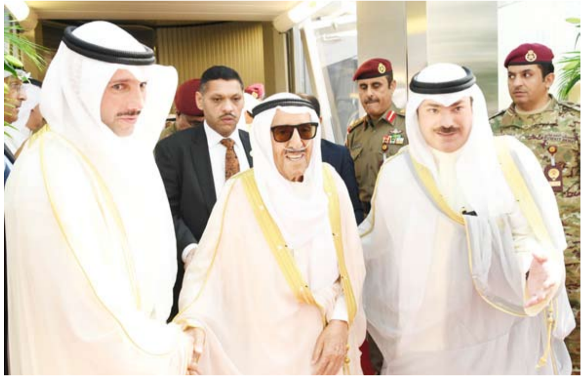
مرزوق الغانم مرحباً بعودة سمو الأمير

خالص شكره وتقديره على ما عبر عنه سموه وإخوانه الوزراء من تهاني ومشاعر طيبة ودعاء صادق بعودة سموه إلى أرض الوطن العزيز بعد استكمال الفحوصات الطبية التي تكفلت بفضل الله تعالى ومنته بالتوفيق والنجاح سائلا سموه الباري جل وعلا أن يحفظ الوطن الغالي ويديم عليه نعمة الأمن والأمان والرخاء ويسد خطى الجميع لخدمته ورفعة شأنه ويبارك بجهود أبنائه للدفع بمسيرته الطموحة وتحقيق أهدافها التنموية المنشودة وأن يديم على الجميع موقور الصحة والعافية.