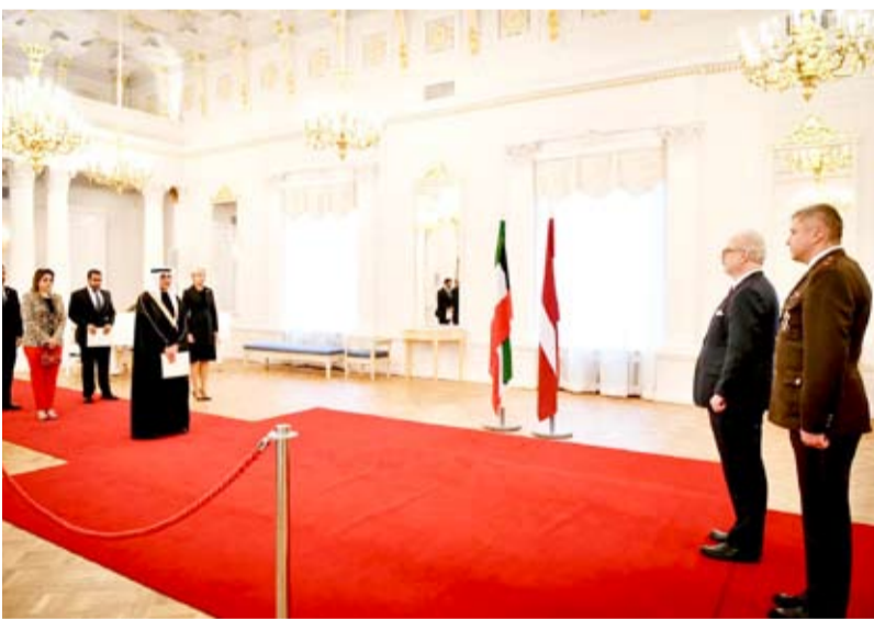
السفير نجيب البدر يقدم أوراق اعتماده

قدم سفير الكويت لدى ألمانيا نجيب البدر أمس أوراق اعتماده لرئيس لاتفيا إيفغليس ليفتس سفيراً غير مقيم للكويت في العاصمة ريفا وذلك بحضور عدد من كبار المسؤولين في لاتفيا وأعضاء سفارة الكويت في برلين. وقال السفير البدر لـ (كونا) بعد إجراء مراسم تقديم أوراق الاعتماد في قلعة ريفا (القصر الرئاسي) في لاتفيا إنه نقل تحيات سمو أمير البلاد الشيخ صباح الأحمد لرئيس لاتفيا إيفغليس ليفتس وتمنياته له بموقور الصحة والسعادة ولشعب لاتفيا الصديق كل تقدم وازدهار.