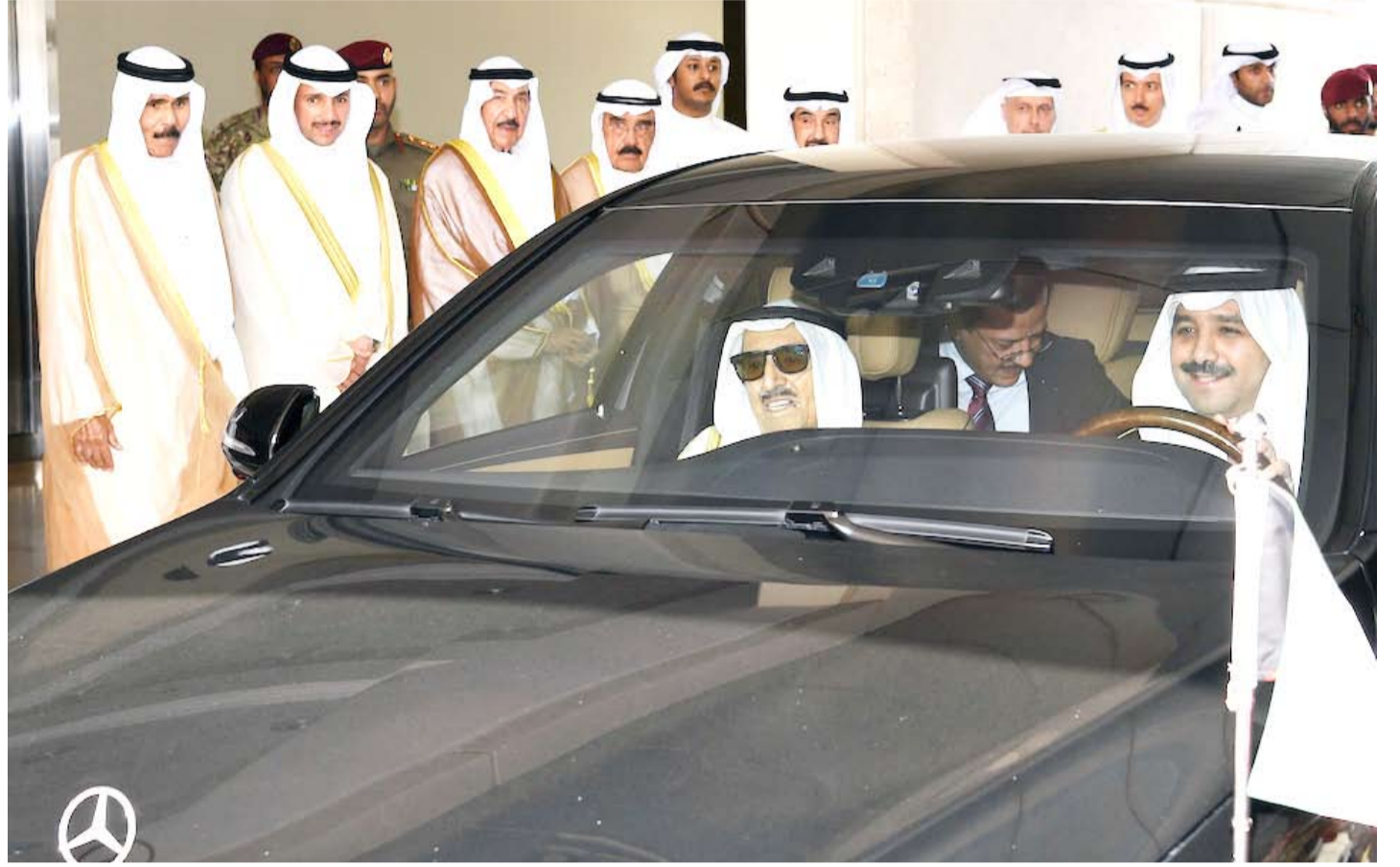
سمو الأمير لدى عودته إلى البلاد

استقبل سمو ولي العهد الشيخ نواف بقصر بيان صباح أمس سمو الشيخ جابر المبارك رئيس مجلس الوزراء. كما استقبل سمو ولي العهد سفيرة مملكة تايلند الصديقة لدى دولة الكويت السفير دوست مانابان وذلك بمناسبة انتهاء مهام عمله سفيرا لبلاده. وحضر المقابلة رئيس المراسم