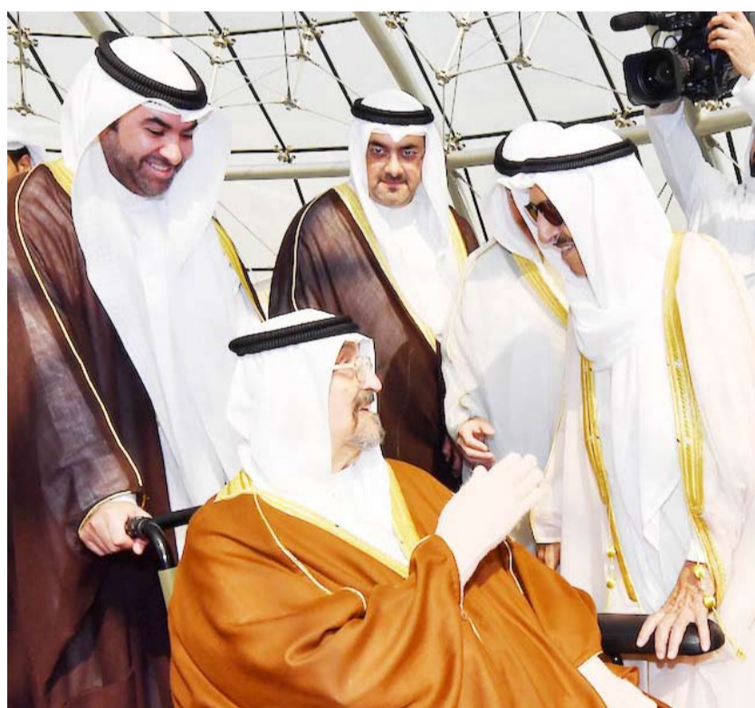
سمو الأمير مصافحاً سمو الشيخ سالم العلي

لحلف شمال الأطلسي. وأعرب عن تطلعه إلى وجود لاتفيا ضمن رؤية الكويت لعام 2035 فضلاً عن وجود الشركات الكويتية في لاتفيا لما تمتلكه من فرص ومقومات واحدة للاستثمار، مؤكداً دور الغرفة التجارية والصناعية في كلا البلدين في تشجيع الزيارات المتبادلة وتعزيز دور القطاع الخاص. واتزانته في التعامل مع العديد من القضايا والمسائل الإقليمية والدولية. وأكد رئيس لاتفيا حرص واهتمام بلاده بتطوير آفاق مجالات التعاون وبشكل يخدم المصالح المشتركة بين البلدين الصديقين. كما عقد السفير البدر عدداً من الاجتماعات الأخرى التي ضمت وزير الدولة بوزارة الخارجية اللاتفية أندريس بليس وعدد من مسؤولي وزارة الخارجية ورئيسة البرلمان اللاتفية دامارا بينتير لونغالا حيث تمت مناقشة تعزيز أطر التعاون في مجالات سياسية وبرلمانية وأمنية إلى جانب بحث عدد من المسائل المتعلقة بقضايا منطقة الشرق الأوسط.