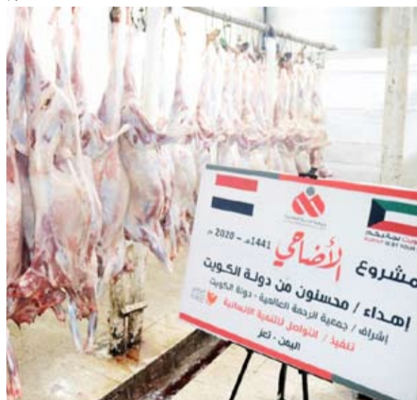
جانب من مشروع الأضاحي في اليمن

داخل وخارج الكويت لهذا العام قال الشامري: استطاعت جمعية الرحمة العالمية تحقيق أهدافها المرسومة من مشروع الأضاحي، وساعد على ذلك حسن إدارة المشروع بإغلاق الدول التي تحقق أهدافها أو لا يسهل، بالإضافة إلى استمرار إقبال المحسنين الكرام حتى آخر لحظة إضافة إلى 25% من متبرعي الأضاحي كان لأصحاب المراكز الإسلامية والمساجد التي قاموا بإنشائها عبر جمعية الرحمة العالمية، حيث يتبرع المحسن بعدد 5 أضاحي وغنم، وأضحية بقرة لمركزه أو