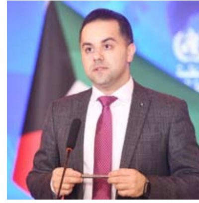
د. عبد الله السندري

أعلنت وزارة الصحة الكويتية أمس الثلاثاء تسجيل 475 إصابة جديدة بمرض كورونا المستجد (كوفيد-19) خلال الـ 24 ساعة قبل الماضية، ليرتفع بذلك إجمالي عدد الحالات المسجلة في البلاد إلى 68774 حالة في حين تم تسجيل 4 حالات وفاة إثر إصابتها بالمرض، ليصبح مجموع حالات الوفاة المسجلة حتى أمس 465 حالة.