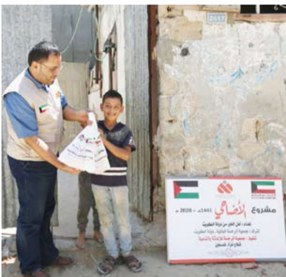
تقديم الأضاحي في فلسطين

مسجده، قابلة للزيادة حسب رغبة المتبرع. وتوجه الشامري بالشكر إلى جمهور المحسنين والمتبرعين الكرام على هباتهم التي استفادت منها الأسر المتعففة والتي تضرت من أزمة كورونا في مناسبة عيد الأضحي المبارك، داعياً المولى عز وجل أن يكتب لهم أجر ما قدموه، وأن يبارك لهم في أرزاقهم وأعمالهم، مشيداً في الوقت ذاته بالتجاوب الكبير من قبل المتبرعين الذي تمثل في التبرع بسخاء منقطع النظير لحملة الأضاحي لهذا العام.