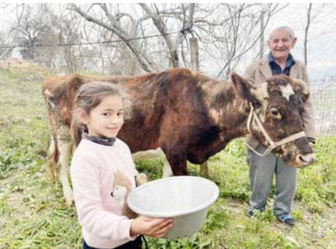
مشروع البقرة الحلوب في البانيا

العتاء والإنتاج. ودعا الشقراء، أهل الخير إلى دعم المشاريع التنموية التي تعمل على القضاء على الفقر بشكل جذري وفعال.