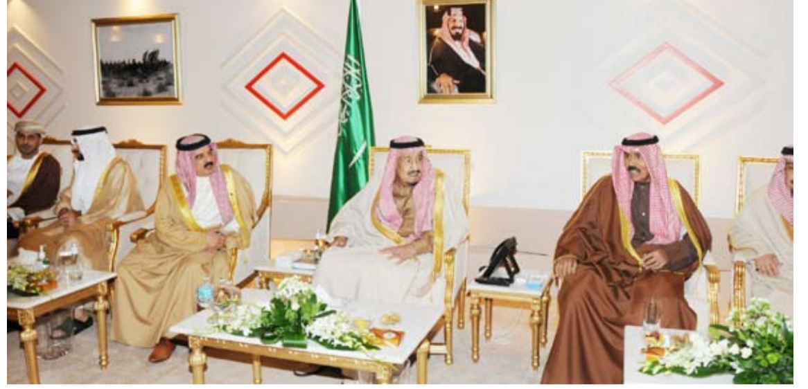
سمو الأمير الشيخ نواف الأحمد والملك سلمان بن عبد العزيز

المنتج في العالم، كما أن الاتفاقيات الاقتصادية الموقعة بين البلدين ضمن إطار مجلس التعاون الخليجي أدت إلى نمو ورواج حركة الواردات بينهما بمعدلات شبه مستقرة. وحلت المملكة في هذا الإطار المرتبة الأولى كمشرك تجاري للصادرات الكويتية خلال الربع الأخير من العام الماضي، إذ تفتت قيمتها بنسبة 113 في المئة. وعلى الصعيد البرلماني، فإن التعاون بين مجلسي الأمة الكويتي والشورى السعودي منتم على الدوام عبر لجنة الصداقة المشتركة وتبادل الزيارات والتنسيق المشترك في المحافل الدولية بشأن القضايا الإقليمية والعربية والدولية والإستراتيجيات الثنائية. ويأتي ذلك انسجاماً مع مسيرة العلاقات العميقة التي رسختها قيادات البلدين وعززتها العلاقات الاجتماعية والأسرية التاريخية التي تجمع بين الشعبين الشقيقين ووحدة اللغة والدين.