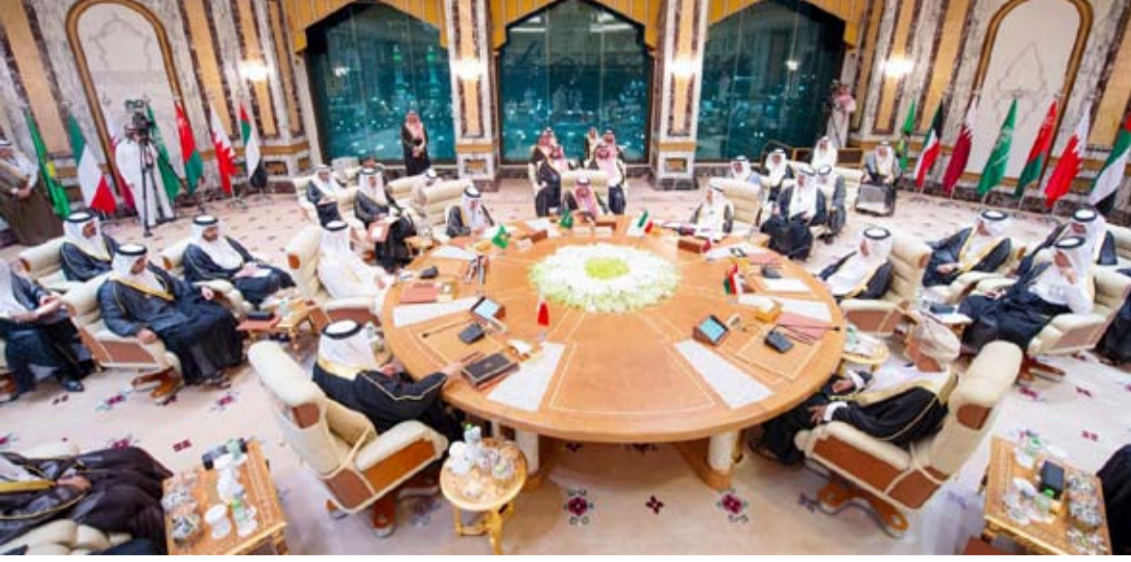
جانب من أعمال القمة الخليجية الطارئة في مكة المكرمة عام 2019