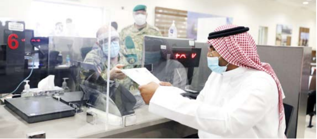
جانب من استقبال المتقدمين

تضمن العدالة للجميع في عملية القبول بعد استيفاء الشروط التي لا بد من توافرها في المتقدمين، ومن خلال استخدام الوسائل الإلكترونية الحديثة بإجراء قرعة علنية للاختيار من بين المتقدمين للتخصصية من المتقدمين والاختبارات التخصصية من المتقدمين لبحظي بالحصول على شرف الدفاع عن تراب الوطن جنباً إلى جنب مع إخوانه في الحرس الوطني وزملاء السلاح بالجيش والشرطة وقوة الإطفاء العام.