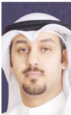
د. محمد ضيف الله العتيبي

وسائل التواصل الاجتماعي نوعا من الدعم المباشر والمهم لما يتبدله وتقوم به مختلف مؤسسات الدولة في توعية الشارع الكويتي حول فيروس كورونا المستجد (كوفيد -19). وقال أستاذ الإعلام في جامعة الكويت الدكتور محمد ضيف الله العتيبي لـ (كونا) أمس الثلاثاء: إن منصات وسائل التواصل الاجتماعي على الشبكة العنكبوتية تلعب دورا مهما وجوهريا في تعبئة الأفراد في هذه الحرب التي تخوضها المجتمعات الإنسانية قاطبة ضد هذا الفيروس. وأضاف العتيبي أن مؤسسات الدولة المختلفة تجدتها تبت موادها وتعليماتها في هذه الأيام التي تمر بها البلاد من خلال حساباتها في مواقع التواصل الاجتماعي بسهولة وسرعة إيصال رسالتها إلى شريحة الأوسع المستهدفة وهذا ما يتجسد في ظهور الهاشتاغات التوعوية في هذه الأيام. ونذكر أن الهاشتاغات التي أخذت أعلى مستوى من التفاعل في الأونة الأخيرة هي التي تختص بموضوع فيروس كورونا "لأنه حدث الساعة في العالم أجمع"، مشيرا إلى التراجع الكبير لجميع المواضيع الأخرى لصالح كورونا. وأوضح أن الهمم (هاشتاغات) بعد من أفضل أدوات القياس المتاحة التي تستطيع من خلالها المؤسسات قياس مدى تفاعل الجماهير مع رسائلها من خلال ما تطلقه من حملات اعلامية أو توعوية تجاه قضية معينة.