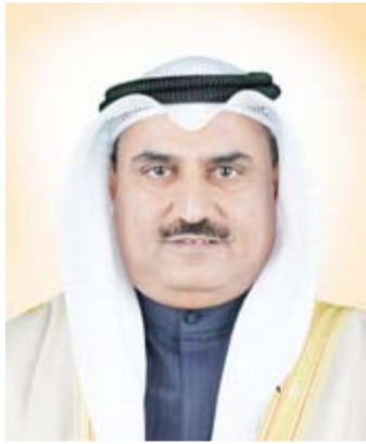
وزير التربية د. سعود الحربي

أعلنت وزارة التربية الكويتية مساء أمس الأول السماح لأعضاء الهيئتين التعليمية والإدارية من المقيمين بالسفر إلى بلدانهم - متى ما سححت لهم الظروف - دون الحصول على تصريح بالسفر (إذن الخروجية) من المدارس أو المناطق التعليمية التابعين لها. وقالت (التربية) في تغريدة بثقتها عبر حسابها الرسمي بموقع التواصل الاجتماعي (تويتر) إن القرار الذي جاء بناء على تعليمات وزير التربية وزير التعليم العالي الدكتور سعود الحربي بالتنسيق مع وزارة الداخلية يستهدف الحرص على سلامة موظفيها وتنفيذ لقرارات مجلس الوزراء وتوجيهات وزارة الصحة بالحد من التجمعات. وأوضحت أنه فيما يتعلق بالمعلمين والإداريين الذين تنتهي صلاحية إقامتهم خلال فترة الإجازة وهم خارج البلاد سيتم التنسيق مع سفارة دولة الكويت داخل بلدانهم لحل أي عائق قد يواجههم.