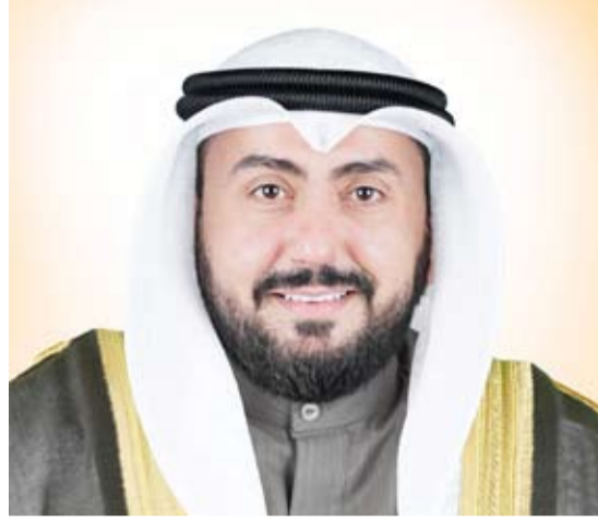
الشيخ الدكتور باسل الصباح

أنهوا فترة الحجر الصحي إلى 708 أشخاص بعد إتمام المدة المحددة لذلك والقيام بكل الإجراءات الوقائية والتأكد من خلو جميع العينات المخبرية من الفيروس. وجدد دعوة وزارة الصحة للمواطنين والمقيمين الكرام إلى الالتزام بكل القرارات والتوصيات الصادرة من الجهات الرسمية في الدولة وتوصيات منظمة الصحة العالمية واتباع استراتيجية التباعد الاجتماعي لتقليل فرص الإصابة وانتشار العدوى بين المخالطين واحتواء انتشار فيروس كورونا والقضاء عليه.