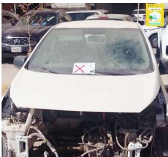
وضع ملصق على سيارة مهملة

كشفت إدارة العلاقات العامة في بلدية الكويت عن قيام إدارة النظافة العامة وإشغالات الطرق بفرع بلدية محافظة العاصمة بتنفيذ جولات ميدانية خلال اليومين الماضيين من قبل المفتشين لمتابعة محافظة النظافة بالمحافظة للتأكد من غسيل وتعقيم الحاويات كأحد الإجراءات الاحترازية والوقائية للحد من انتشار فيروس كورونا المستجد.