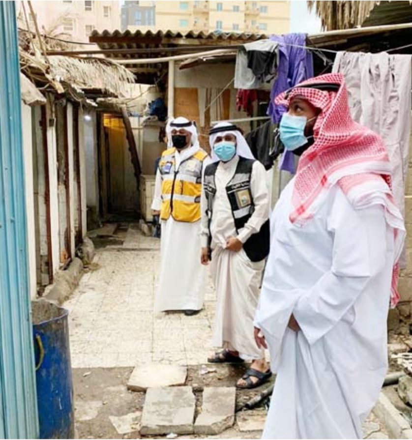
جانب من جولة الشيخ طلال الخالد الميدانية

ونوه بأن «المحافظة ماضية في توجيهها وإصرارها للقضاء على جميع مخالفات البناء في مناطقها»، مشيراً إلى أن «تطبيق القانون يتم على الجميع ولا وجود لآية انتقائية في هذا الشأن ولا توقف للحملة نهائياً إلا بعد الانتهاء تماماً من هذه المخالفات». وكشف الخالد عن «عقارات استثنائية في منطقتي شرق وبنيد القار يقطنها ما بين 600 إلى 700 شخصاً وهو ما لا يتناسب مع مساحات السكن ويتنافى مع الإجراءات الاحترازية والوقائية في مواجهة فيروس كورونا المستجد»، مشيراً إلى أن «حملة المحافظة لإزالة مخالفات البناء تواصل جهودها لمكافحة هذه المشكلة وإخراج هؤلاء السكان». وأشاد الخالد، بجهود وزارة الدولة لشؤون البلدية ممثلة في فريق الطوارئ لفرع بلدية المحافظة.