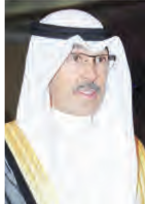
الشيخ فواز الخالد

يثل هذا الإنجاز في ظل الحاجة الماسة لدولة الكويت للغاز الطبيعي كطاقة بديلة تنطوي على العديد من المميزات علاوة على مردودها الاقتصادي والبيئي.