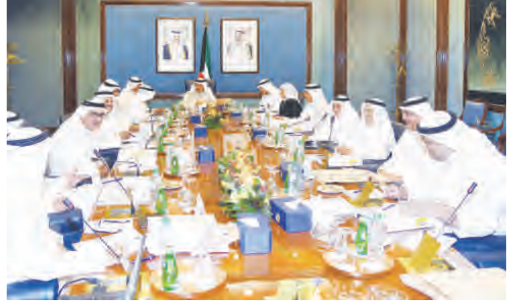
سمو الشيخ جابر المبارك مترئسا الاجتماع

ترأس سمو الشيخ جابر المبارك رئيس مجلس الوزراء في قصر بيان أمس الاجتماع التاسع عشر والمئة (2018/3) للمجلس الأعلى للبتترول. وناقش المجلس البنود المدرجة على جدول أعماله.