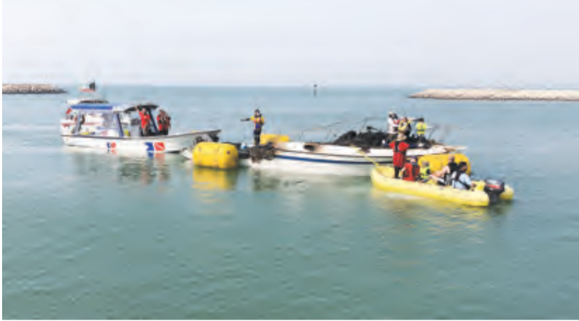
انتشال اليخت الغارق في ساحل «شرق»