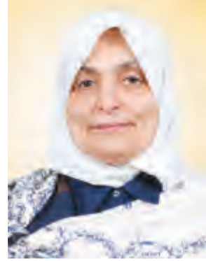
الوزيرة هند الصبيح

في وزارة الداخلية والتي من المقرر نقلها إلى الهيئة العامة للقوى العاملة. وبينت أن المسؤولين عن هذا النظام وعدوا بإتمام الربط الإلكتروني بدءاً من أول أكتوبر المقبل مشيرة إلى أن إجراءات الربط تحتاج إلى بعض الوقت نظراً لوجود معاملات إدارية وأخرى فنية ترتبط بالعملية مما يتطلب جهوداً متنوعة.