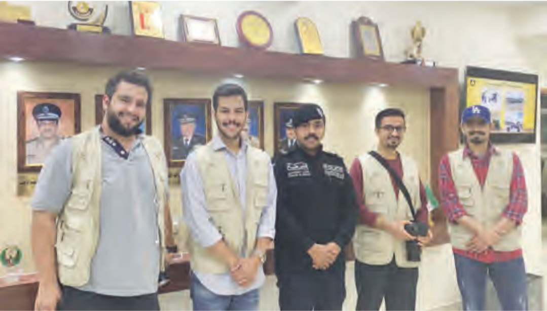
فريق زاجل التطوعي أثناء تكريم اللجنة التنسيقية لطوارئ الأمطار والسيول

قام فريق (زاجل) اللجنة التنسيقية لطوارئ الأمطار والسيول وتقديم الهدايا لهم في زيارة لمقرهم بإدارة الدفاع المدني.