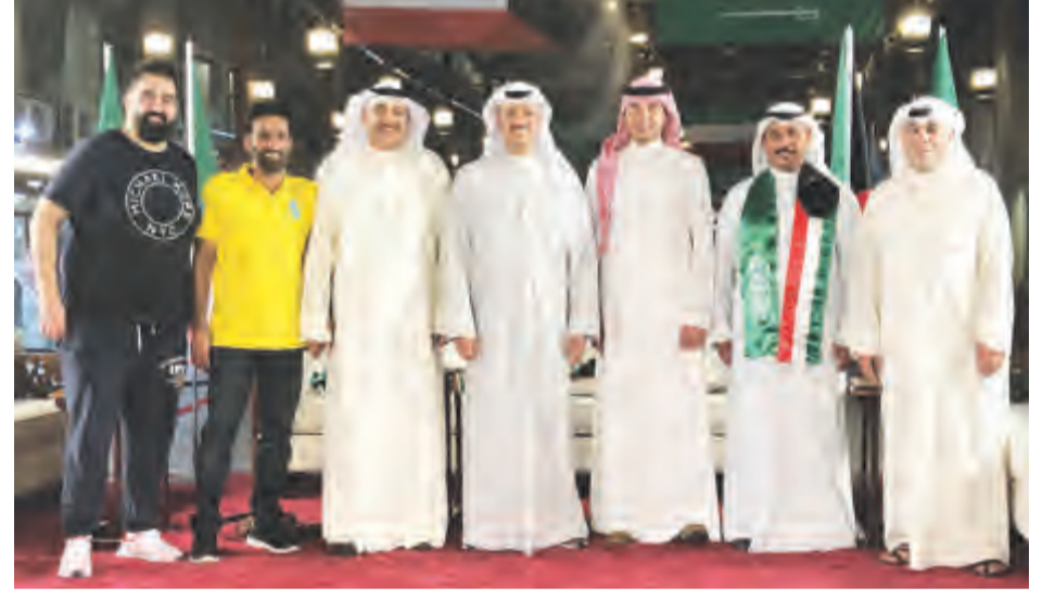
طارق المزرم بنوسط فريق العمل

أقامت وزارة الإعلام يوم أمس الأول احتفالية شعبية في «كنكس مبارك» في أسواق الميراث بمناسبة اليوم الوطني الثامن والثمانون للمملكة العربية السعودية، بحضور وكيل وزارة الإعلام طارق المزرم، وحشود جماهيرية من المواطنين وأبناء مجلس التعاون الخليجي والجالبات العربية والأجنبية.