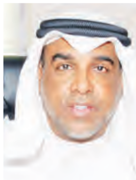
المستشار عبدالرحمن النمش

وأعتماد 500 مليون دينار كويتي (نحو 1.65 مليار دولار) لهذه المشاريع.