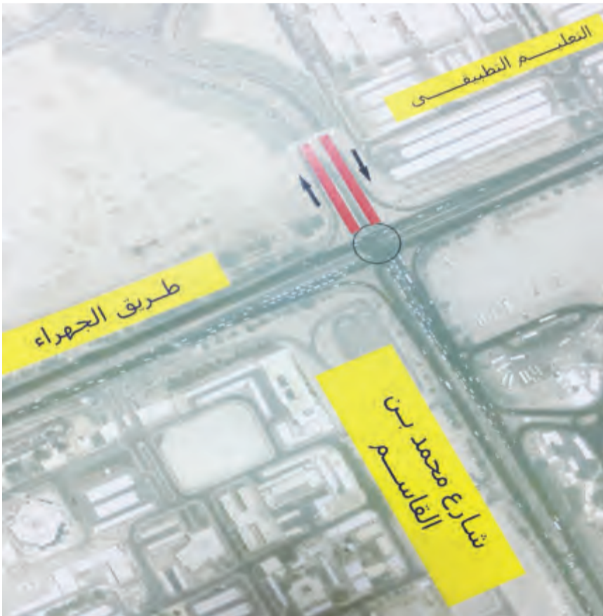
مدخل ومخرج مروري في شارع محمد بن القاسم

التطبيقي) وسيكون بطول 100 متر وبعد ثلاثة حارات مرورية في كل اتجاه.