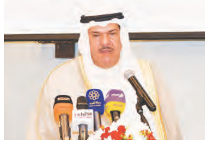
الشيخ سلمان الحمد متحدثاً

العامة للجمارك والشركات العاملة الأخرى في التسهيل على المسافرين. وفيما يتعلق بالاجتماع بالاجتماع الذي تستضيفه البلاد بالتعاون مع المنظمة الدولية للطيران المدني (إيكاو) أفاد الشيخ سلمان أنه يأتي