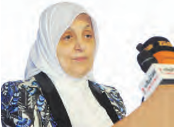
الوزيرة هند الصبيح متحدثة