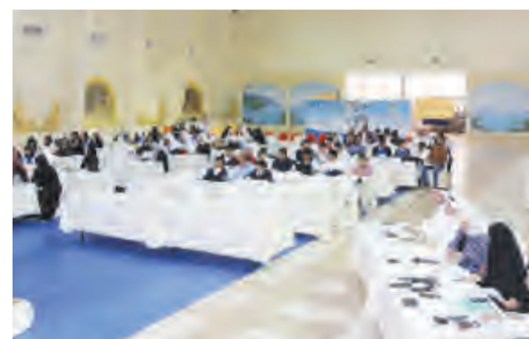
جانب من الطلبة المشاركين