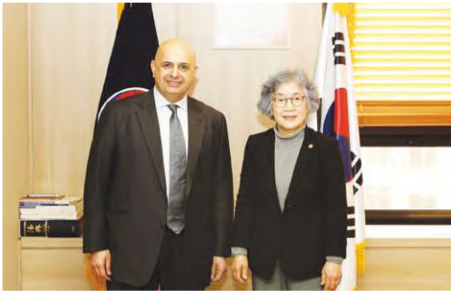
السفير بدر العوضي و رئيس لجنة مكافحة الفساد والحقوق المدنية الكورية باك أون جونغ

بمشاركة كبيرة من قبل شخصيات ومنظمات دولية. وشددت أون جونغ وفق بيان السفارة على حرصها على استغلال فرصة زيارتها للكويت للمشاركة في هذا المؤتمر لتعزيز التعاون بين كوريا الجنوبية والكويت في مجال تبادل الخبرات والتعاون في مجال مكافحة الفساد. وكادت الهيئة العامة لمكافحة الفساد (نزاهة) الكويتية قالت أخيرا أن تنظيمها لمؤتمر الكويت الدولي (نزاهة من أجل التنمية) يأتي تفعيلا لقراري مجلس الوزراء (419) و(528) بشأن تنظيم مؤتمر دولي لمكافحة الفساد وتعزيز النزاهة والشفافية بالقطاع الحكومي في الكويت.