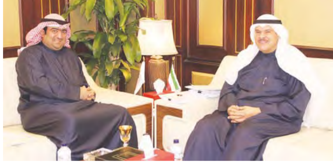
الوزير خالد الروضان خلال لقائه الشيخ سلمان الحمود

بحث وزير التجارة والصناعة ووزير الدولة لشؤون الخدمات خالد الروضان مع رئيس الطيران المدني الشيخ سلمان الحمود المواضيع التي تهم قطاع الطيران المدني والنقل الجوي في دولة الكويت. وأكد وزير التجارة والصناعة ووزير الدولة لشؤون الخدمات خالد الروضان عقب الزيارة بأن الحكومة تولي قطاع الطيران المدني أولوية خصوصا فيما يتعلق بتطوير البنية التحتية والتشريعية للقطاع وتأهيل الكوادر الوطنية القادرة على النهوض بالأعمال والمشاريع في مطار الكويت الدولي وأضاف الوزير الروضان بأنه بحث مع المسؤولين في الإدارة العامة للطيران المدني أهمية تدليل كل العقبات التي تواجه الخطط التطويرية للمشاريع القائمة في مطار الكويت الدولي لتحديث البنية التحتية ورفع كفاءة التشغيل وتحسين مستوى الخدمات المقدمة للمسافرين.