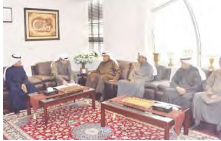
جانب من اللقاء