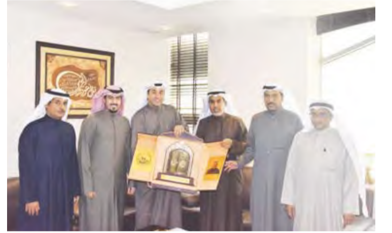
الوزير فهد الشعلة يتسلم درعاً من العرادة

مدير عام البلدية التي ستعظمه النقابة ضمن حملة حافز التي أطلقتها من أجل تطوير العمل في البلدية وإزدهارها لتواصل مسيرة البلدية في المشاركة في خدمة الوطن والمواطن.