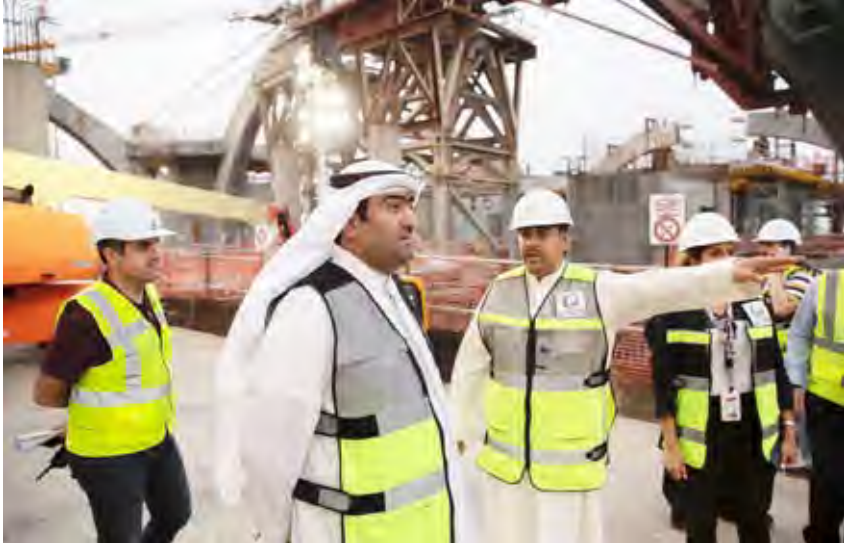
جولة في مبنى الركاب الجديد