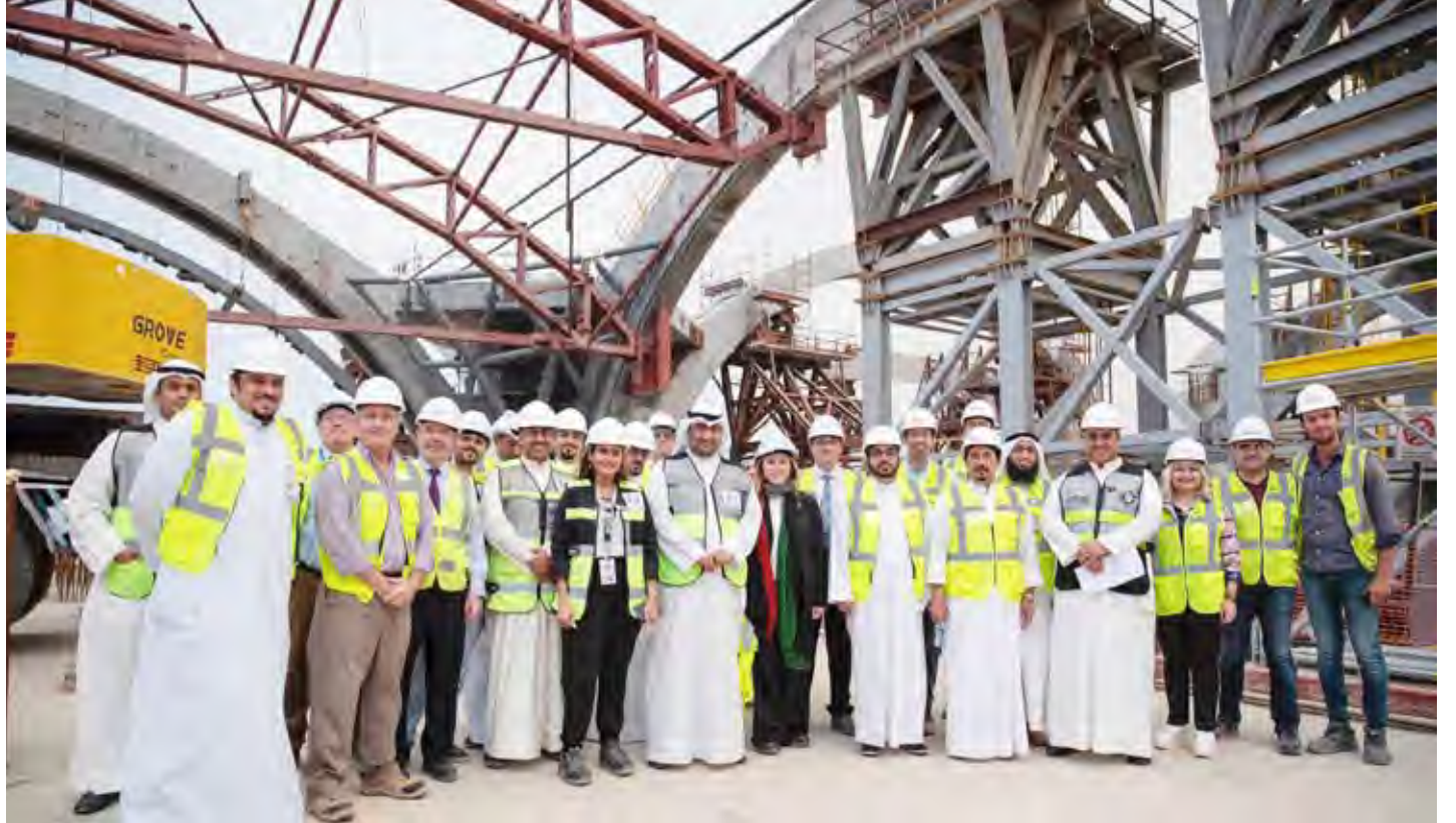
الوزير خالد الروضان أثناء تفقده لمشروع مبنى الركاب الجديد