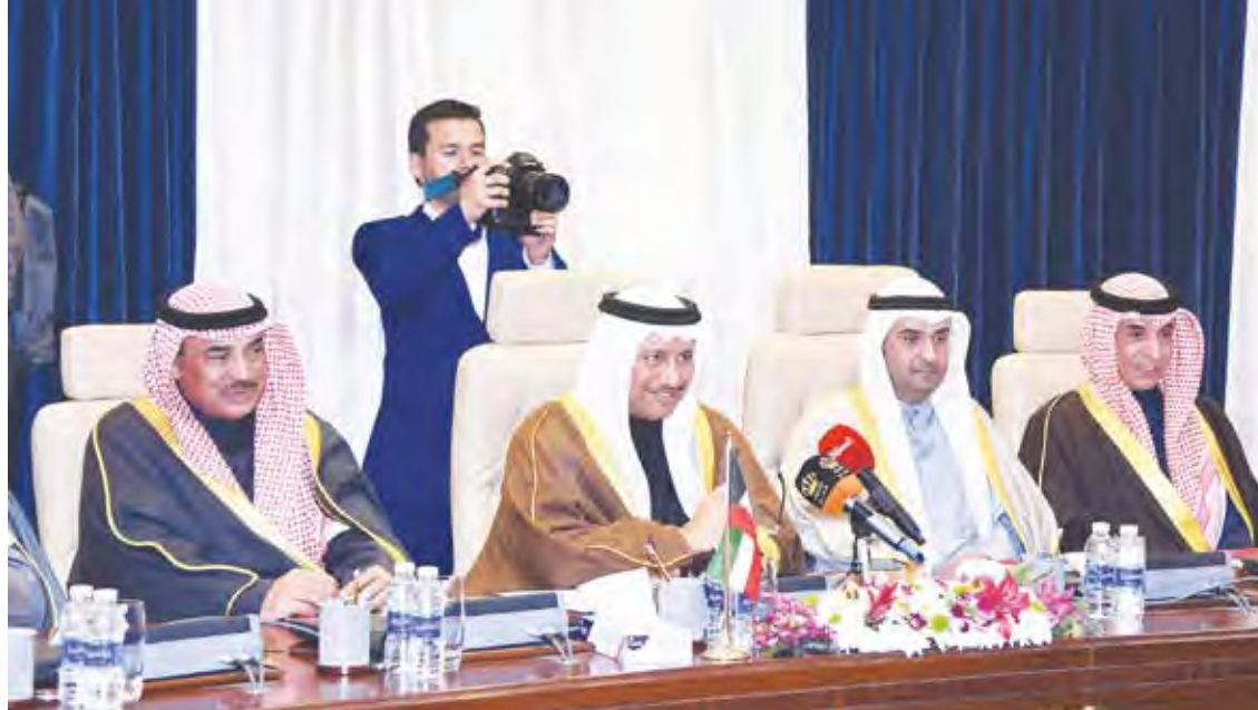
جانب من جلسة المباحثات الرسمية

الاستثمارات في الأردن والتي بلغت خمسة مليارات ونصف مليار دينار كويتي ونؤكد سعينا لزيادة هذه الاستثمارات بما يعزز الاقتصاد الأردني ويخلق فرص العمل لشعبه الشقيق. ونؤكد هنا أهمية الاجتماع المقبل نهاية شهر الجاري في لندن لدعم الاقتصاد الأردني كما نؤكد مشاركتنا فيه ودعمنا لمقاصده النبيلة. كما نتطلع إلى انعقاد أعمال الدورة الرابعة للجنة العليا الكويتية الأردنية والتي تتزامن مع هذه الزيارة والتي تشكل رافداً جديداً في سبيل تعزيز علاقاتنا الراسخة. وقد جرت المباحثات في أجواء ودية عكست العلاقات الثنائية التاريخية بين البلدين والروابط الأخوية المنيعة بين الشعبين الشقيقين.