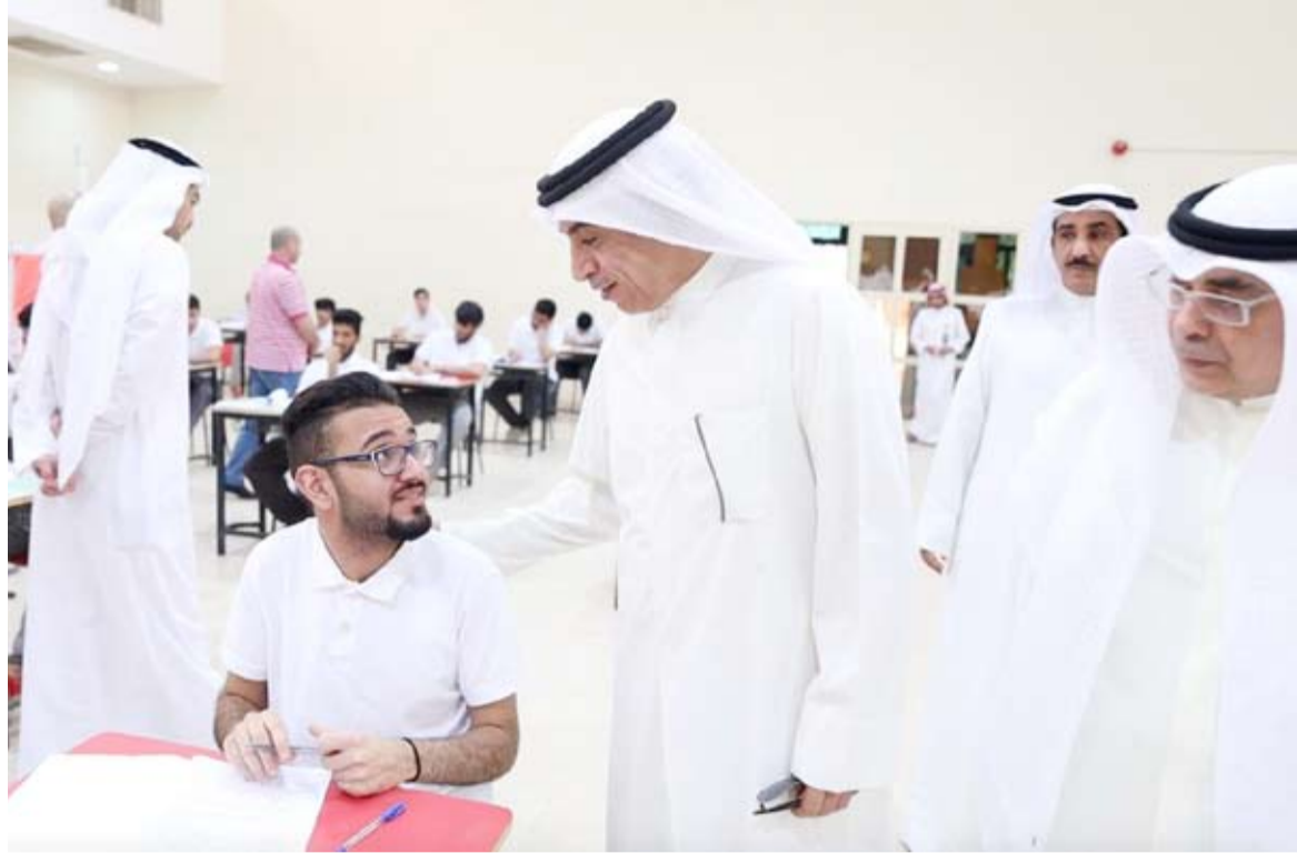
وزير التربية أثناء الجولة التفقدية بمنطقة العاصمة التعليمية