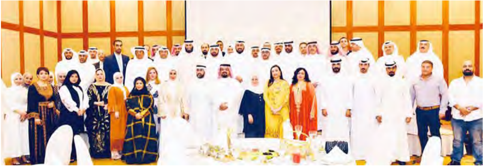
الشيخ الدكتور باسل الصباح في لقطة جماعية مع الحضور

خلال الغبطة الرضائية بالأمس، وأضاف: تسعى جمعية الصيدلة من خلال تشكيل الرابطتين المذكورتين إلى رفع مستوى مهنة الصيدلة والعلوم المتعلقة بها وتطويرها، ورفع مستوى الخدمات الدوائية للمواطنين وضمان تقديم أفضل الخدمات لهم.