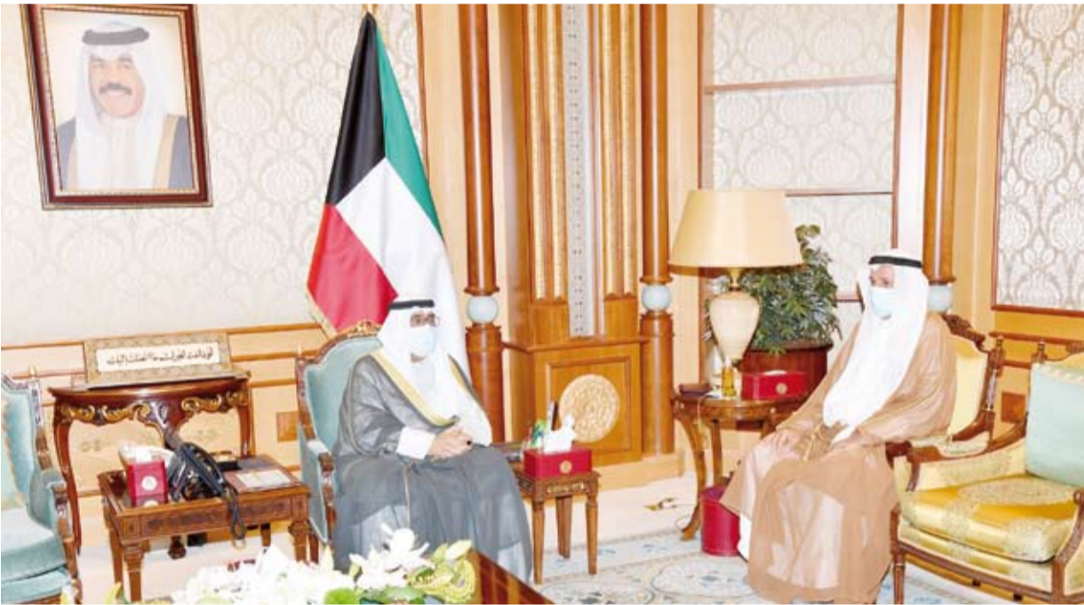
... وسموه يستقبل وزير العدل

استقبل سمو ولي العهد الشيخ مشعل الأحمد، أمس، نائب رئيس مجلس الوزراء وزير الدفاع الشيخ حمد جابر العلي ووزير الخارجية ووزير الدولة لشؤون مجلس الوزراء الشيخ الدكتور أحمد ناصر المحمد ووزير الداخلية الشيخ فامر العلي. كما استقبل سمو ولي العهد، نائب رئيس مجلس الوزراء ووزير العدل ووزير الدولة لشؤون تعزيز النزاهة عبدالله الرومي.