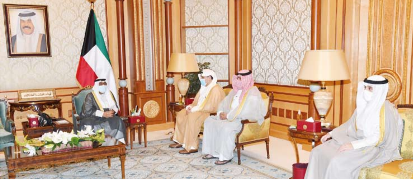
سمو ولي العهد يستقبل وزراء الدفاع والخارجية والداخلية