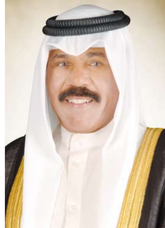
سمو أمير البلاد الشيخ نواف الأحمد

تلقى صاحب السمو أمير البلاد الشيخ نواف الأحمد، رسالة تعزية من أخيه الرئيس عبدالمجيد تبون رئيس الجمهورية الجزائرية الديمقراطية الشعبية، أعرب فيها فخامته عن خالص تعازيه وصادق مواساته لسموه بوفاته الشيخ منصور الأحمد (رحمه الله)، سائلاً فخامته المولى تعالى أن يتغمده الفقيد بواسع رحمته ومغفرته ويسكنه فسيح جناته، وأن يلهم سموه والأسرة الكريمة جميل الصبر وحسن العزاء.