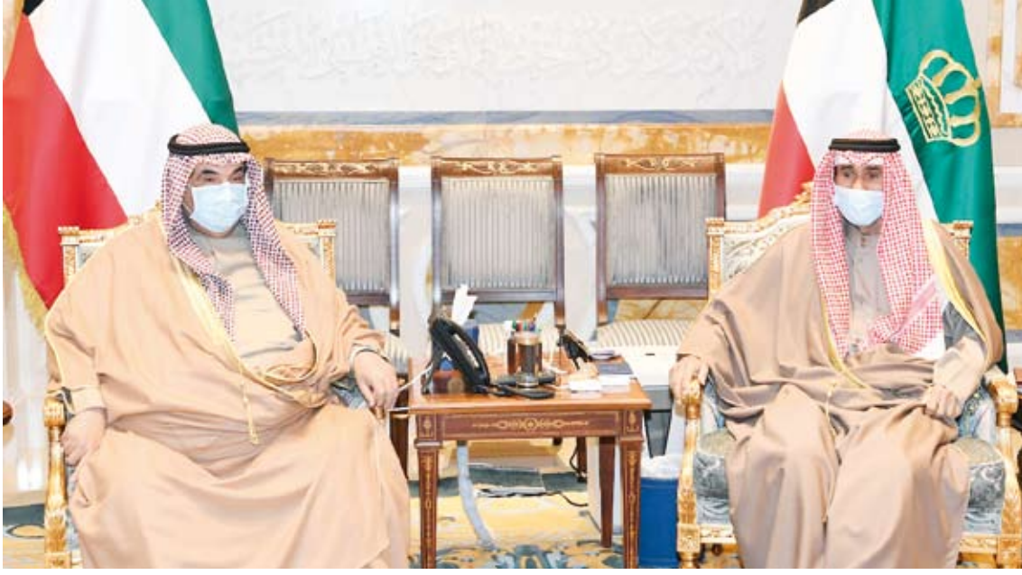
سمو أمير البلاد يستقبل سمو الشيخ ناصر المحمد

قالت وزارة الداخلية: إن الإدارة العامة لنظم المعلومات وبالتنسيق مع قطاع شؤون الإقامة قامت أمس بإطلاق خدمة نقل كفالة مادة 18 (قطاع خاص من كفالي إلى كفيل)، وذلك عبر موقع الوزارة الإلكتروني.