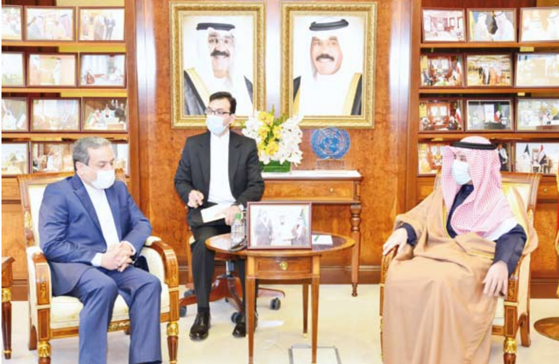
الشيخ الدكتور أحمد ناصر المحمد يستقبل نائب وزير الخارجية الإيراني

استقبل وزير الخارجية الشيخ الدكتور أحمد ناصر المحمد، في ديوان عام وزارة الخارجية صباح أمس، نائب وزير الشؤون الخارجية للشؤون السياسية في الجمهورية الإسلامية الإيرانية الصديقة الدكتور عباس عراقجي بمناسبة زيارته الرسمية والوفد المرافق إلى دولة الكويت.