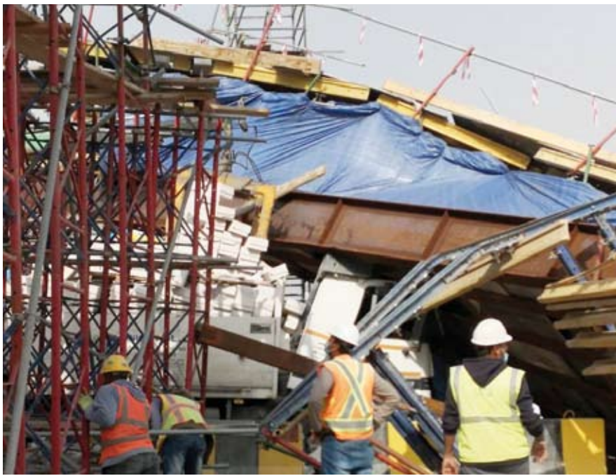
جانب من انهيار الجسر

أوقست الهيئة العامة للطرق والنقل البري أمس: إن جسراً قيد الإنشاء على طريق السلطان قابوس (الدائري السابع) تعرض لانهيار جزئي بسبب حادث اصطدام شاحنة. وأكدت الهيئة في بيان صحفي، أن الانهيار تمثل في «الشد الحديدي» الخاصة لتدعيم الأجزاء الخرسانية للجسر بعد أن اصطدمت به شاحنة محملة بمواد إنشائية دون وقوع أي أضرار مادية