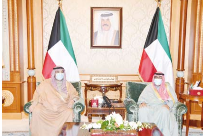
سمو ولي العهد يستقبل سمو الشيخ ناصر المحمد

استقبل سمو ولي العهد الشيخ مشعل الأحمد، بقصر بيان صباح أمس، سمو الشيخ ناصر المحمد.