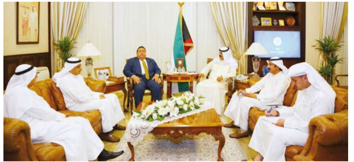
خالد الجار الله خلال لقائه السفير رافال ميلو

وبحث الطرفان عددا من أوجه العلاقات الثنائية بين البلدين إضافة إلى تطورات الأوضاع على الساحتين الإقليمية والدولية. وحضر اللقاء سفير دولة الكويت لدى كوبا محمد خلف ومساعد وزير الخارجية لشؤون مكتب نائب الوزير السفير أيهم العمر.