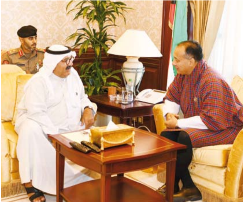
الشيخ ناصر صباح الأحمد يستقبل سفير بوتان تسرينج بنجور

وانغدي. حيث تم خلال اللقاء تبادل الأحاديث الودية ومناقشة أهم الأمور والمواضيع ضمن محور الزيارة، مشيداً معاليه بعمق العلاقات بين البلدين الصديقين، متمنياً لها المزيد من التطور والتعاون والعمل المشترك.