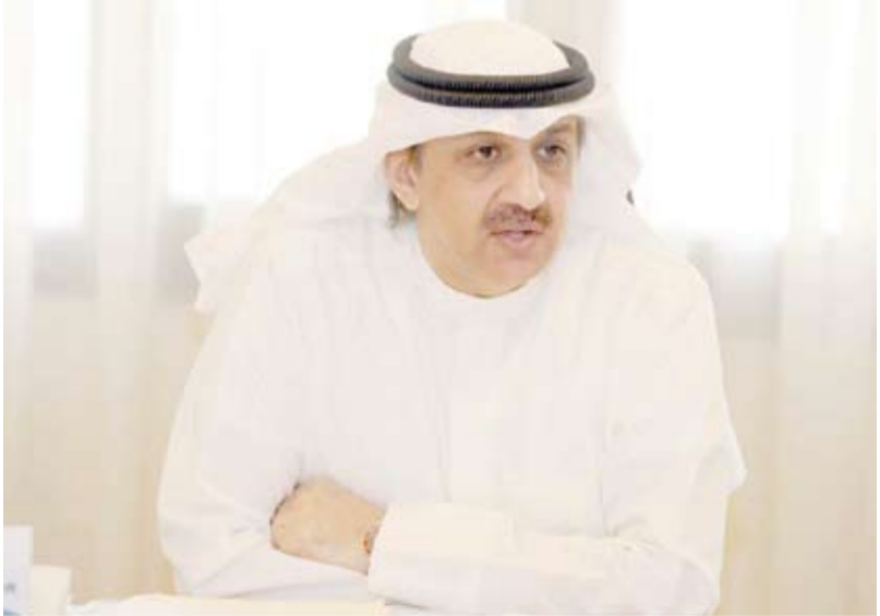
السفير سامي الحمد

«لذلك يأتي دور اللجنة القنصلية لمتابعة مثل تلك الشركات المهمة». ونوه بحجم التناسق والتناغم في الأطروحات من الجانب البحريني إذ تم التوقيع على محضر الاجتماعات الذي يضمن التعاون السلس في المجال القنصلي كاشفا عن رغبة الجانبين في تعيين ضباط ارتباط في سفارات البلدين لتسهيل الاتصالات بين قطاعات الدولة والسفارات المعنية. وأكد أن الوفدين اتفقا على تبادل الخبرات في موضوع إصدار التأشيرات والتصديقات على الوثائق الرسمية كما بحثا كيفية تحقيق مصالح الطلبة وتسهيل ما يحتاجونه من خدمات. وأكد الحمد عمق العلاقة الاخوية وجذورها التاريخية بين الكويت والبحرين والتي ساهمت في تسهيل الكثير من العقبات بين البلدين في جميع المجالات.