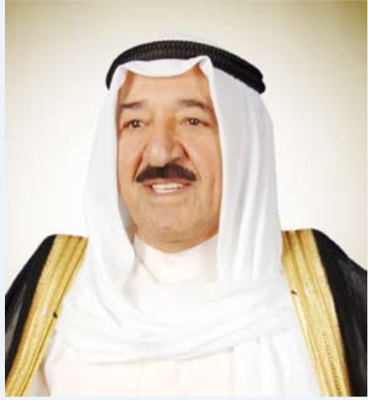
سمو أمير البلاد الشيخ صباح الأحمد

العيد الوطني لبلادهم متمنياً لفخامته موفور الصحة والعافية. كما بعث سموه ببرقية تهنئة إلى الرئيس باول كاجامي رئيس جمهورية رواندا الصديقة ضمنها سموه خالص تهنئته بمناسبة العيد الوطني لبلادهم راجياً سموه لفخامته دوام الصحة والعافية. كما بعث سمو الشيخ صباح الخالد رئيس مجلس الوزراء ببرقيات تهنئة مماثلة.