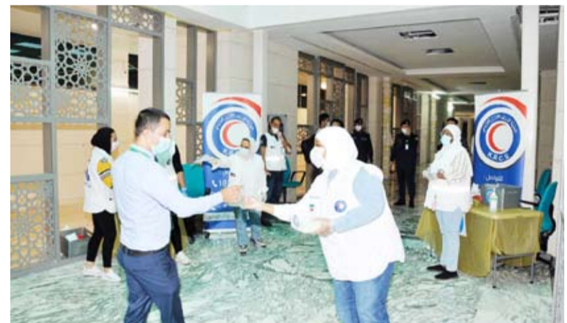
توزيع الكمادات على الموظفين والمرجعين

باشرت جمعية الهلال الأحمر الكويتي أمس الأربعاء بتوزيع سجادات الصلاة وكمادات وقفازات ومعقمات على الموظفين والمرجعين في مختلف مؤسسات الدولة مع بدء العودة للعمل في المرحلة الثانية من خطة الحكومة التدريجية كإجراء احترازي لمواجهة فيروس كورونا المستجد (كوفيد 19). وقال رئيس مجلس إدارة الجمعية الدكتور هلال السايبر في تصريح لـ (كونا): إن ذلك يأتي في سياق الجهود والمساعي الحثيثة التي تبذلها مختلف أجهزة ومؤسسات الدولة للحد من انتشار الفيروس مبيّناً أن التوزيع شمل مجمع الوزارات والنيابة العامة وديوان