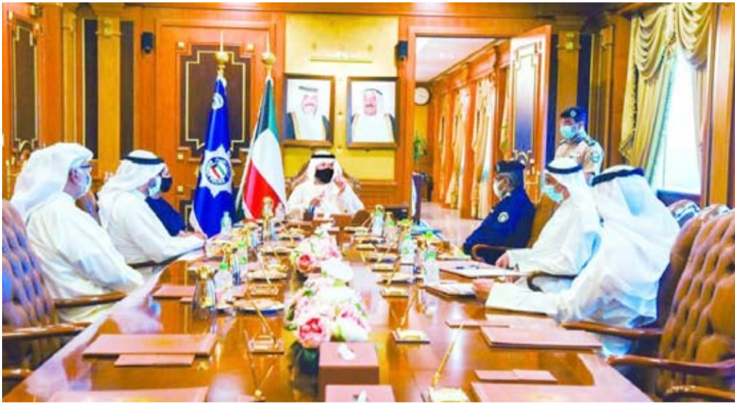
وزير الداخلية خلال الاجتماع