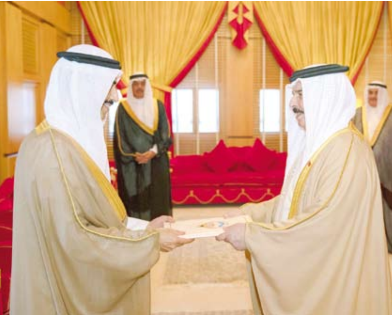
العاهل البحريني الملك حمد بن عيسى يتسلم أوراق اعتماد السفير الشيخ ثامر الجابر

تحمل الكويت في قلبه وما يخدم مصالح البلدين والشعبين الشقيقين. واستذكر بكل فخر «الوقفة المشرفة» للبحرين بقيادة وحكومة وشعبا في دعم الحق الكويتي أثناء الاحتلال العراقي والكرم والوفاء والرعاية التي قدمت للمواطنين الكويتيين في تلك الفترة. وأشاد بالرعاية الكريمة التي يحظى بها الطلبة والطالبات والقطاع الخاص والسائحون الكويتيون في بلادهم الثاني البحرين.