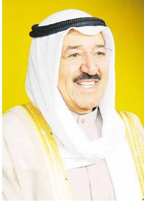
سمو أمير البلاد الشيخ صباح الأحمد