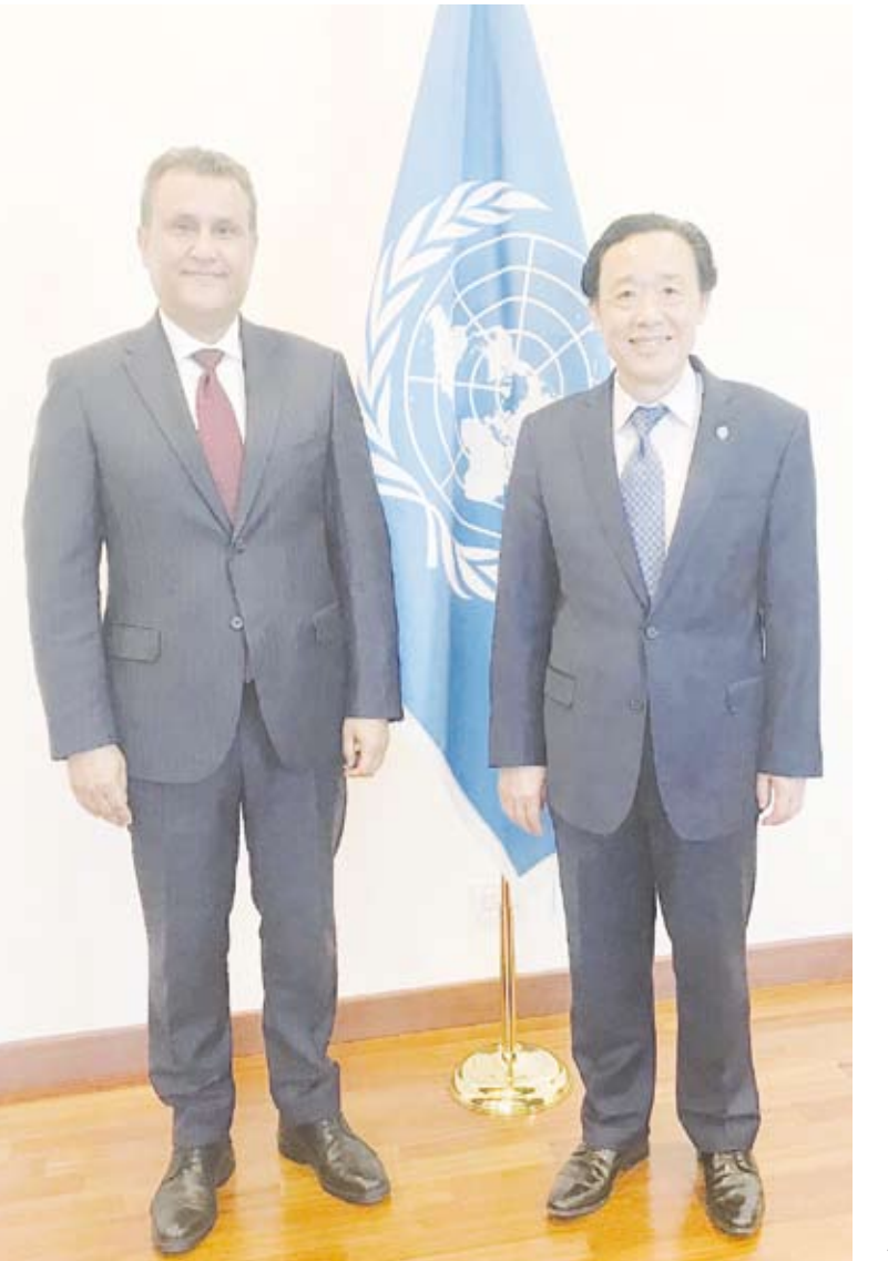
تشو دونغيو مع مندوب الكويت الدائم والرئيس الحالي للمجموعة العربية

داعمي دور المنظمة وعملها خاصة في مناطق الكوارث وحالات الأزمات الإنسانية، مشيرا إلى مساهماتها القوية المتعددة التي توجتها مبادرات سمو أمير البلاد ومبادراته الإنسانية الرائدة وقيادته في مساندة عمل المنظمات الدولية. ولفت دونغيو إلى المبادرات الهادفة سواء في حالات الطوارئ مثل انشاء (صندوق الحياة الكريمة) في مواجهة تفشي الجوع والتداعيات العالية الخطيرة لأزمة ارتفاع أسعار الغذاء وتلك التي تعالج جذوره عبر التنمية المستدامة مثل انشاء صندوق دعم المشروعات الصغيرة والمتوسطة. كما أشار إلى إحياء المجتمع الدولي ذكرى تسمية سمو أمير البلاد الشيخ صباح الأحمد الجابر الصباح قائدا للعمل الإنساني مؤكدا الحرص على ترسيخ أطر التعاون والشراكة مع الكويت باعتبارها مركزا عالميا للعمل الإنساني وشريكا رئيسيا للمنظمة. وفي هذا الصدد أعرب دونغيو عن تطلعه إلى دعم الكويت ومعها دول الاقليم لمبادرة (يد بيد) وأن تكون الكويت منصة لهذه المبادرة التي تعزز (فاو) اطلاقها في اطار تعزيز التعاون المباشر فيما بين بلدان الجنوب كدعامة لاستراتيجية الأمن الغذائي واستقرار الامدادات بين الدول المنتجة التقليدية والدول الحضرية مثل الكويت. ومن جانبه أعرب جليل في تصريح لـ (كونا) بشأن الاجتماع عن تقديره للتجاوب المتحمس من قبل المدير العام الجديد والأسبوي الأول الذي يقود منظمة حيوية ورئيسية لاستقرار ورخاء ومستقبل العالم وادراكه لدور الكويت الريادي في مجال التعاون بين دول الجنوب