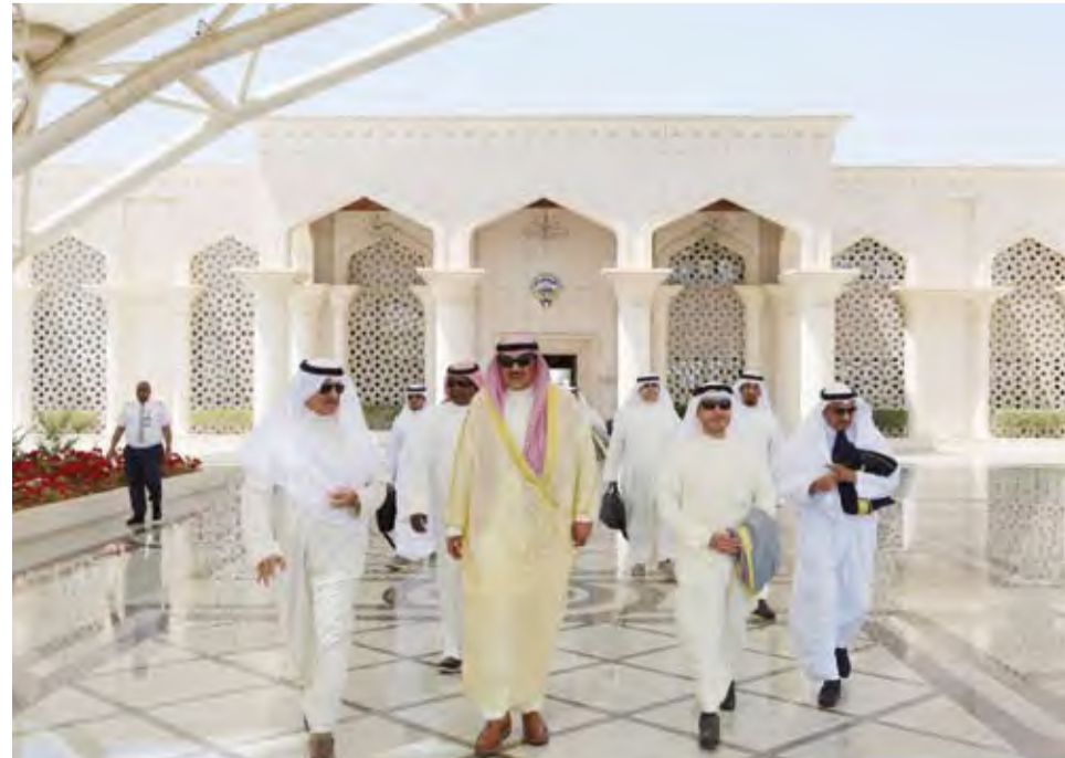
الشيخ صباح الخالد لدى مغادرته البلاد

أكد سفير الكويت لدى جمهورية سريلانكا الديمقراطية الاشتراكية خلف بوظهير أمس الأحد عدم وجود مواطنين كويتيين حتى الآن ضمن الضحايا والجرحى جراء التفجيرات الإرهابية التي استهدفت عدة كنائس وفنادق في سريلانكا. وقال السفير بوظهير في بيان تلقته (كونا) إن السفارة على تواصل دائم مع الجهات المعنية للتأكد من عدم وجود مواطنين ضمن الضحايا والمصابين. وأضاف أن سفارة الكويت لدى سريلانكا تتناشد المواطنين الموجودين من مقيمين وسائحين توخي الحيطة والحذر وذلك بعد وقوع سلسلة التفجيرات الإرهابية. وذكر أن السفارة تدعو المواطنين إلى الالتزام بتعليمات السلطات المحلية وتؤكد حرصها على سلامة المواطنين واستعدادها التام لتقديم كافة وسائل المساعدة من خلال الاتصال على أرقام الطوارئ التالية: (009477665555) (00947676629) (0094773) (30007).