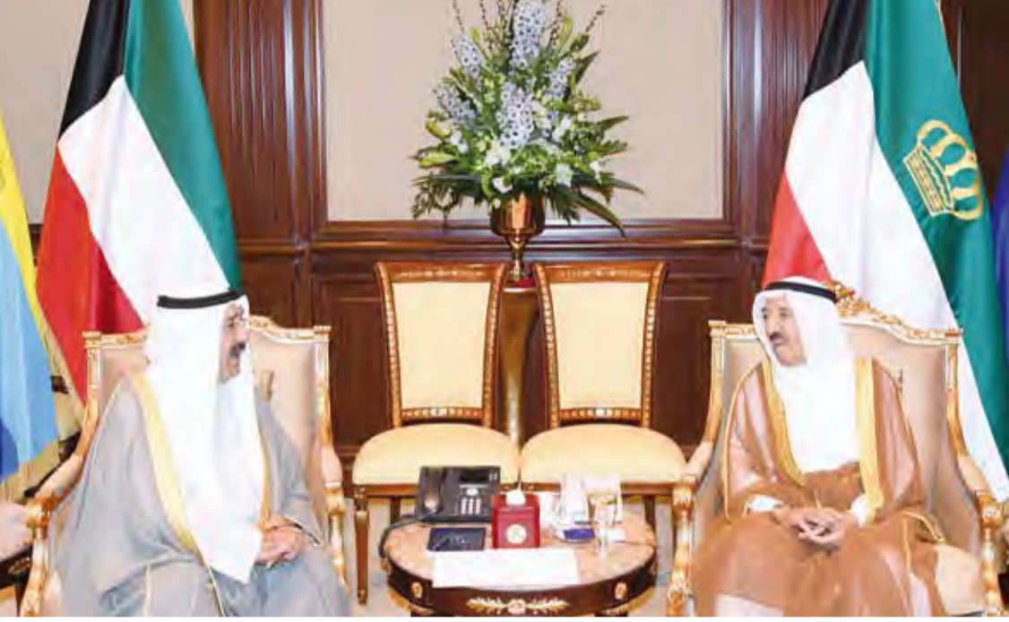
أمير البلاد يستقبل الشيخ ناصر صباح الأحمد