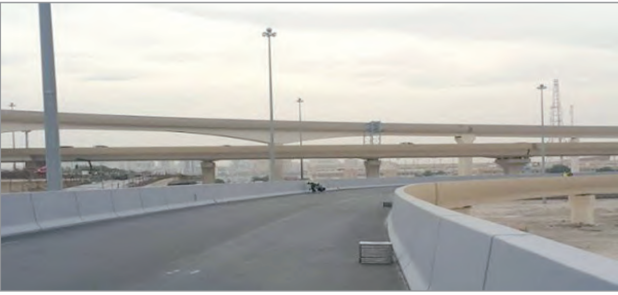
جانب من طرق المشروع