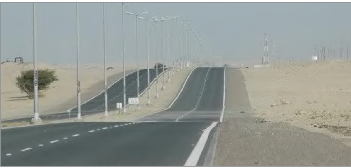
أحد الجسور التي تم فتحها

وبين بأن المشروع يتضمن تنفيذ طرق رئيسية بإجمالي أطوال (1.82) كيلومتر ويعرض (22) مترا، ويتكون من (2) حارة في كل اتجاه إضافة إلى 3 طرق فرعية بإجمالي أطوال (1.48) كيلومتر وعرض (9) أمتار مع تنفيذ 4 (مواقف سيارات بسعة إجمالية (580) سيارة لخدمة المنشآت القائمة المحيطة في المنطقة كمحافظة الجهراء ومدرسة الكويت ثنائية اللغة، والهيئة العامة للشباب والرياضة ومرور الجبراء، بالإضافة لتنفيذ وتطوير أعمال الخدمات الأساسية والبنية التحتية اللازمة للمشروع من شبكات أمطار وصرف صحي