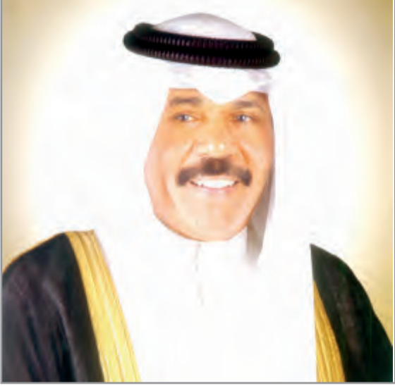
سمو ولي العهد الشيخ نواف الأحمد

تلقى سمو ولي العهد الشيخ نواف الأحمد اتصالا هاتفيا من أخيه صاحب السمو الملكي الأمير خليفة بن سلمان آل خليفة رئيس وزراء مملكة البحرين الشقيقة. عبر فيه سموه عن خالص التهاني واصدق التبريكات بمناسبة قرب حلول عيد الأضحى المبارك سائلا الله العلي القدير أن يعيد هذه المناسبة المباركة على سموه بموفقور الصحة