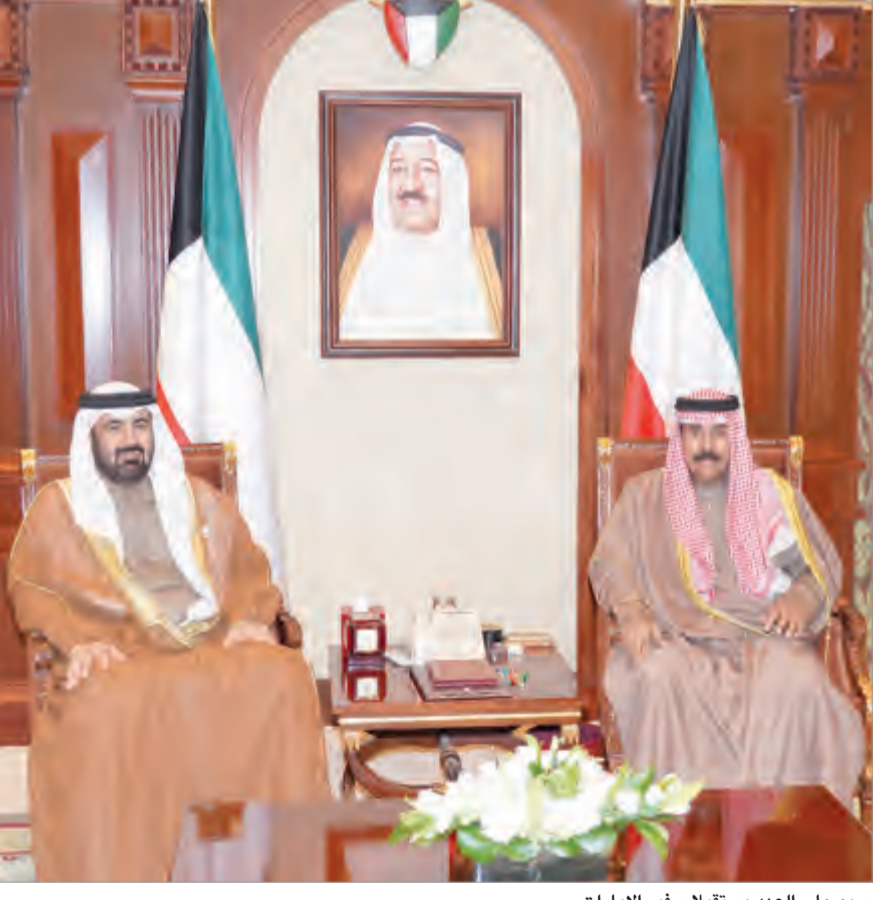
سمو ولي العهد يستقبل سفير الإمارات

استقبل سمو ولي العهد الشيخ نواف الأحمد بقصر بيان صباح أمس نائب رئيس مجلس الوزراء ووزير الخارجية الشيخ صباح الخالد حيث قدم لسموه سفير دولة الكويت لدى جمهورية نيجيريا الاتحادية الصديقة السفير عبدالعزيز محمد البشر وذلك بمناسبة تسلمه منصبه الجديد. وقد تمنى له سموه التوفيق والنجاح في مهام عمله والعمل على خدمة الوطن والمواطن وتعزيز