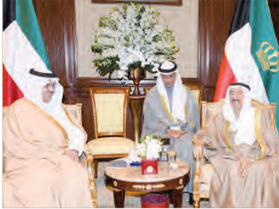
.. وسموه يستقبل سفير خادم الحرمين الشريفين الأمير سلطان بن سعد