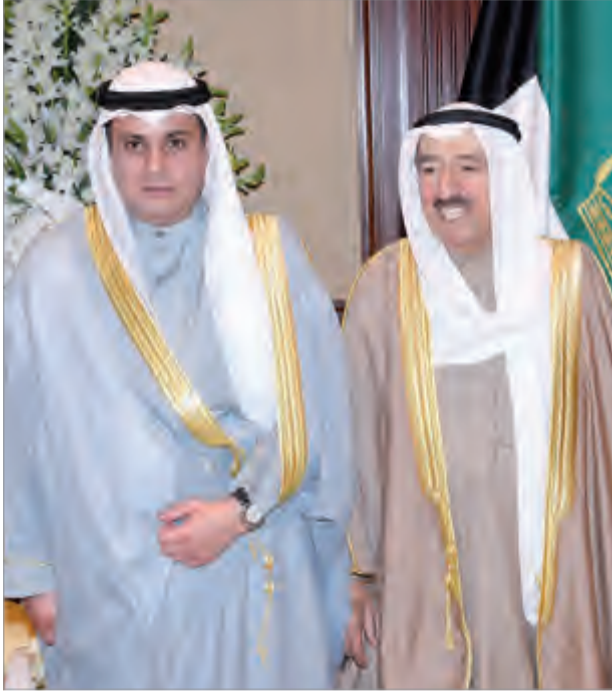
أمير البلاد يستقبل سفير الكويت لدى نيجيريا عبدالعزيز البشر