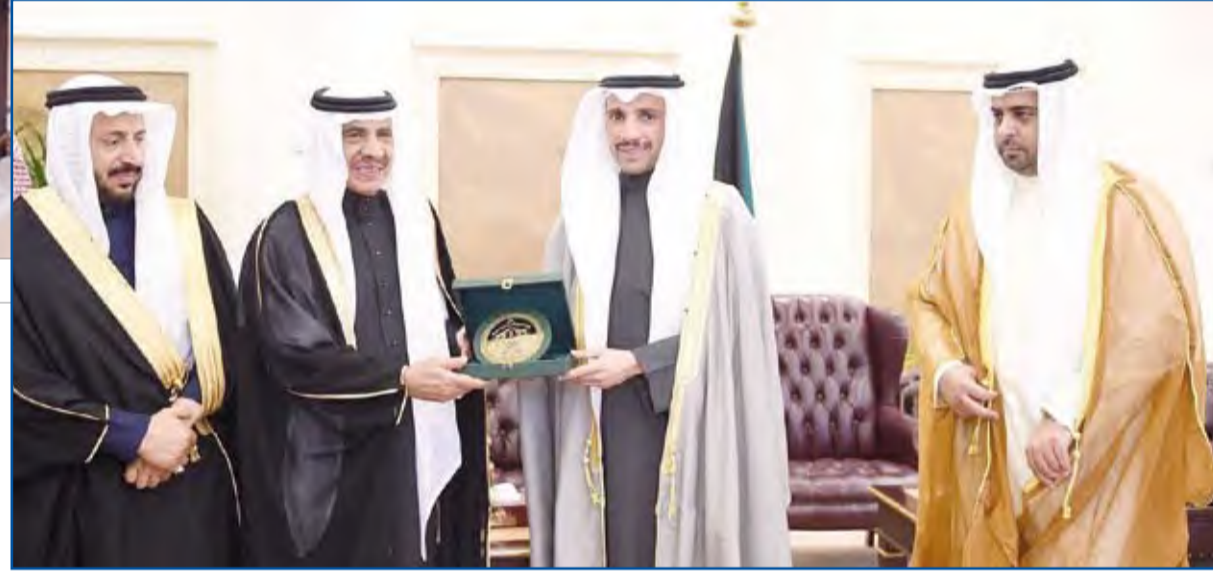
الغانم يتسلم درعاً من د. أحمد الغامدي

استقبل رئيس مجلس الأمة مرزوق الغانم في مكتبه أمس الخميس وفد مجموعة الصداقة السعودية-الكويتية برئاسة الدكتور أحمد الغامدي وذلك بمناسبة زيارته للبلاد. وجرى خلال اللقاء التأكيد على متانة العلاقة بين البلدين الشقيقين بقيادة وحكومة وشعبا وبحث سبل تعزيز وتوطيد العلاقات المتجنزة بين الشعبين. وتطرق اللقاء إلى بحث سبل تعزيز وتطوير التعاون بين مجلس الأمة الكويتي ومجلس الشورى السعودي إضافة إلى مناقشة عدد من القضايا والموضوعات ذات الاهتمام المشترك. حضر اللقاء وكيل الشعبة البرلمانية النائب ركان النصف. يذكر أن الوفد السعودي قد وصل إلى البلاد أمس الأول في زيارة رسمية إلى البلاد تستغرق ثلاثة أيام. كما استقبل رئيس مجلس الأمة مرزوق الغانم في مكتبه أمس سفير الكويت لدى دولة قطر الشقيقة حفيظ العجمي.