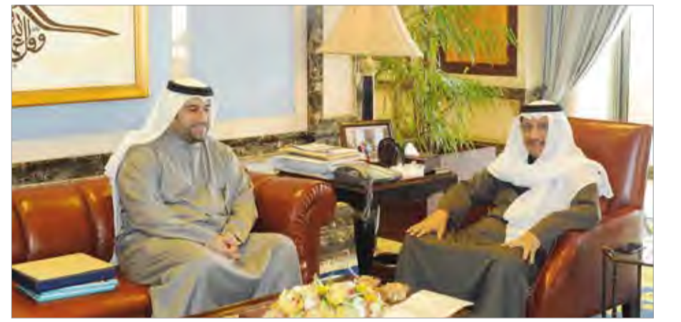
سمو الشيخ جابر المبارك مستقبلاً المستشار خالد المسعد

استقبل سمو الشيخ جابر المبارك رئيس مجلس الوزراء في قصر السيف أمس المستشار خالد عبدالله المسعد حيث اهدى سموه كتاباً بعنوان (تاريخ الكويت المصور).