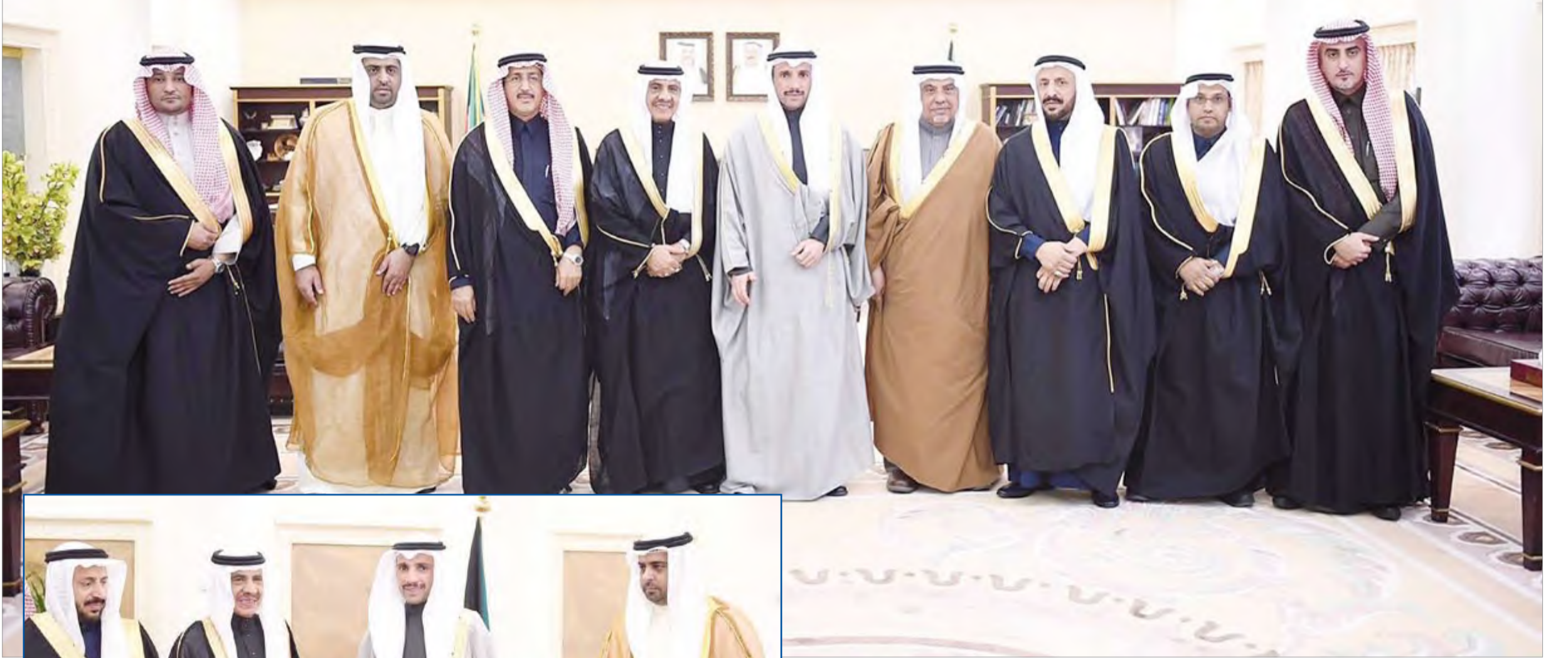
مرزوق الغانم خلال استقباله وفد مجموعة الصداقة السعودية-الكويتية