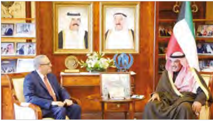
الشيخ صباح الخالد يستقبل سفير الولايات المتحدة الأمريكية لورانس سيلفرمان

العلاقات الثنائية الوطيدة التي تربط البلدين الشقيقين في كافة المجالات والتباحث حول آخر المستجدات على الساحتين الإقليمية والدولية ومناقشة القضايا محل الاهتمام المشترك. كما أجرى الشيخ صباح الخالد نائب رئيس مجلس الوزراء وزير الخارجية الكويتي أمس الخميس اتصالاً هاتفياً مع المبعوث الخاص للأمم المتحدة إلى اليمن مارتن غريفيث وذلك للوقوف على ما تم تحقيقه من إنجازات خاصة باتفاق ستوكهولم ومشاورات السلام التي عقدت في مملكة السويد بغية عودة الأمن والاستقرار إلى ربوع اليمن الشقيق. ووجد الشيخ صباح الخالد خلال الاتصال موقف دولة الكويت الداعم لكافة الجهود التي يقوم بها المبعوث الخاص وسماحه الرامية لإعادة الأمن والاستقرار وإحلال السلام في اليمن وتخفيف المعاناة الإنسانية عن شعبه الشقيق.