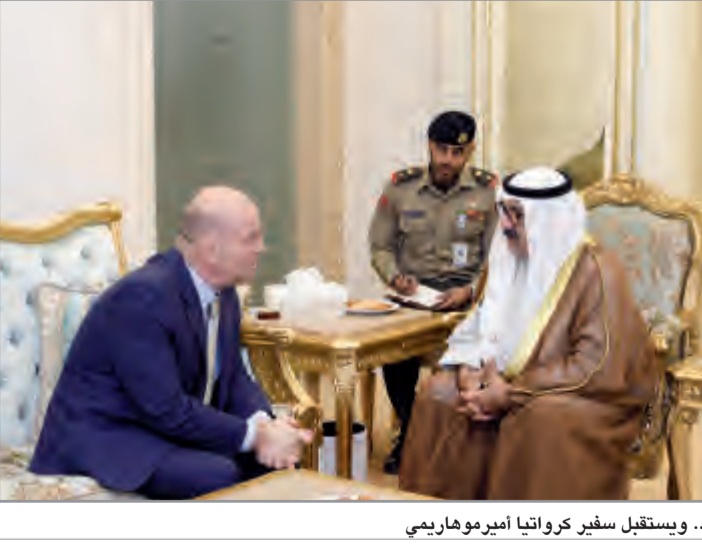
.. ويستقبل سفير كرواتيا أمير موهاريبي

العلاقات الثنائية بين البلدين الصديقين. كما استقبل النائب الأول لرئيس مجلس الوزراء ووزير الدفاع الشيخ صباح الخالد، في مجلس الأمة صباح أمس سفير الولايات المتحدة الأمريكية الصديقة لدى البلاد لورانس سيلفرمان ، يرافقه الملحق العسكري الرائد جيسون بيلكناب. حيث شهد اللقاء تبادل الأحاديث الودية، ومناقشة أهم الأمور والمواضيع ذات الاهتمام المشترك وسبل تعزيزها وتطويرها، مشيداً بمعالية بعقد العلاقات الثنائية بين البلدين الصديقين.