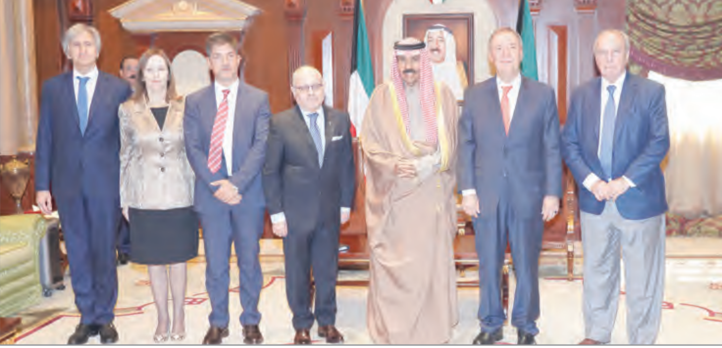
سمو ولي العهد يستقبل وزير خارجية الأرجنتين خورخي فاوري والوفد المرافق