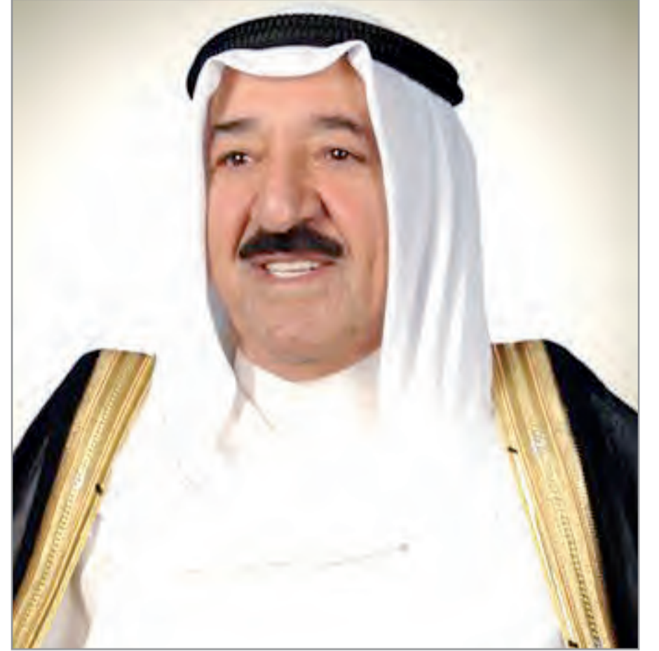
سمو أمير البلاد الشيخ صباح الأحمد

بعث صاحب السمو أمير البلاد الشيخ صباح الأحمد ببرقية تهنئة إلى الرئيس روش مارك كابوري رئيس بوركينا فاسو الصديقة عبر فيها سموه عن خالص تهنائه بمناسبة العيد الوطني لبلاده، متمنياً سموه لفخامته موفور الصحة والعافية وللبلد الصديق دوام التقدم والإزدهار.