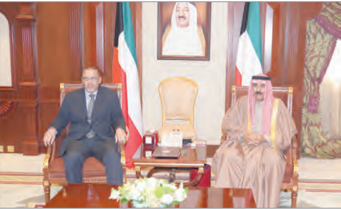
... وسموه يستقبل سفير موريتانيا حامد حموني

استقبل سمو ولي العهد الشيخ نواف الأحمد بقصر بيان صباح أمس نائب رئيس مجلس الوزراء ووزير الخارجية الشيخ صباح الخالد ووزير خارجية جمهورية الأرجنتين خورخي فاوري والوفد المرافق له وذلك بمناسبة زيارته للبلاد. واستقبل سمو ولي العهد سفير الجمهورية الإسلامية الموريتانية الصديقة لدى دولة الكويت السفير حامد حموني وذلك بمناسبة انتهاء مهام عمله سفيراً لبلادها. كما استقبل سمو ولي العهد سفير جمهورية سلوفاكيا الصديقة لدى دولة الكويت السفير بافول سفيتيك وذلك بمناسبة انتهاء مهام عمله سفيراً لبلادها. واستقبل سمو ولي العهد قنصل عام دولة الكويت لدى أربيل السفير الدكتور عمر الكندري، حيث أهدى سموه له كتاب بعنوان «نشاط حملة دولة الكويت للوقوف مع الشعب العراقي للفتره من 2015 لغاية 2018 في مجال العمل الإنساني والإغاثي والخيري».