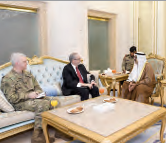
الشيخ ناصر صباح الأحمد يستقبل سفير الولايات المتحدة الأمريكية لورانس سيلفرمان