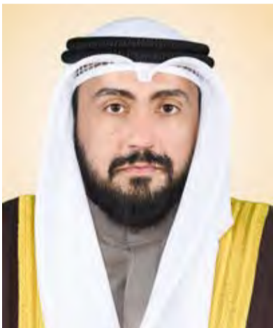
الشيخ الدكتور باسل الصباح

أصدر وزير الصحة الشيخ الدكتور باسل الصباح قراراً وزارياً بتعديل قيمة مراجعة الحوادث والمستشفيات للمقيمين المشمولين بنظام الضمان الصحي بالزيادة إلى 10 دنانير كويتية (نحو 33 دولاراً أمريكياً) بدلاً من 5 دنانير (16,5 دولار) التي كانت مقررة عام 2017. وقالت الوزارة في بيان صحفي أمس الأربعاء إن هذه الزيادة تأتي لتخفيف العبء عن أقسام الحوادث في المستشفيات وما تعانينه من تكسب وازدحام ورغبة من الوزارة في مراجعة المرضى لمراكز الرعاية الصحية التابعين لها والاستفادة مما تقدمه من خدمات ورعاية صحية أولية قبل توجيههم إلى المستشفى الذي يتبعونه له.