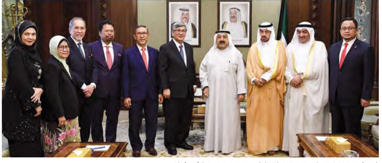
الشيخ باسل الصباح يستقبل الوفد الماليزي في الكويت

وحضر اللقاء رئيس بعثة الشرف النائب علي الدقباسي وسفير دولة الكويت لدى مملكة ماليزيا الصديقة سعد العسوي.