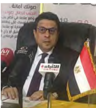
السفير المصري طارق القوني

رياض عواد أشاد السفير المصري بالكويت طارق القوني بالتعاون المثمر والجاد من السلطات الكويتية وما وفرته من تسهيلات تسهم في خروج عملية التصويت على التعديلات الدستورية متقدمة بالسكرو لوزارات الخارجية والداخلية والإعلام. وقال السفير القوني في المؤتمر الصحفي الذي عقد أمس لتوضيح استعدادات السفارة بشأن الإجراءات الخاصة بتصويت المصريين المقيمين بالكويت على التعديلات الدستورية ان التصويت سيكون في الفترة من 19 الى 21 الجاري بمقر السفارة اعتباراً من التاسعة صباحاً وحتى التاسعة مساءً، وأشار إلى أن المشاركة في الاقتراع حق دستوري وواجب وطني يحفظ أمن مصر واستقرارها داعياً أبناء الجالية المصرية للمشاركة بكثافة بكل حرية وبمظهر يليق بمكانة بلدهم خاصة ان الكثافة التصويتية للناخبين في الكويت تعد الأعلى على مستوى المصريين بالخارج خلال جميع الانتخابات السابقة وأخرها الانتخابات الرئاسية التي شهدت مشاركة 35 ألف ناخب.