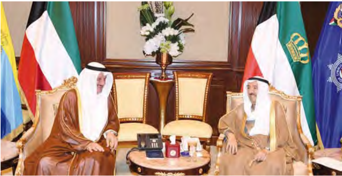
أمير البلاد يستقبل عيسى الكندري

استقبل صاحب السمو أمير البلاد الشيخ صباح الأحمد بقصر بيان صباح أمس سمو ولي العهد الشيخ نواف الأحمد، بعد أن مثل سموه في الحفل الختامي لمهرجان الملك عبدالعزيز للألابل الثالث الذي أقيم بالمملكة العربية السعودية الشقيقة. كما استقبل سموه وبحضور سمو ولي العهد الشيخ نواف الأحمد سمو الشيخ جابر المبارك رئيس مجلس الوزراء ومستشار جمهورية النمسا الصديقة سيباستيان كورس والوفد المرافق وذلك بمناسبة زيارةه الرسمية للبلاد. وتم خلال اللقاء بحث العلاقات الثنائية التي تربط البلدين والشعبين الصديقين وسبل دعمها وتمنياتها على كافة الأصعدة والقضايا ذات الاهتمام المشترك وآخر المستجدات على الساحتين الإقليمية والدولية، كما تم استعراض العلاقات الاقتصادية والتجارية والثقافية بما يسهم في دعم وتعزيز تلك المجالات بين البلدين الصديقين. وحضر المقابلة وزير شؤون الديوان الأميري الشيخ علي الجراح. كما استقبل سموه رئيس المجلس الأعلى للقضاء ورئيس محكمة التمييز ورئيس المحكمة الدستورية المستشار يوسف المطاوعة. واستقبل سموه رئيس مجلس الأمة بالانابة عيسى الكندري. كما استقبل سموه النائب الأول لرئيس مجلس الوزراء ووزير الدفاع الشيخ ناصر صباح الأحمد.