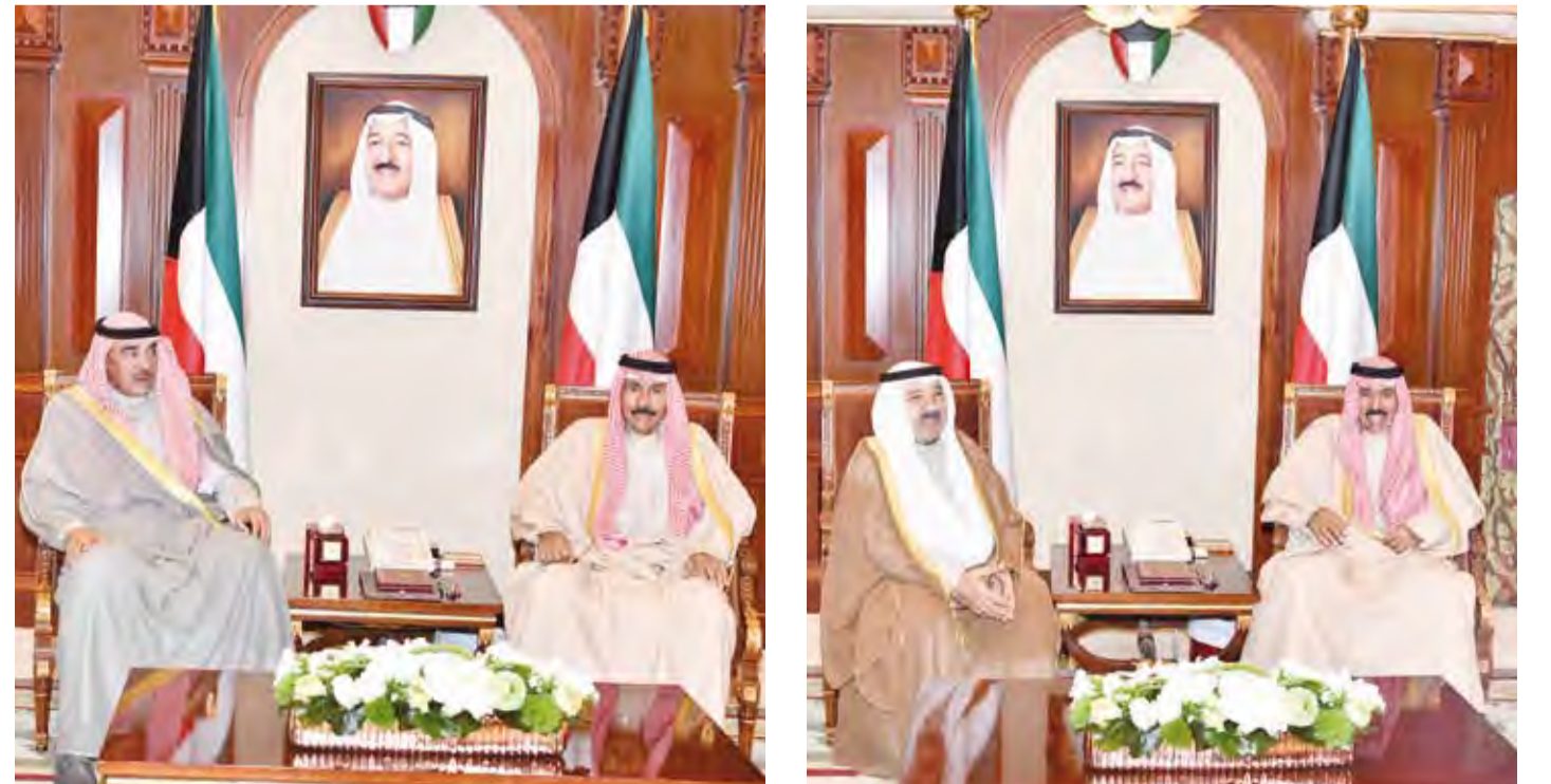
.. وسموه يستقبل الشيخ صباح الخالد