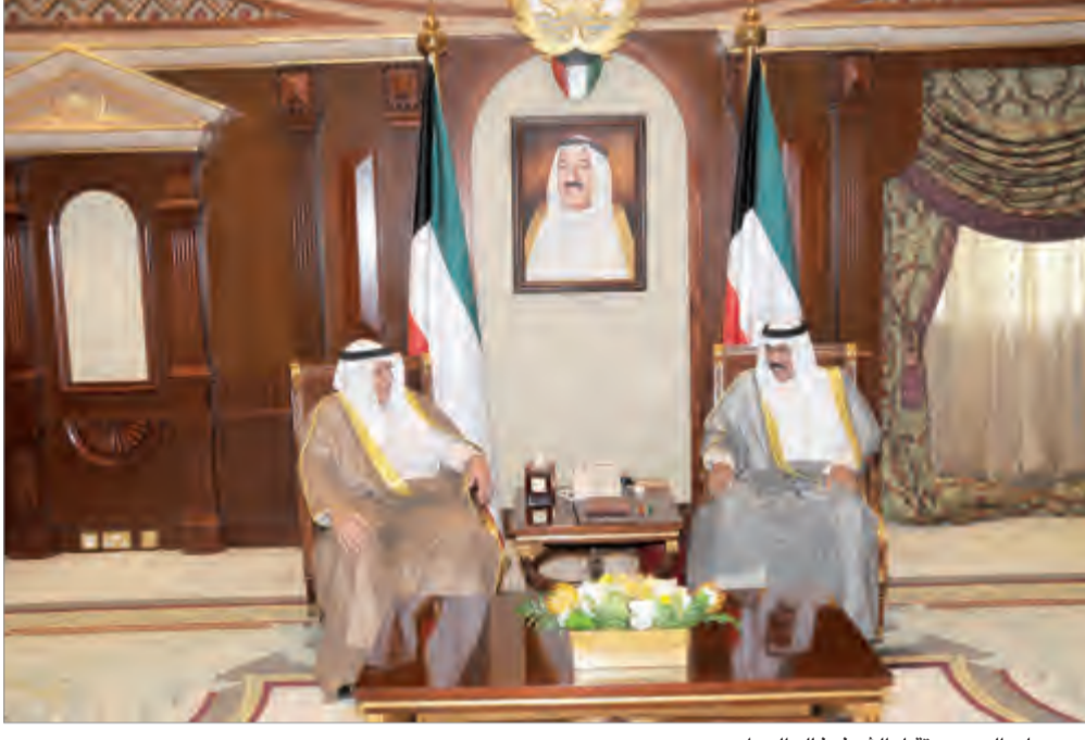
سمو ولي العهد يستقبل الشيخ خالد الجراح