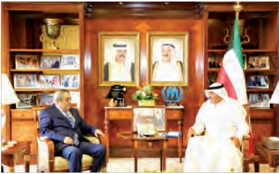
.. ويستقبل سفير أرمينيا

في ديوان عام وزارة الخارجية سفير جمهورية أرمينيا الصديقة مانفيل باديان بمناسبة انتهاء فترة عمله سفيرا للبلاد لدى الكويت. وأشاد الشيخ صباح الخالد خلال اللقاء بجهود السفير خلال فترة عمله في البلاد وإسهاماته التي قدمها في إطار دعم وتعزيز العلاقات الثنائية الوطيدة التي تربط بين البلدين الصديقين. وحضر اللقاءين مساعد وزير الخارجية لشؤون مكتب نائب رئيس مجلس الوزراء وزير الخارجية بالإنابة السفير صالح اللوغاني وعدد من المسؤولين في وزارة الخارجية.