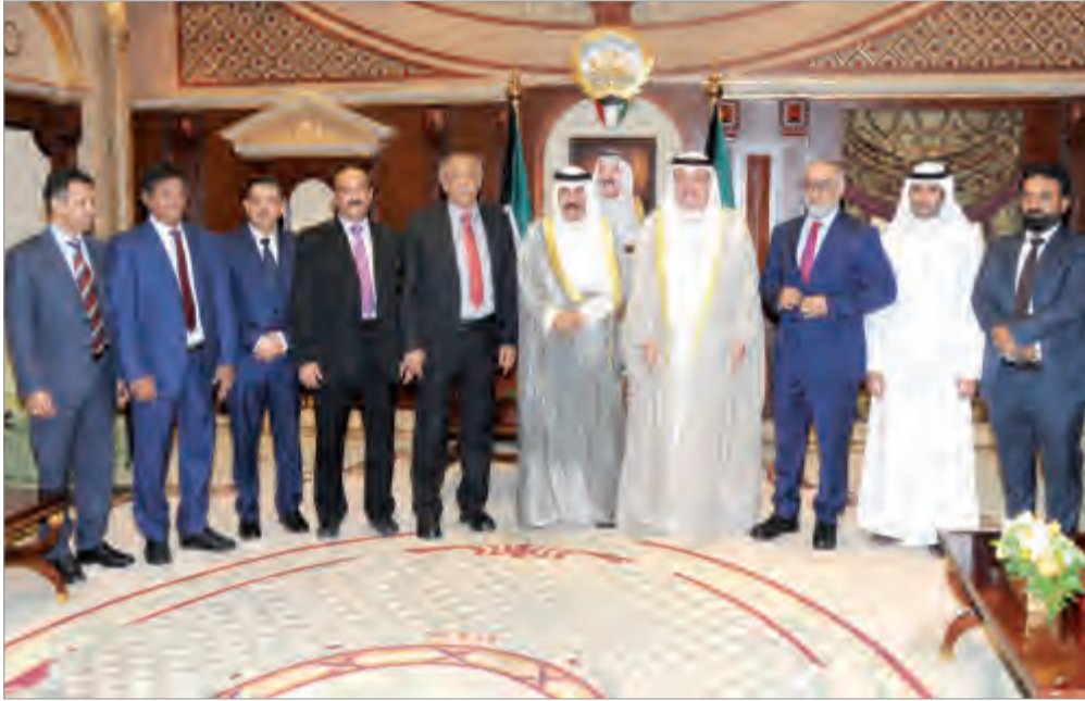
وسموه يستقبل الكندري ونائب رئيس مجلس النواب اليمني والوفد المرافق له

استقبل سمو ولي العهد الشيخ نواف الأحمد بقصر بيان صباح أمس سمو الشيخ جابر المبارك رئيس مجلس الوزراء، واستقبل سمو ولي العهد الشيخ نواف الأحمد نائب رئيس مجلس الوزراء ووزير الخارجية الشيخ صباح الخالد، واستقبل سمو ولي العهد نائب رئيس مجلس الوزراء ووزير الداخلية الشيخ خالد الجراح، واستقبل سمو ولي العهد الشيخ نواف الأحمد نائب رئيس مجلس الأمانة عيسى الكندري ونائب رئيس مجلس النواب اليمني محمد علي الشادي والوفد المرافق له وذلك بمناسبة زيارته للبلاد. وحضر المقابلة رئيس المراسم والتشريفات بديوان سمو ولي العهد الشيخ مبارك صباح السالم.