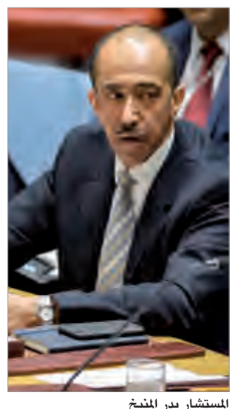
المستشار بدر المنيع

المعيشية للسكان متمنيا ان يكون توقيع إتفاق السلام فرصة لنهضة مناطق اللاجئين والنازحين في جنوب السودان لاستقبالهم كجزء لا يتجزأ من المجتمع. وأعرب المنيع عن تقديره لدور مفضية الأمم المتحدة لشؤون اللاجئين في ضمان سلامة اللاجئين قبل عودتهم مؤكدا على ضرورة تجنب استهداف العاملين في المجال الإنساني وإدانة أي عرقلة لعملهم النبيل. وبين أن عمل بعثة الأمم المتحدة يجب أن يسير دون معوقات أو عراقيل واحترام القوانين والمواثيق التي تحكم عمل البعثة مرحباً بحكم المحكمة العسكرية بشأن الجناة في حادثة "تيرين" مطالعاً ان تكون المحاسبة منهاجاً اتجاه كل من يرتكب الأعمال الإجرامية. وأعرب عن شكره للبعثة مقدراً لها عملها سواء عبر تنفيذ أو كان الولاية عملاً بالقرار 2406 (2018) أو حتى عبر أبسط الأمور وأكبرها في المعنى كهداياها لنزلاء مستشفى الصباح ومستشفى جوبا التعليمي. كما أعرب عن القلق من استمرار انتهاكات إتفاق وقف إطلاق النار وتبادل الأطراف للاتهامات بشأن هوية من يقف خلف تلك الانتهاكات خاصة في ولاية (وسط) الاستوائية رغم التقدم المحرز في العملية السلمية.