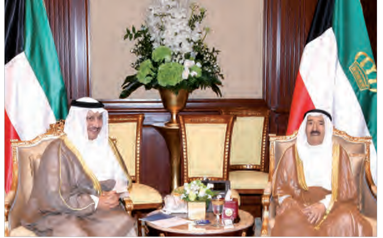
أمير البلاد يستقبل سمو الشيخ جابر المبارك

استقبل صاحب السمو أمير البلاد الشيخ صباح الأحمد بقصر بيان صباح أمس سمو ولي العهد الشيخ نواف الأحمد، كما استقبل سموه سمو الشيخ جابر المبارك رئيس مجلس الوزراء، من جهة أخرى بعث صاحب السمو أمير البلاد الشيخ صباح الأحمد ببرقية تهنئة إلى