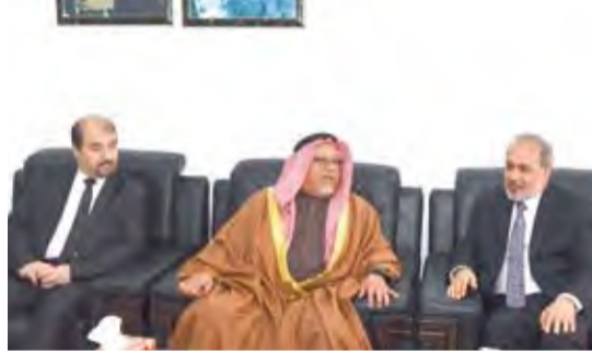
الشيخ علي الجراح يقدم واجب العزاء

قام وزير شؤون الديوان الأميري الشيخ علي الجراح صباح أمس بزيارة إلى سفارة جمهورية أفغانستان الإسلامية لدى دولة الكويت حيث نقل تعازي صاحب السمو أمير البلاد الشيخ صباح الأحمد وسمو ولي العهد الشيخ نواف الأحمد وسمو الشيخ جابر المبارك رئيس مجلس الوزراء وحكومة وشعب دولة الكويت وذلك بوفاته الرئيس الأسبق لجمهورية أفغانستان الإسلامية حضرت صبغة الله المحجدي.