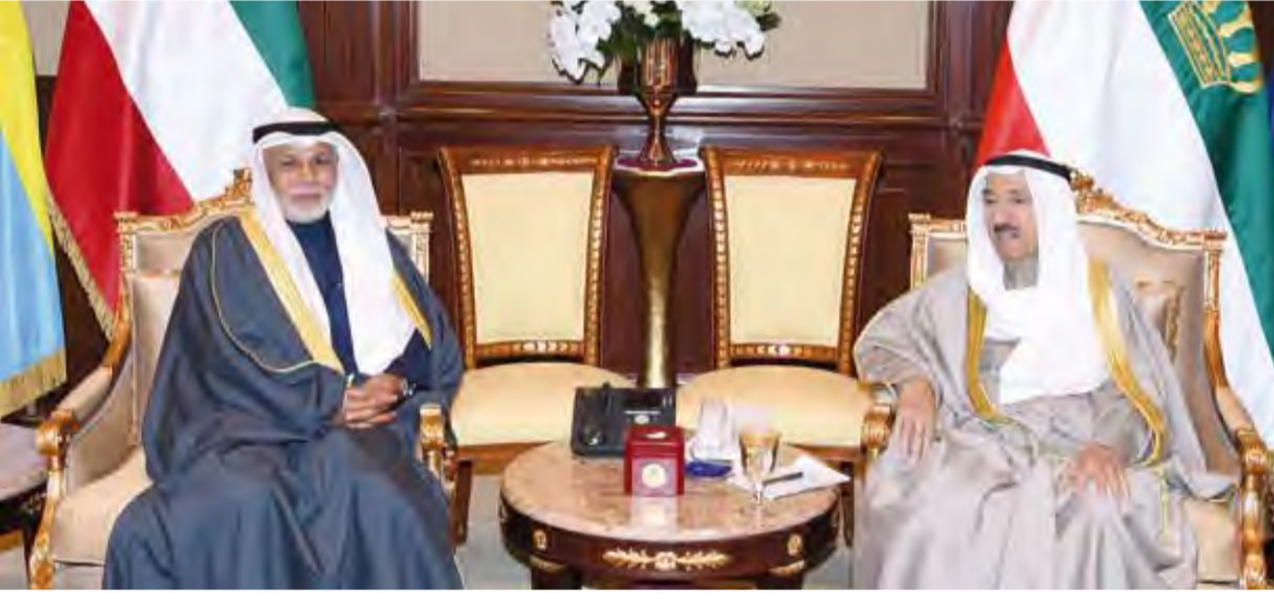
.. وسموه يستقبل المستشار يوسف المطاوعة

استقبل صاحب السمو أمير البلاد الشيخ صباح الأحمد بقصر بيان صباح أمس سمو ولي العهد الشيخ نواف الأحمد كما استقبل سموه رئيس مجلس الأمة مرزوق الغانم. واستقبل سموه سمو الشيخ جابر المبارك رئيس مجلس الوزراء. كما استقبل سموه رئيس المجلس الأعلى للقضاء ورئيس محكمة التمييز ورئيس المحكمة الدستورية المستشار يوسف المطاوعة. واستقبل سموه النائب الأول لرئيس مجلس الوزراء وزير الدفاع الشيخ ناصر صباح الأحمد ونائب رئيس مجلس الإصلاح والتنمية التابع للرئاسة بجمهورية الصين الشعبية تينغ جي جه والوفد المرافق وذلك بمناسبة زيارته للبلاد حيث نقل تحيات وتقدير الرئيس شي جين بينغ رئيس جمهورية الصين الشعبية الصديقة وتمنياته لبلاده لصاحب السمو أمير البلاد الشيخ صباح الأحمد بموقور الصحة والعافية ولشعب دولة الكويت دوام التقدم والنطور. وحمله سموه تحياته وتقديره للرئيس شي جين بينغ رئيس جمهورية الصين الشعبية