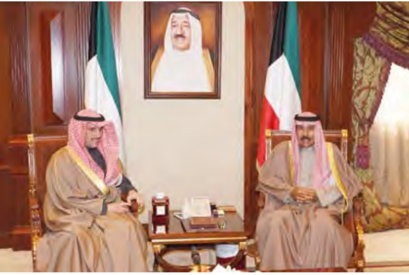
سمو ولي العهد يستقبل مرزوق الغانم