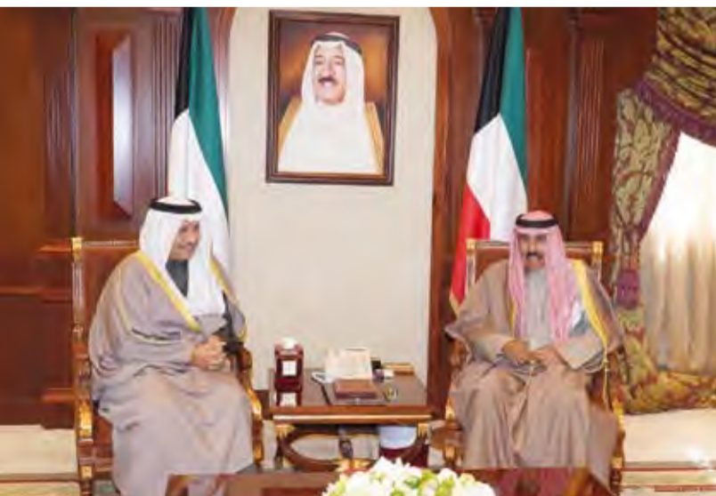
.. وسموه يستقبل سمو الشيخ جابر المبارك

كما استقبل سمو ولي العهد نائب رئيس مجلس الوزراء وزير الخارجية الشيخ صباح الخالد. واستقبل سمو ولي العهد نائب رئيس مجلس الوزراء وزير الداخلية الشيخ خالد الجراح. واستقبل سمو ولي العهد نائب رئيس مجلس الوزراء وزير الدولة لشؤون مجلس الوزراء أنس الصالح.