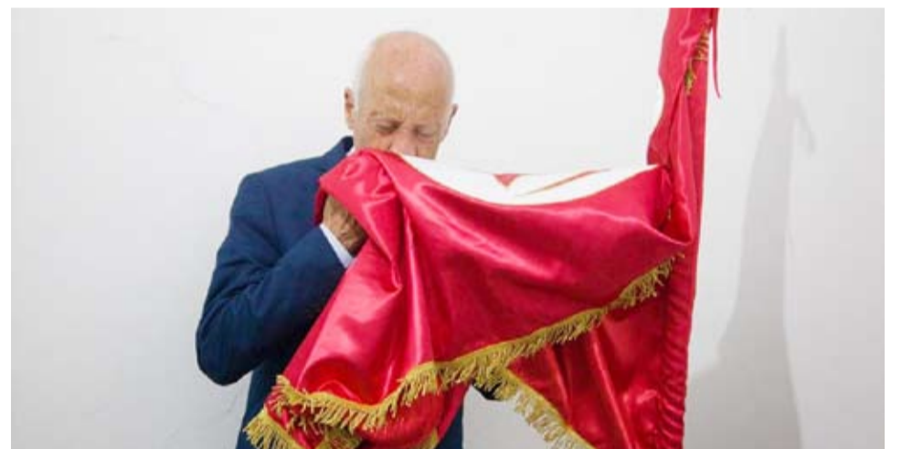
المرشح المستقل قيس سعيد... حظوظه قوية للفوز في الجولة الثانية

أظهرت نتائج رسمية أولية جديدة للانتخابات الرئاسية في تونس، تصدر المرشح المستقل قيس سعيد لقائمة الفائزين يليه بين أول اثنين من الفائزين في الجولة الأولى، سيتم تنظيمها في 29 سبتمبر الجاري، ومن المتوقع أن يتنافس فيها سعيد والقروي. إلى ذلك قالت حملة المرشح الرئاسي نبيل القروي، إنها أودعت طلباً لدى المحكمة لاستصدار قرار بإطلاق سراحه، لمواصلة حملته الرئاسية، لا سيما بعدما أظهرت النتائج الأولية صعوده إلى الجولة الثانية من الانتخابات الرئاسية التونسية.