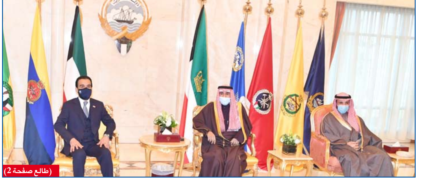
(تطلع صفحة 2)