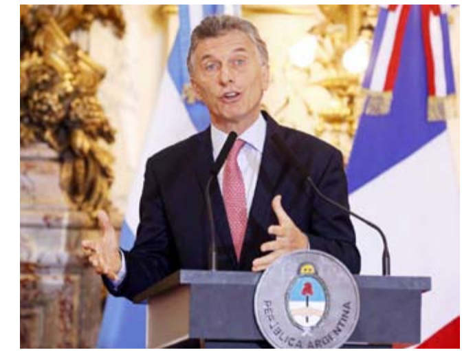
الرئيس الأرجنتيني ماوريسيو ماركري

أمرت السلطات في الأرجنتين بتجميد أصول جماعة حزب الله في البلاد أمس الخميس وصنفت الجماعة اللبنانية، التي تلقي عليها باللوم في هجومي على أراضيها، فعليا منظمة إرهابية. وجاء الإعلان في الذكرى الخامسة والعشرين لتفجير بمرکز للجالية اليهودية في بوينس آيرس أدى إلى مقتل 85 شخصا. وتلقي الأرجنتين باللوم في الهجوم على إيران وحزب الله، وكلاهما ينفي المسؤولية عنه. وكانت وسائل إعلام أرجنتينية، كشفت الجمعة الماضي، أن الرئيس ماوريسيو ماركري يستعد لتوقيع مرسوم رئاسي، يصنف حزب الله في خاتمة التنظيمات الإرهابية. وتزامنت الخطوة مع إحياء الأرجنتين لذكرى مرور 25 عاما على تفجير مبنى الجمعية التعااضدية اليهودية الأرجنتينية (أما) الذي وقع في 18 يوليو 1994، وأسفر عن مقتل 85 شخصا وإصابة المئات بجروح، في أعنف تفجير حدث بهذا البلد.