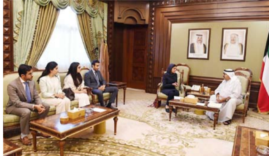
الشيخ ناصر صباح الأحمد يستقبل عدداً من الأكاديميين

تقدم النائب ناصر السويط باقتراح بقانون بإضافة فقرة جديدة إلى المادة (10) من المرسوم بالقانون رقم (70) لسنة 1980، بشأن العسكريين الذين استفادوا من أحكام القانون رقم (31) لسنة 1967 في شأن سريان أحكام قانون معاشات ومكافآت التقاعد للعسكريين على غيرهم من العاملين بتكليف من الحكومة في مناطق العمليات الحربية لتسري على العسكريين غير محددى الجنسية الذين شاركوا في حرب تحرير الكويت.