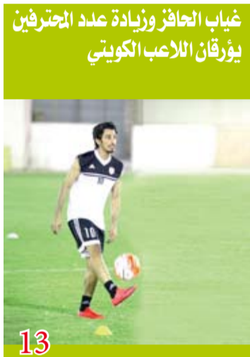
غياب الحافز وزيادة عدد المحترفين يورقان اللاعبين الكويتي