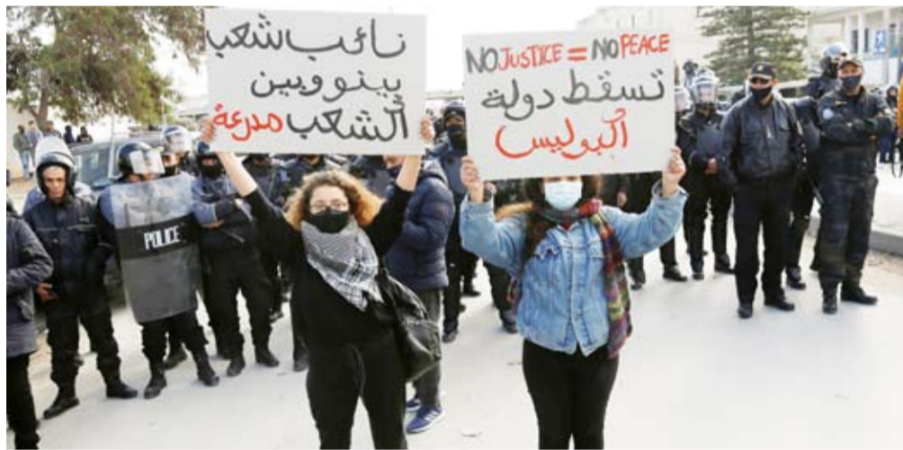
احتجاجات واسعة ضد السياسة البوليسية في تونس

وتأتي هذه الجلسة البرلمانية عقب اضطرابات بين محتجين وشرطة في سببلة في منطقة مهبشة وسط البلاد، بعد وفاة شاب متأثراً بإصابته بقليلة مسجلة للدموع.