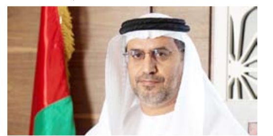
د. مطر النيادي

عينت دولة الإمارات العربية المتحدة د. مطر حامد النيادي سفيراً لها لدى الكويت، حيث أدى النيادي اليمين الدستورية أمام نائب رئيس الدولة ورئيس الوزراء حاكم دبي سمو الشيخ محمد بن راشد آل مكتوم سفيراً لبلاده لدى الكويت، والذي تمنى له النجاح والتوفيق في مهنته لما فيه خدمة قضايا وطنه. وقال السفير النيادي في تغريدات على حسابه عبر «تويتر»: انتهيت قبل قليل من مراسم أداء القسم أمام سيدي صاحب السمو نائب رئيس الدولة حفظه الله لتعييني سفيراً لدولة الإمارات العربية المتحدة في دولة الكويت الشقيقة. نسال الله التوفيق والنجاح في أداء هذه الإمانة.