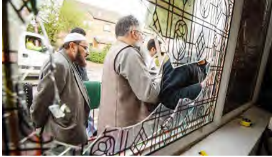
زجاج متحطم بأحد المساجد

أقل من ساعة بلاغا آخر حول أعمال مشابيه، واكتشفت أن مسجدين آخرين تعرضا للتخريب. وفي وقت لاحق في الصباح، جرى استهداف مسجد خامس، وقالت الشرطة إن عناصرها يعملون على جمع الأدلة، فيما يجري تحليل تسجيلات كاميرات المراقبة. وكثرت الشبهة البريطانية أعلنت تسيير دوريات حول المساجد في كل البلاد عقب اعتداءات مدينة كرايست تشيرش في نيوزيلندا، بهدف «طمأنة» مرادياها. وينظر أكثر من ثلث البريطانيين إلى الإسلام على أنه يمثل «تهديدا» لنمط حياتهم، بحسب إحصاء عرضت نتائجها في فبراير جمعية الأمل وليس الكراهية.