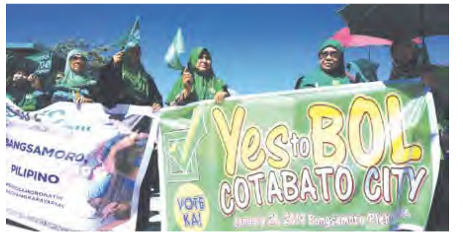
فلبينيات يدعون إلى التصويت بنعم على الانفصال

دعى حوالي ثلاثة ملايين فلبيني إلى التصويت في استفتاء حول إقامة منطقة للحكم الذاتي في جنوب البلاد بموجب اتفاق السلام الذي تم التوصل إليه في 2014. ووقعت أكبر حركة تمرد جبهة مورو للتحريير في 2014 اتفاق سلام مع الحكومة بنص على منح الأقلية المسلمة حكماً ذاتياً في بعض مناطق جزيرة مينانداناو لكبرى جزر في أقصى جنوب غرب البلاد. ويفترض أن يقرر 2.8 مليون ناخب في المنطقة على إنشاء أو عدم إنشاء منطقة بانغسامورو التي تتمتع بحكم ذاتي، بدلاً من منطقة الحكم الذاتي الحالية التي أقيمت بموجب اتفاق وقع بين مانيل مع حركة تمرد أخرى منافسة لجبهة مورو للتحريير. والوطنية للتحريير. ويفترض أن تكون المنطقة الجديدة للحكم الذاتي أكبر وتتمتع بصلاحيات أوسع. (طالع صفحة 9)