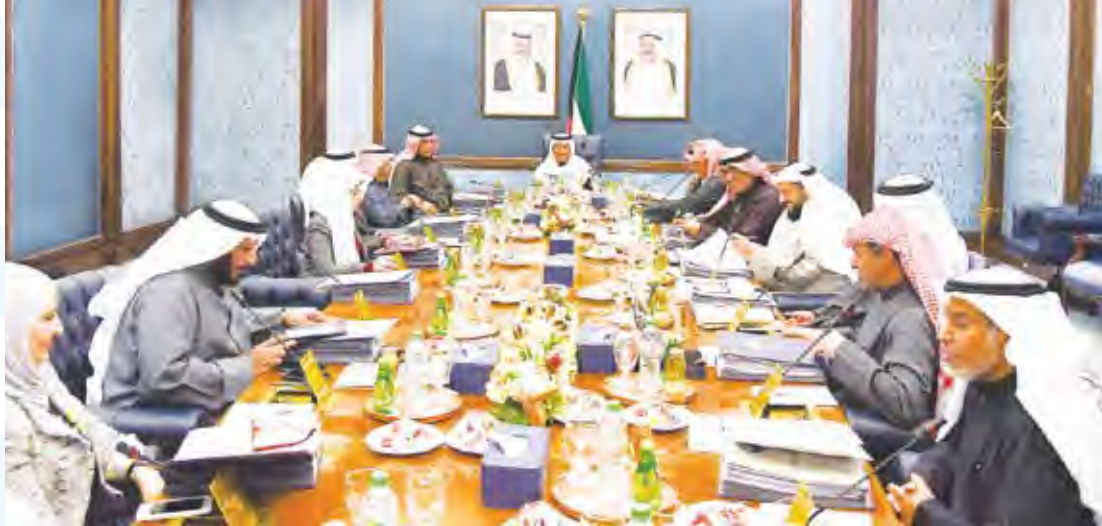
المبارك يتراس اجتماع مجلس الوزراء أمس

سمير خضر استعرض مجلس الوزراء خلال اجتماعه الأسبوعي أمس، مشروع قانون ميزانية الوزارات والإدارات الحكومية للسنة المالية 2020/2019، حيث بلغ إجمالي المصروفات 22.5 مليار دينار وإجمالي الإيرادات 16.4 مليار دينار، و 7.7 مليار دينار عجزاً متوقفاً، وقرر المجلس الموافقة على مشروع القانون ورفعته إلى صاحب السمو الأمير تهيئاً لاحالته إلى مجلس الأمة. من جانبه قال نائب رئيس مجلس الوزراء وزير المالية نايف الحجرف خلال المؤتمر السنوي للإعلان عن الموازنة إن الميزانية أعدت على أسس التتمة 6