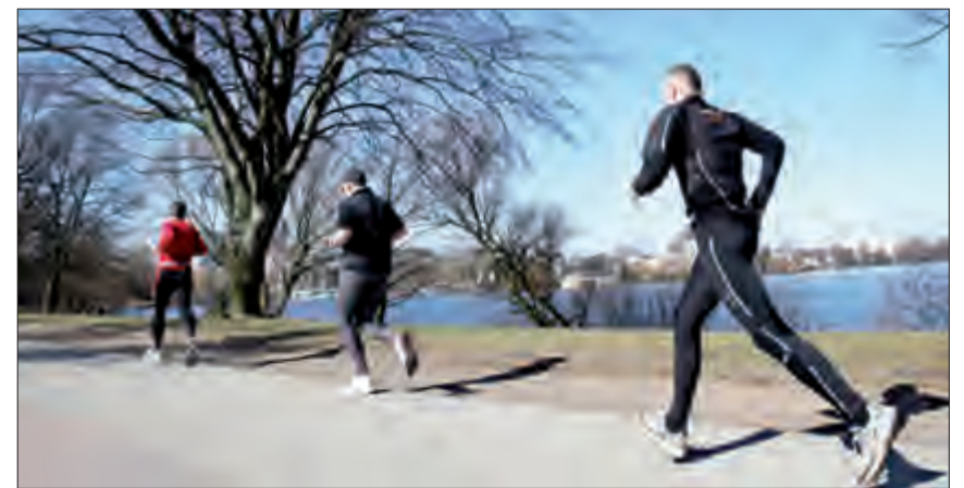
الجري مفيد للدماغ

أريزوناً «لقد وسعنا دراستنا على مجموعة كبيرة من الأشخاص وأثبتت النتائج أن الدماغ يستفيد بشكل كبير من كل ممارسة رياضية». من جهة أخرى بينت الدراسة أن أجزاء الدماغ لدى العدائين كانت متشابكة مع بعضها بشكل أفضل مقارنة بمن لا يمارسون رياضة الجري. في المقابل، أوضحت أن هذه الأجزاء المرتبطة ببعضها، تتغير عند الكبر وخاصة لدى مرضى الزهايمر، حتى وإن كانت هذه الأجزاء مرتبطة ببعضها بشكل جيد، وبذلك يمكن عبر ممارسة الرياضة في الشباب حماية المخ في الكبر وبالتالي تفادي مرض الخرف.