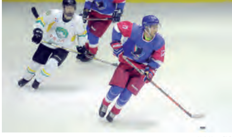
لقطة من المباراة

استغل على دعم جهود نادي الألعاب الشتوية الكويتي لما يقوم به من عمل مميز لدعم اللعبة في الكويت من خلال تخصيص أرض وصالة تزلج خاصة بهم وفق الشروط الدولية لتكون حاضنة لمجى ممارسة الألعاب الشتوية من الشباب الكويتي.