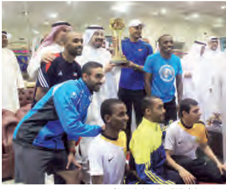
صورة جماعية لفريق القادسية مع الشيخ طلال الفهد

توج نادي القادسية بدرع الفوق العام لألعاب القوى بعد أن حصد 40 نقطة محتلاً بها صدارة ترتيب فيما حل الكويت وكازمة في المركزين الثاني والثالث على التوالي. على ذات الصعيد فقد حقق نادي القادسية المركز الأول في آخر بطولات موسم ألعاب القوى وهي بطولة الكويت العامة التي أقيمت على مدار 4 أيام على مضمار المرحوم أحمد الشرفان في كيان لفئة العمومي بعدما أحرز 167 نقطة وجاء الساحل ثانياً برصيد 150.5 نقطة وكازمة ثالثاً برصيد 125 نقطة. وفي ذات البطولة وعلى صعيد فئة الناشئين فقد حقق الأصفر وصافة الترتيب خلف الكويت المتصدر. وشهدت البطولة مهرجاناً اعتزال لاعب المنتخب الوطني ونادي القادسية محمد مطلق العازمي والذي أقيم برعاية وحضور الشيخ د طلال الفهد الذي بدوره أثنى على مسيرة اللاعب وما حققته من إنجازات وأوسمة أسهمت في رفع علم الكويت عبر مختلف المحافل الإقليمية منها والقارية والعالمية.