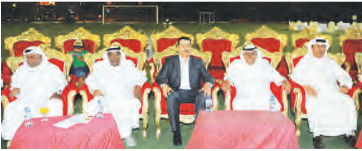
الدكتور جمال الحربي خلال حضوره ختام نهائي دورة الطوارئ الطبية لكرة القدم

أعلن وزير الصحة الكويتي الدكتور جمال الحربي جاهزية الوزارة لإدخال 79 سيارة إسعاف جديدة إلى خدمة الطوارئ الطبية قريبا تسعة منها مجهزة للعناية المركزة والمصابين من اصحاب الوزن الثقيل ليرتفع عدد سيارات الإسعاف الى 298 سيارة. جاء ذلك في تصريح للحربي على هامش حضوره ختام نهائي دورة الطوارئ الطبية لكرة القدم التي اقيمت أمس الأول السبت على ملعب الهيئة العامة للشباب والرياضة بمنطقة مشرف. واكد ان السيارات الجديدة ستكون مصممة وفق أحدث المواصفات الطبية العالمية مبيناً ان هذه الخطوة تندرج ضمن خطة الوزارة نحو تطوير منظومة الطوارئ الطبية من حيث توفير وتدريب العنصر البشري المؤهل وتحديث سيارات الإسعاف واستخدام الاسعاف الجوي.