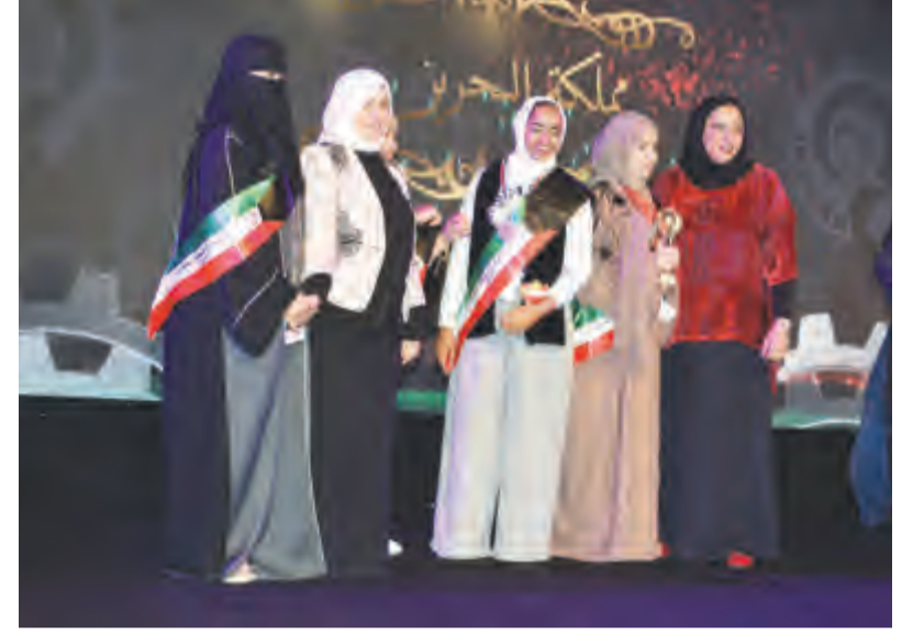
الوزيرة هند الصبيح والشيخة فادية السعد تكريم بعض المشاركات

العالم العربي». وأضافت ان المسابقة امتدت لتشمل المرحلة المتوسطة عبر مسابقة التدوير الالكتروني وخلصت الى منهجية (ستيم) في المرحلة الثانوية لتقديم المبادرة بذلك دعماً متكاملاً للعملية التربوية بشكل يحمل فيه طياته الإبداع والابتكار.