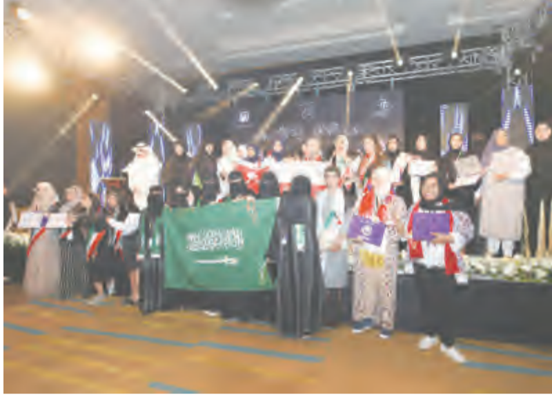
لقطة جماعية للفائزات