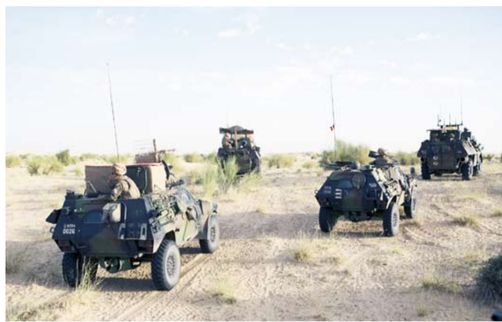
عناصر من جيش بوركينا فاسو

هجوماً، وإنما انفجار لغم منزلي الصنع لدى مرور عربة عسكرية أثناء قيامها بعملية، حتى الآن، لم تصدر الحكومة أو الجيش بياناً رسمياً. ويأتي هذا الانفجار بعد ثمانية أيام من إعلان الرئيس تالون أمام البرلمان أن لوضع «ستعزز» إجراءاتها العسكرية لوضع حد لتوغلات الجهاديين من النيجر وبوركينا فاسو المجاورتين. وقال الرئيس يومها إنه «منذ عامين على الأقل، نشرنا تعزيزات عسكرية وقائية في مدننا الحدودية حيث التهديد الإرهابي مرتفع»، مؤكداً أن «الوضع مقلق». وفي الثاني من ديسمبر قتل جنديان بايدي جهاديين بالقرب من بورغا في مقاطعة اتاكورا على الحدود مع بوركينا فاسو.. وقبلها بيوم واحد، هاجم جهاديون جنوباً في مقاطعة البيوري المجاورة».