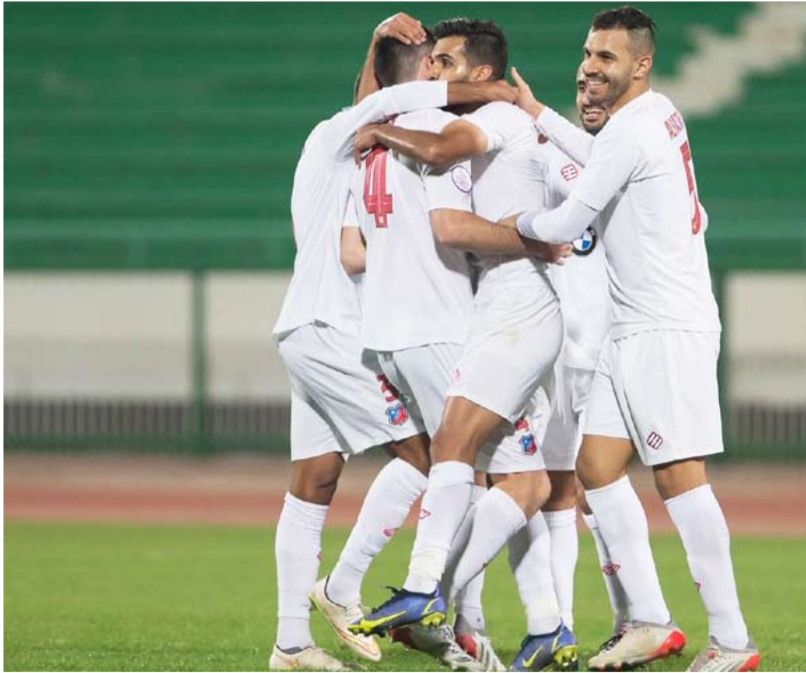
الكويت يتصدر الدوري بفثائية في مرمى الشباب

أسدل الستار على الجولة الثامنة من الدوري الكويتي الممتاز لكرة القدم، الخميس، بتصدر الكويت لجدول الترتيب، بعد فوزه على الشباب بهدفين دون رد. واشتعلت المنافسة على الصدارة، حيث يملك الكويت 19 نقطة في المركز الأول، بينما يحظى كل من كاظمة والسالمية بـ17 نقطة، ويتبعه القادسية بفارق 3 نقاط عن المتصدر، محتلا المركز الرابع. وحقق الكويت المطلوب أمام الشباب، رغم الغيابات التي ضربت صفوفه، ليلتخط أنه ما زال المرشح الأبرز للفوز باللقب. وكانت مباراة القادسية وكاظمة الأهم خلال هذه الجولة، حيث حقق الأصفر فوزاً كبيراً على البرتقالي (3-0)، واقترب من المنافسة على الصدارة. كما أعاد الثقة مرة أخرى لجمهيره، التي هفتت ضد مجلس الإدارة في الفترة الماضية، بسبب خسارة كأس الأمير والتعثر في مباريات الدوري. في المقابل، قدم كاظمة أداءً باهتاً، ولم يكن نداً للقادسية خلال المباراة، وهو ما جعل الكثيرين يشككون في قدرته على المنافسة حتى النهاية. من جانبه، دخل العربي في أجواء المنافسة، بعدما حقق فوزاً