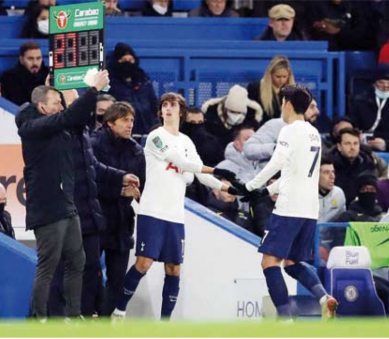
الكوري الجنوبي هيوغ مين سون

مؤخراً، وقال المدرب الإيطالي الذي ضمّ إريكسن إلى صفوف إنتر ميلان عام 2020 عندما كان مدرباً له: «رؤيته قادراً على لعب كرة القدم مرة أخرى هي أخبار رائعة. اعتقد أنه بالنسبة لكريستيان، فإن الباب سيكون مفتوحاً دائماً». كونتي: الحقيقة مفتاح التقدم وأكد مدرب توتنهايم أنطونيو كونتي، على أهمية المصارحة والصدق في التعامل مع اللاعبين عقب هزيمة فريقه اللندني 0-2 أمام جاره تشيلسي في ذهاب الدور قبل النهائي لكأس رابطة المحترفين الإنجليزية للعبة الشعبية الأسبوع الماضي. واعترف كونتي أن مستوى فريقه أقل فعلياً من تشيلسي وأكد على أهمية الصراحة والصدق في التعامل مع لاعبيه قائلاً: «علاقتي مع اللاعبين أساسها الحقيقة. ليس هنا فقط بل في الماضي أيضاً».