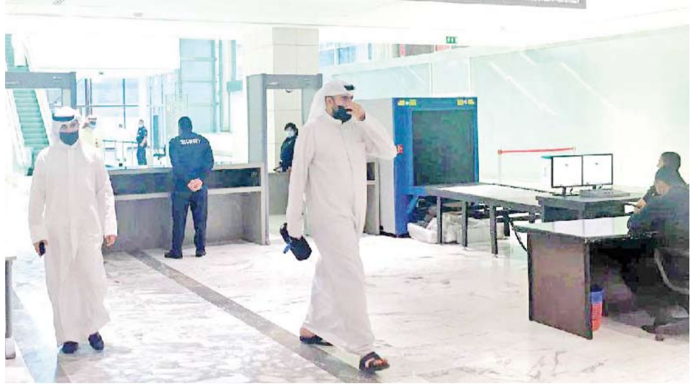
تطبيق إجراءات التباعد والتعقيم وعدم الدخول أو التثقل دون ارتداء الكمام

فوز أحد المواطنين الكويتيين ببطولة الملك عبدالعزيز لمزايين الإبل آثار لغرات ويغض بين المتنافسين، ما يدل على انحدر الثقافة بين عشاق هذه المسابقات، أشعار وتنايز بالأصول والانتماء وتعميق الخلاف بين البدو والحضر وإحياء ضغائن ماتت منذ زمن، الأمير مشعل بن عبدالعزيز رحمة الله أوقف هذه المسابقات التي أساء لها المشاركون والمشجعون وحولوها إلى موطن للمشاحنات والخلافات وصدامات في بعض الأحيان، جميع المسابقات العالمية فيها تنافس وحماس منضبط والخروج عن هذه الأحاسيس يعتبر خروج على القانون، في الجاهلية حروب دامت لأعوام بسبب مسابقة خيول وسميت بحرب «داحس والغبراء»، تاريخ يدل على جهل وتغصب أزله الإسلام . النبي إن زاد عن حده انقلب إلى ضده، «الزود نقص» مش هيك والا لا ينصر شو المكم .