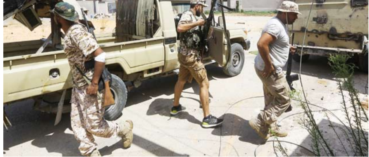
قوات قتالية في طرابلس

وأوضح جبجيج أن «الانتصار في بيجان سيحصد طرق الإمداد الحوثية القادمة من البيضاء وسيبقى لدى الميليشيات طريق إمداد رئيسي وهو خط المناقل - البيضاء، وأيضا خط فرعي وليس أساسيا وهو خط العبدية حريب».