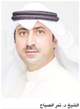
الشيخ .نمر الصباح

هذا وتتألف لجنة متابعة ومراقبة تنفيذ الإجراءات والاشتراطات الصحية الصادرة عن السلطات الصحية المختصة والمتعلقة بمكافحة فيروس