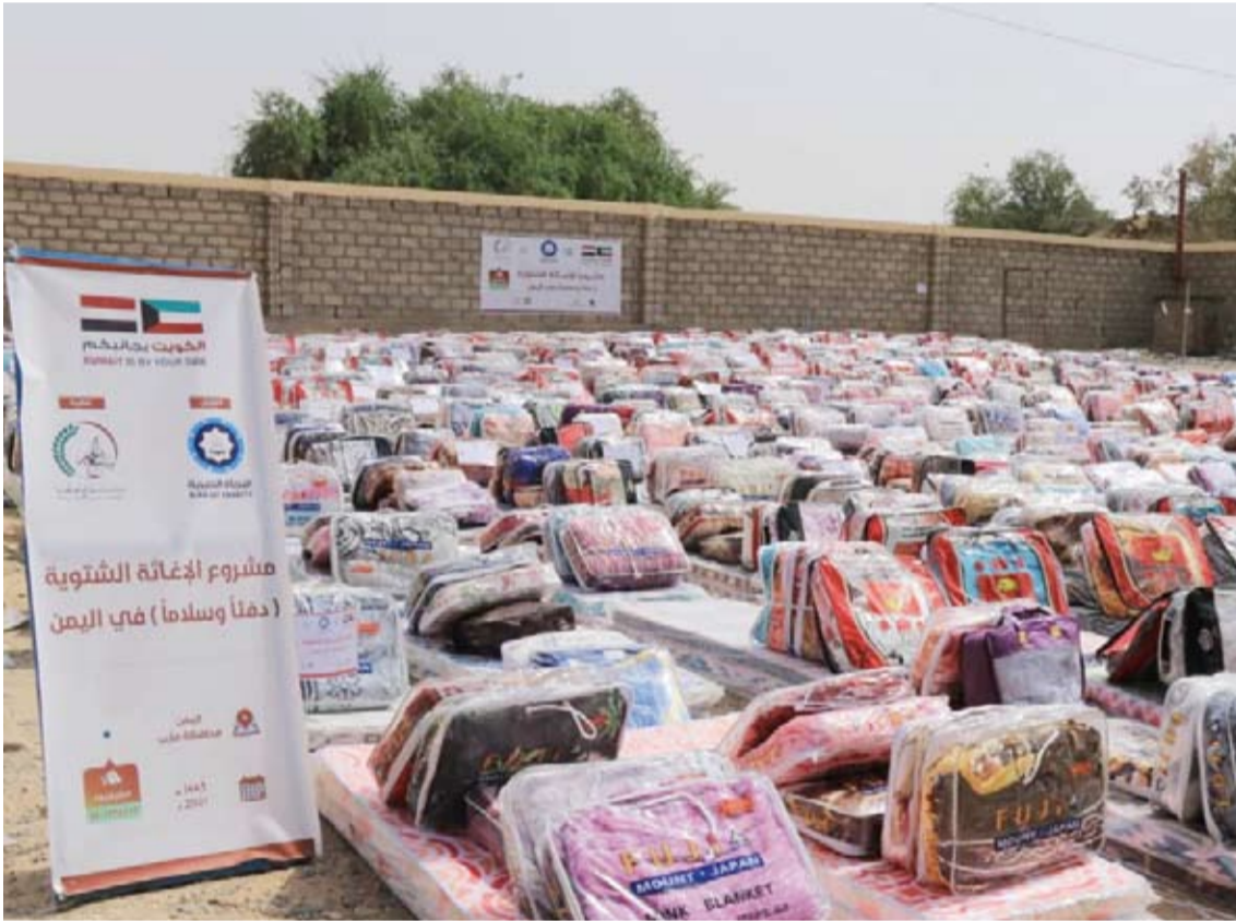
مشروع الإغاثة الشتوية