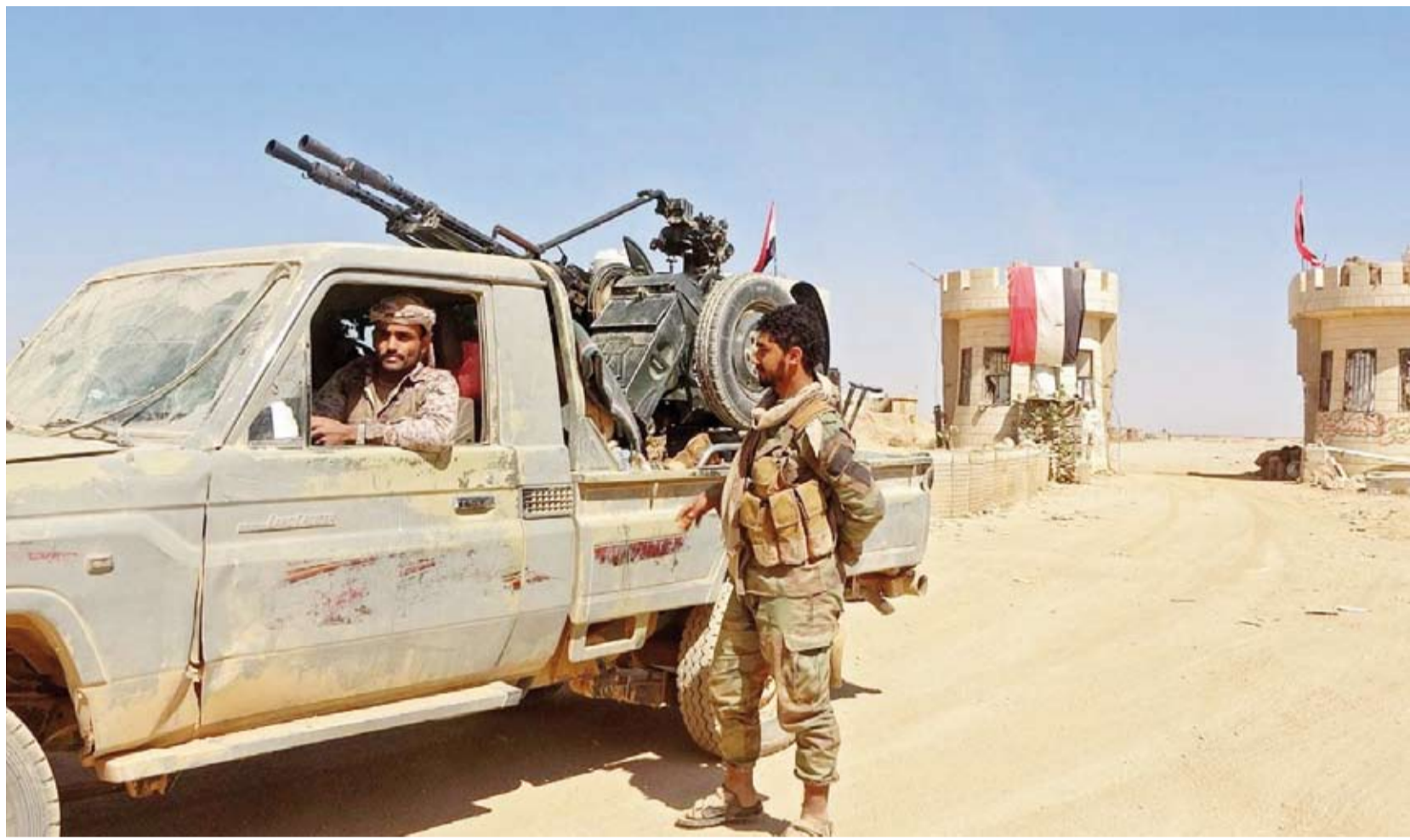
استمرار تقدم القوات اليمنية

بعد أسبوع واحد من إطلاق الولاية العمالية عملياتها العسكرية في الشمال الغربي من محافظة شبوة، تمكنت القوات من تحرير مركز مديرية بيجان بإسناد من تحالف دعم الشرعية في اليمن، لتمهد الطريق باتجاه محافظتي البيضاء ومارب، وسط ترقب لتحرير مديرية عين وهي آخر مديريات شبوة من قبضة الميليشيات الحوثية.