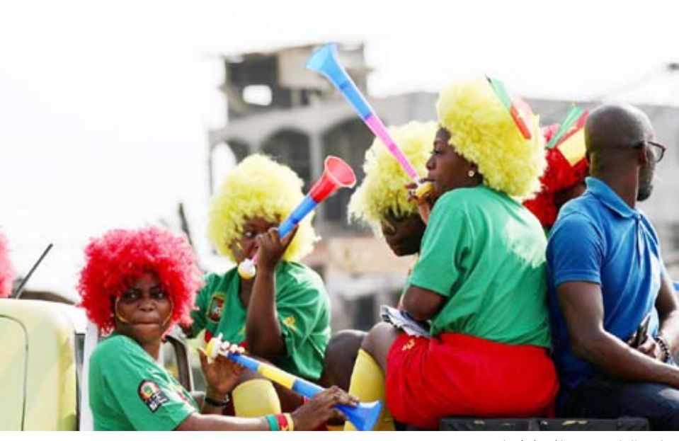
جماهير الكامبيرون تساند منتخبا

الذي تعافى من إصابة في الفخذ تعرض لها في أكتوبر الماضي، غير أن الفريق يعاني من غياب لاسينا فرانك تراوري، الذي تعرض لإصابة ستبعده لبقية الموسم الحالي، وبريان دابو، لاعب ريزا سبور التركي المصاب، الذي لعب دوراً رئيسياً مع الفريق خلال تصفيات كأس العالم في 2022. وكان منتخب بوركينافاسو قريبا من تحقيق المفاجأة والتأهل للمرحلة النهائية للتصفيات الأفريقية المؤهلة للمونديال على حساب المنتخب الجزائري، لكن تعادله المثير 2-2 مع «محابو الصحراء» في الجولة الأخيرة من دور المجموعات في نوفمبر الماضي، حال دون ذلك، وهو ما يعكس صعوبة مهمة المنتخب الكامبيروني في لقاء الغد، الذي يجري بملعب «أوليمبيه»، ويديره الحكم الجزائري مصطفى غربال. وفي المقابل، تبدو حظوظ منتخبا إثيوبيا والرأس الأخضر متكافئة إلى حد كبير في لقائهما الأول بالجموعه حيث يبحث كل منهما عن حصد النقاط الثلاث لتعزيزين آماله في بلوغ الأدوار الإقصائية. ويعود المنتخب الإثيوبي بعد