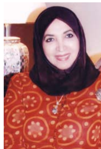
د. سعاد الصباح

تعود الدكتورة سعاد محمد الصباح في كتابها الجديد (تأسيس الكويت في عهدي صباح الأول الحاكم الأول 1718 - 1776 وعبد الله الأول الحاكم الثاني 1776 - 1814) إلى شغفها المتجذر في استجلاء الفترات القصية والغامضة في تاريخ الكويت، فتستقصي آثارها في المراجع العربية والأجنبية، وتجمع وتوازن مفاخرها المختلفة، لتقدم صورة متكاملة عنها للكويتيين والعرب وكل مهتم بتاريخ الكويت، وتستكمل بذلك النقص التي عانت منها المكتبة التاريخية الكويتية.