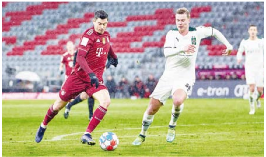
لقطة من مباراة بايرن ميونخ وبوروسيا مونشنغلاذباخ

وهي الخسارة الثالثة لبايرن ميونخ هذا الموسم فتجمد رصيده عند 43 نقطة في الصدارة، فيما خلف بوروسيا مونشنغلاذباخ النقاط الثلاث ورفع رصيده إلى 22 نقطة في المركز الحادي عشر.