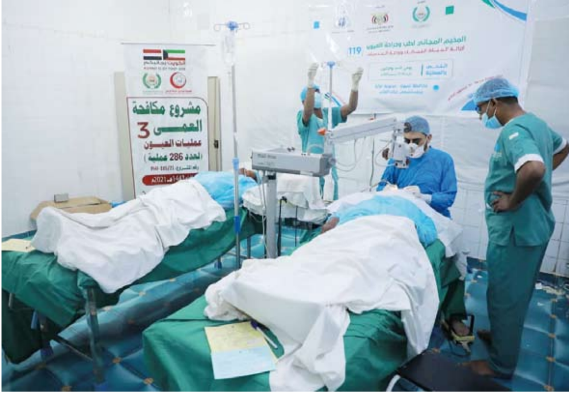
اختتام مخيم طبي مجاني لجراحة العيون في شبوة اليمنية