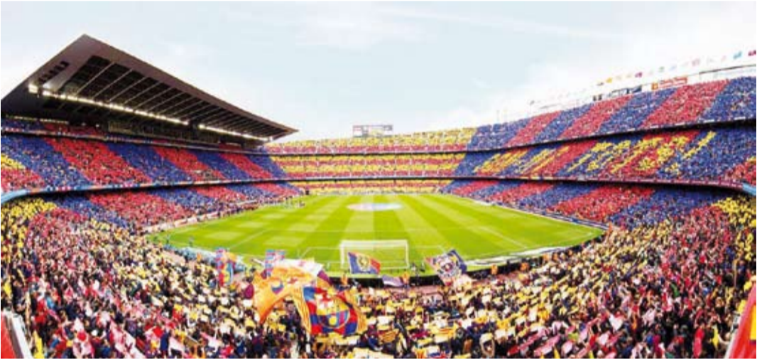
تفاوت كبير بين لاعبي برشلونة في سلم الرواتب

لاعب لم يشارك سوى في مباراة واحدة مع الفريق في هذا الموسم، وذلك يقصر إصرار إدارة النادي الكتالوني على دفعه إلى الرحيل رغم تبقي عام ونصف في عقده الحالي. وأظهرت التسريبات أن البرازيلي فيليب كوتينيوي يحصل على 16 مليون يورو سنوياً، وهو اللاعب الذي نجحت إدارة الرئيس جوان لابورتا في التخلص منه اليوم الجمعة بعد إعارته لنادي