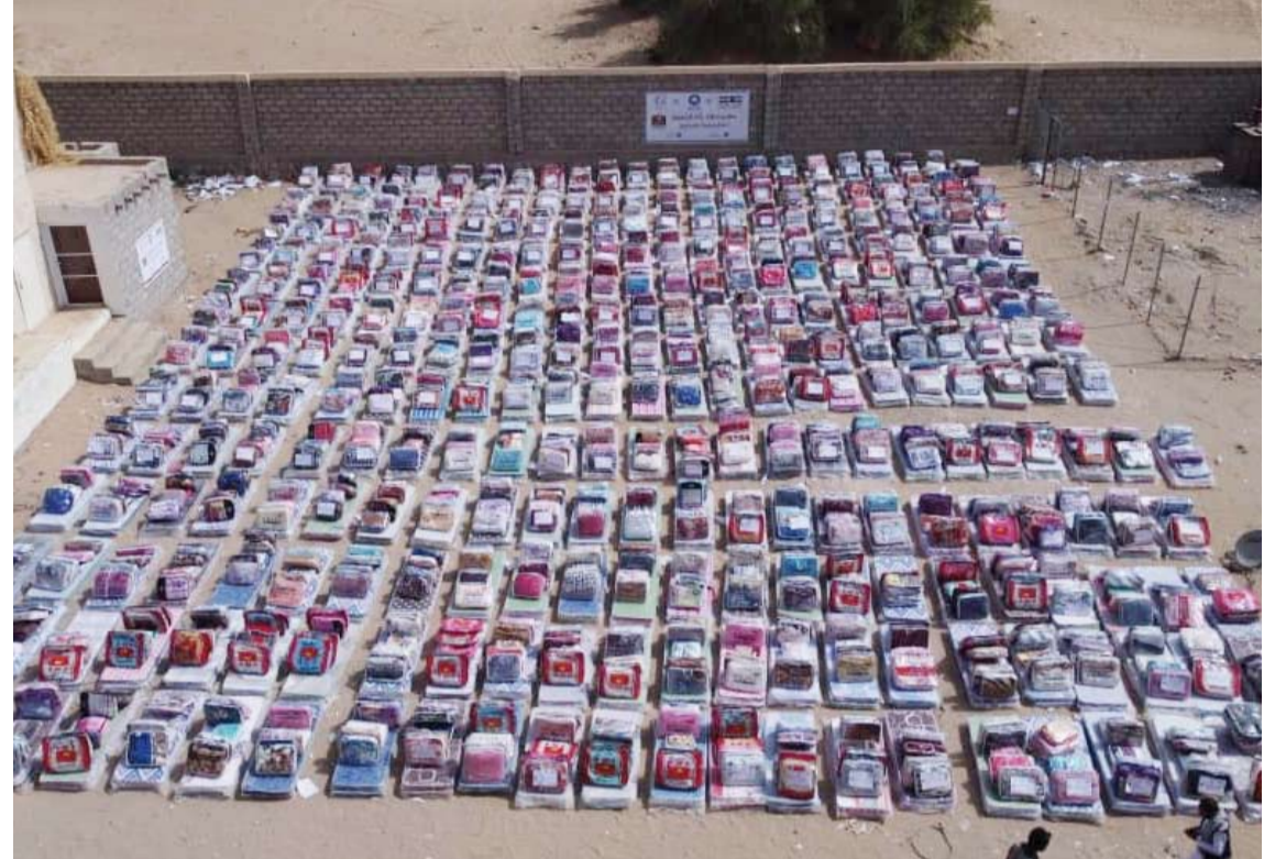
النجاة الخيرية الكويتية توزع مساعدات إيوائية لـ 400 أسرة نازحة في «مارب»