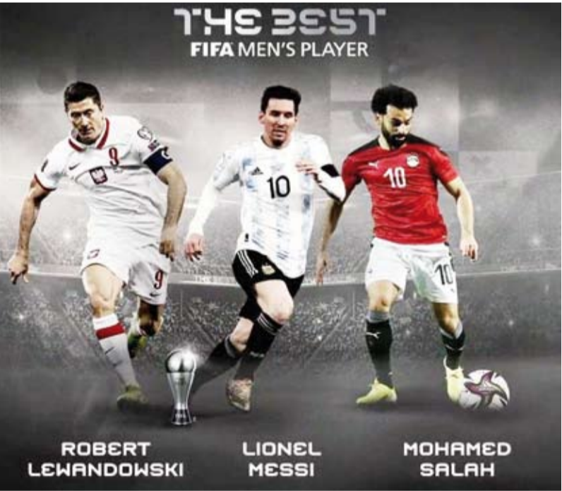
الإعلان عن الفائز بالجائزة في 17 يناير

العديد من الأرقام القياسية، وواصل تألقه مع نادي بايرن ميونخ. كما يوجد في القائمة النهائية النجم الأرجنتيني ليونيل ميسي المتوج أخيراً بجائزة الكرة الذهبية للمرة السابعة في تاريخه. وسيلتزم المتوج بجائزة أفضل لاعب في حفل سيقام في مقر الفيفا بزيورخ في 17 يناير الحالي.