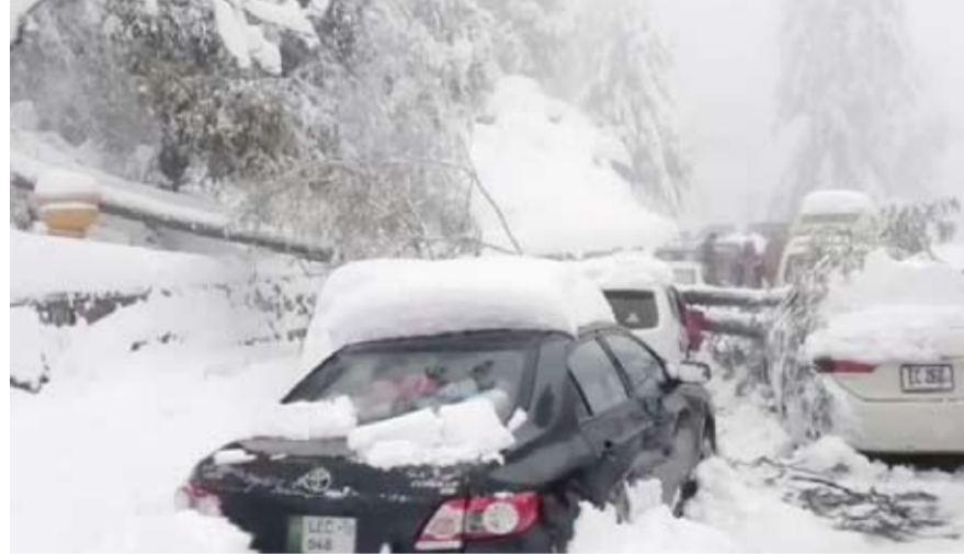
16 شخصاً لقوا حتفهم بعد تدني درجات الحرارة إلى ما دون الصفر

وأشار مسؤولون إلى أن الـ 16 جميعاً توفوا بسبب انخفاض حرارة الجسم. وقال وزير الداخلية الباكستاني شيخ رشيد أحمد إن آلاف المركبات انتشلت من الثلوج، لكن أكثر من 1000 مركبة لا تزال عالقة في المنطقة.