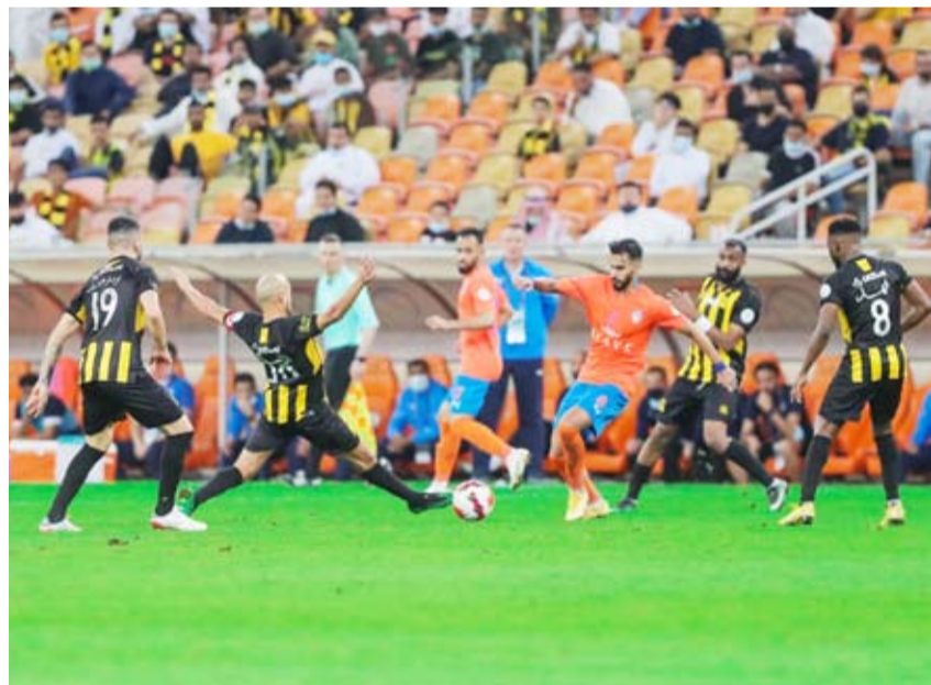
لقطة من مباراة الاتحاد والفيحاء