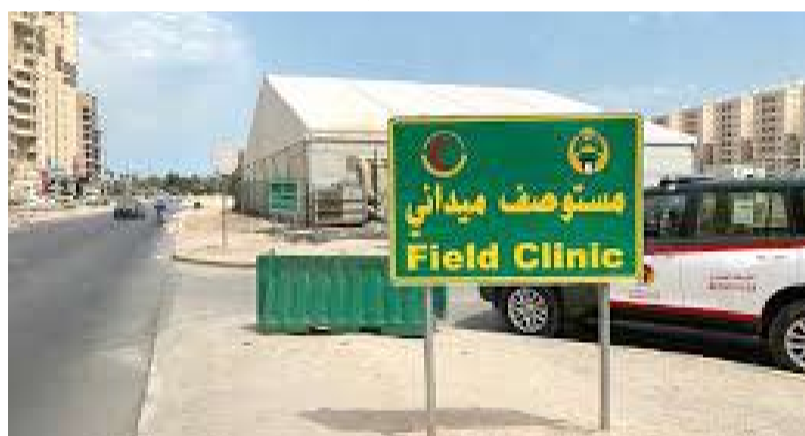
مستشفى الحرس الوطني في المهبولة