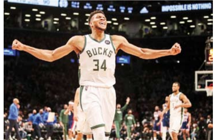
فرحة اليوناني يانيس أنتيتوكونمو

مرة. بمجرد أن يرى تمرکزنا، يعرف الأماكن التي يريد الوصول إليها». وسيق لميلووكي الذي يحتل المركز الثالث حالياً في ترتيب المنطقة الشرقية، أن أسقط بروكلين الموسم الماضي في الدور