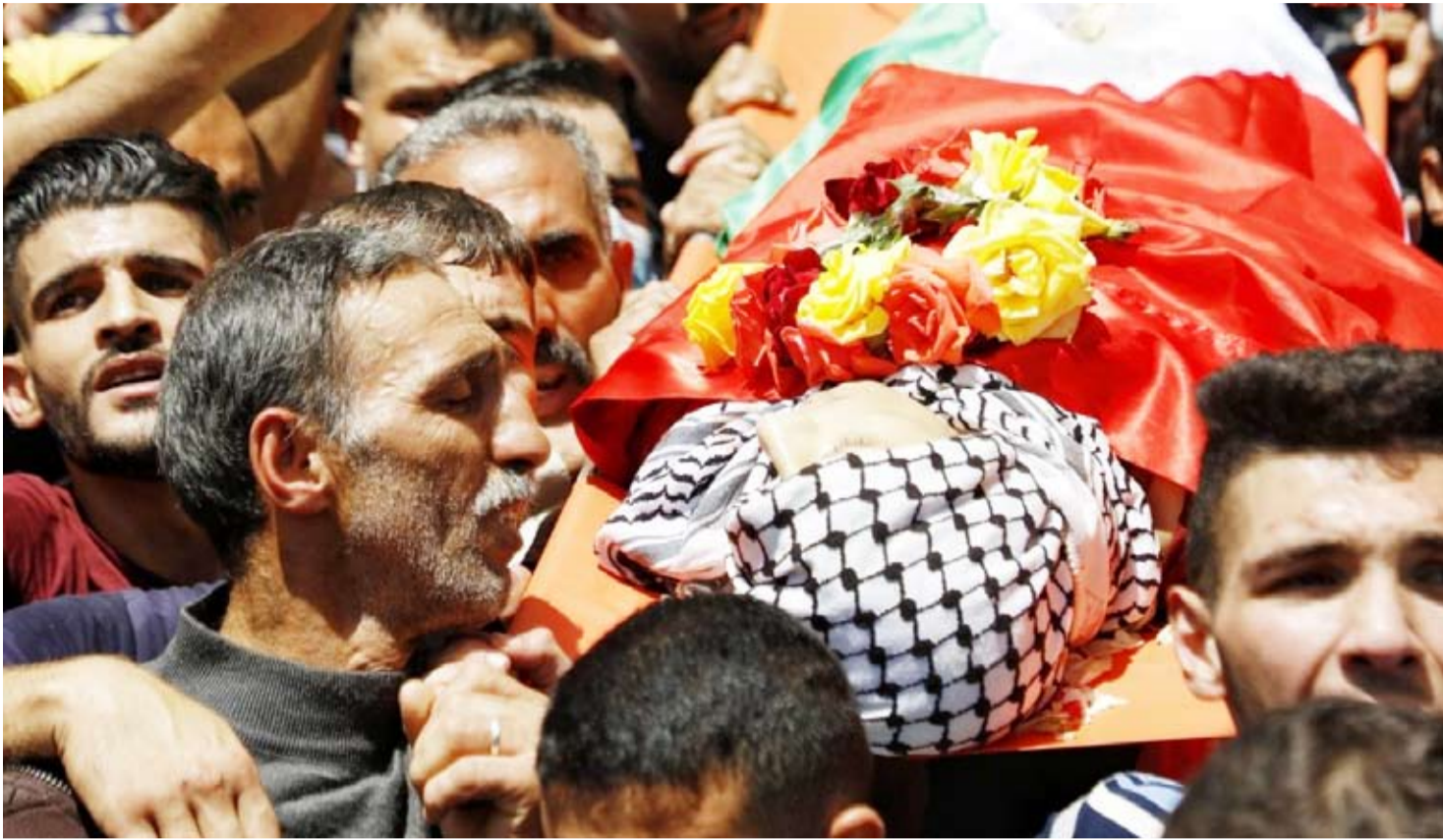
تشيع شهيد فلسطيني

في وقت واصلت ميليشيات المستوطنين المتطرفين وقوات الاحتلال التي تحميها وتتعاطف معها، ممارسات القمع والتكثير في الضفة الغربية والقدس، وشارك آلاف الفلسطينيين بتشييع جثمان الفتية الغمانية «شهداء لقمة العيش»، الذين قُضوا في حادث سير على طريق أريحا. وجرى التشييع في مسقط رأس «شهداء لقمة العيش» في بلدة عقربا جنوب نابلس، وأقيمت صلاة الجنازة على رأس الجثمان، في ملعب القرية بحضور آلاف المواطنين من كافة المحافظات الفلسطينية. وألقى الرئيس محمود عباس كلمة تعزية عبر الهاتف قال: «إن المصاب جيل وألم ذوي الشهداء هو ألمانا جميعاً، ولكن سنبقى صامدين أمام كافة التحديات التي تواجه الشعب الفلسطيني من الاحتلال والمستوطنين.. لكن مأساة حادث الطرق المروع، لم تغير شيئاً في النهج التقليدي للاحتلال في قمع المسيرات السلمية للفلسطينيين في كل يوم جمعة، فقد أصيب الصحافي معصم سقف الحيط بالرصاص المعدني المغلف بالمطاط، وتعرض عدد من المواطنين لحالات اختناق بالغاز المسيل للدموع الذي أطلقته قوات الاحتلال بكثافة خلال مواجهات عند المدخل الشمالي لمدينتي رام الله والبيره.