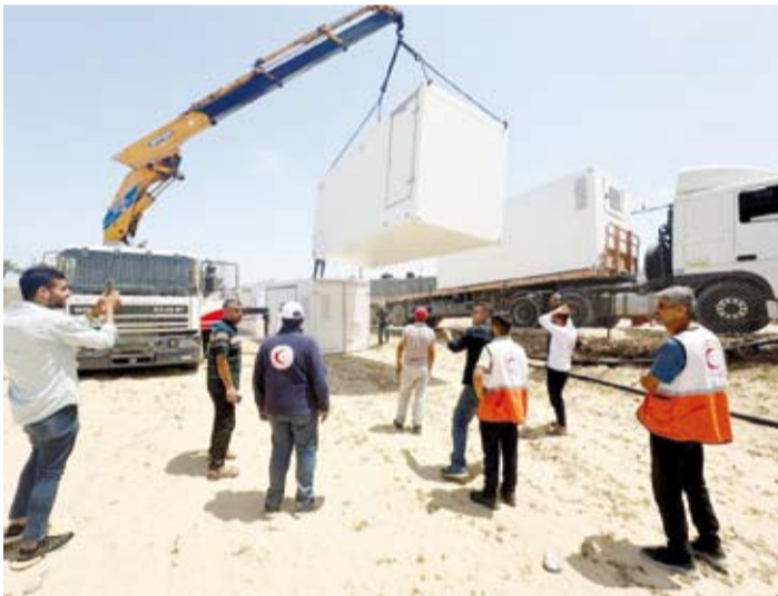
دخول المستشفى الميداني المتكامل الى قطاع بدعم الهلال الأحمر الكويتي