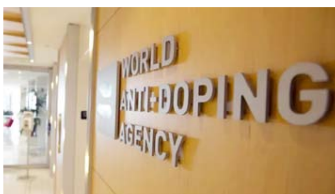
الوكالة العالمية لمكافحة المنشطات (وادا)

وكانت الوكالة العالمية ومقرها مونتريال، قد أعلنت أن ثلاث منظمات أخرى غير ملتزمة بالمدونة العالمية لمكافحة المنشطات، وهي اللجنة الأولمبية الوطنية الأنغولية، والوكالة الروسية لمكافحة المنشطات، والاتحاد الدولي للياقة البدنية وكمال الأجسام.