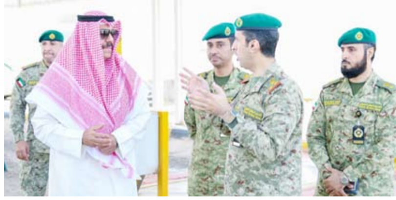
نائب رئيس الحرس الوطني يتفقد محطة إرسال المطالع

قام نائب رئيس الحرس الوطني الشيخ فيصل النواف، أمس، بجولة تفقدية على محطة إرسال المطالع التي يقوم بتأمينها رجال الحرس الوطني من كتيبة حماية المنشآت الخالفة في لواء الحماية الأول.