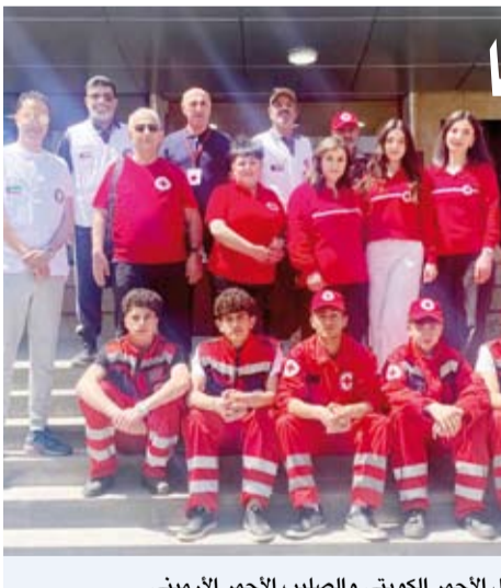
فريقي الهلال الأحمر الكويتي والصليب الأحمر الأرمني