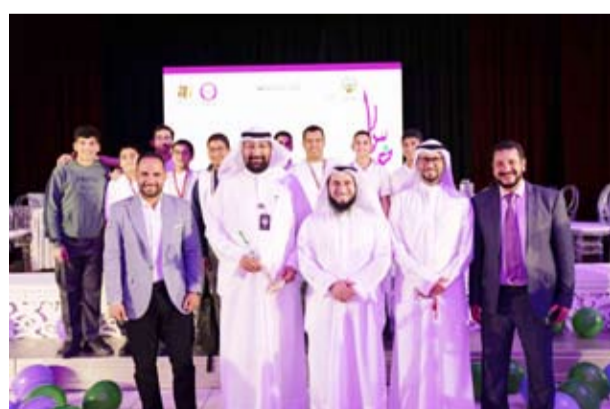
لقطة للمشاركين في البرنامج

المشروع إلى عدة مسابقات تناقست فيها المدارس المشاركة على نحو 100 جائزة، منها: أفضل مبادرة تعليمية، أفضل صورة وفيديو، أفضل تقرير علمي عن الكتاب، والمسابقة الثقافية الإلكترونية بين المدارس. وقد شارك في هذا المشروع نحو 44 مدرسة للبنين والبنات، أقامت خلالها مشاريع علمية، ومشاهد تمثيلية وسائط توضيحية، واستفاد من هذا المشروع نحو (30000) ثلاثين ألف طالب وطالبة، وأقيمت التصفيات