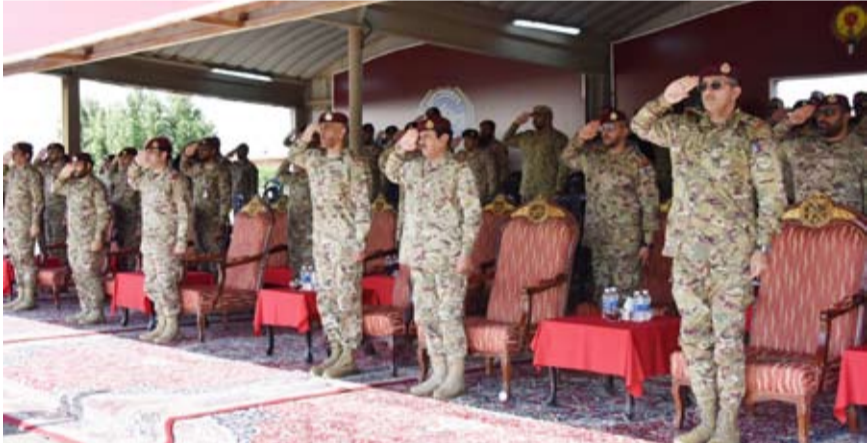
جانب من حضور كبار القيادات

احتفل الحرس الأميري برعاية وحضور أمر الحرس اللواء الركن بدر حماد، أمس، بتخريج الدورة رقم (107) المشتركة لضباط الصف والأفراد (مدرسة التدريب) والذين أنهوا فترة التدريب الأساسي بنجاح.