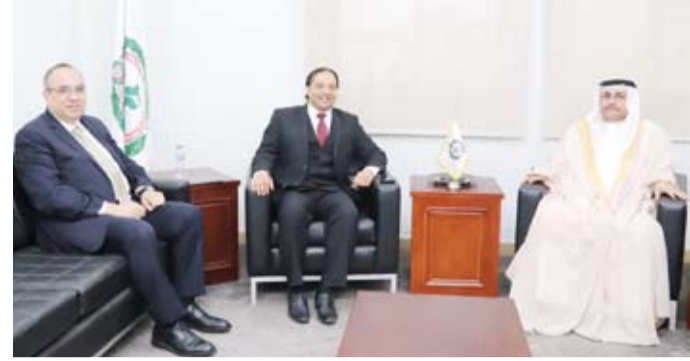
العسومي رئيساً لمجلس إدارة المنظمة العربية المتحدة للبحث العلمي