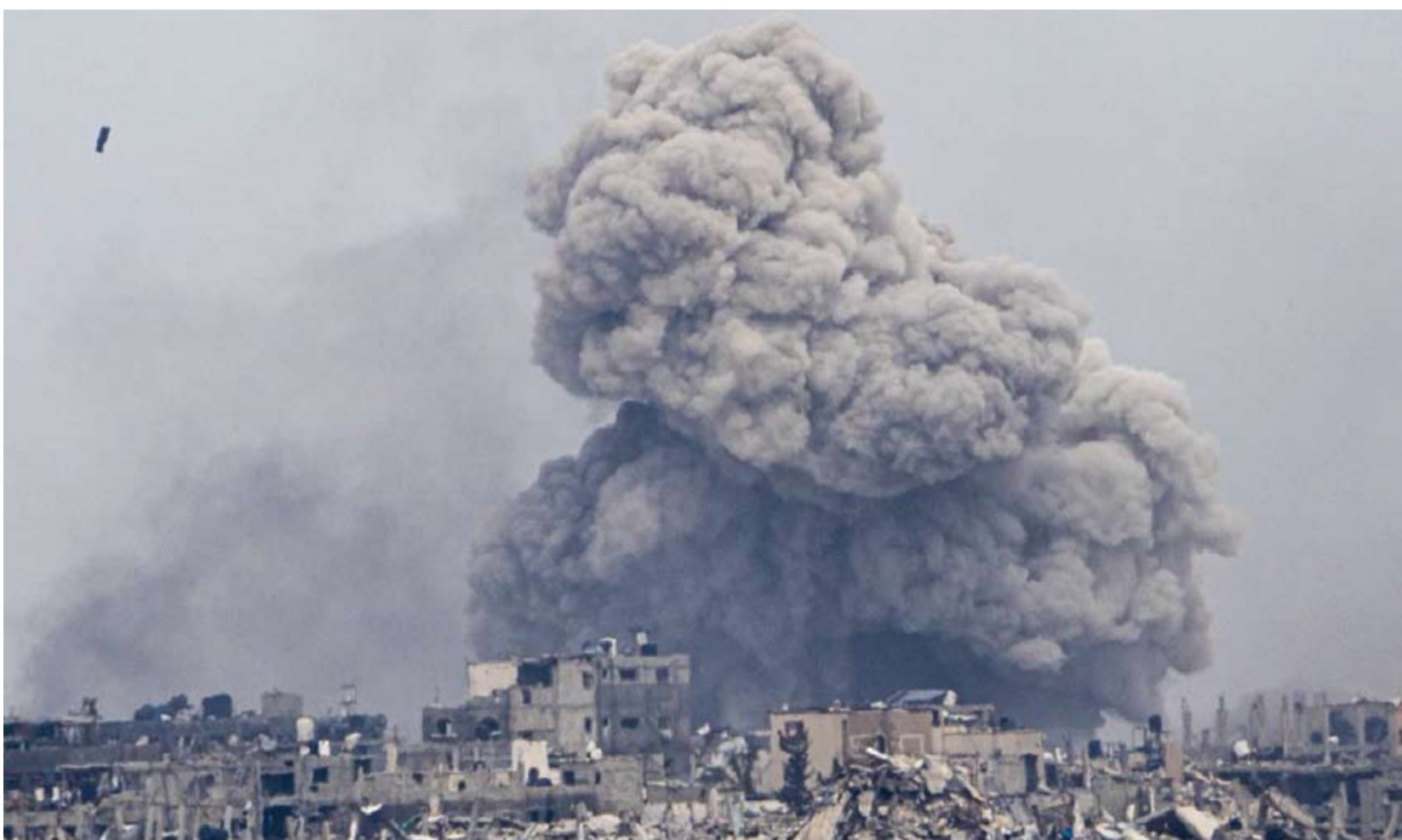
الغارات الصهيونية على قطاع غزة لا تتوقف

واستنكرت «حماس» اعتداءات أجهزة أمن السلطة على أبناء شعبها ومقاومينا». وطلبت، في بيان لها، «بضرورة تحمل الجميع مسؤوليتهم إزاء إنهاء هذه الممارسات المرفوضة ووضع تلك الأجهزة في مسارها الصحيح واجهها في حماية شعبنا وتسجيله للاحتصاص».