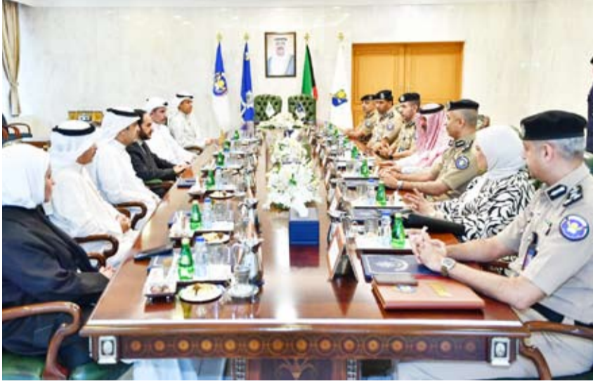
جانب من المشاركين في الاجتماع

التعليم وتنمية مهارات الطلبة الضباط منتسبي (الأكاديمية). وثمن في الوقت ذاته جهود جامعة الكويت في استئثار العناصر البشرية، مشيراً إلى أن الاتفاقية تضمنت عدة بنود من أهمها استكمال منتسبي (الداخلية) للدراسات القانونية والدراسات العليا وتنظيم زيارات سنوية متبادلة للطلبة. وبين أن الاتفاقية تهدف للاطلاع على التجارب المتميزة في مختلف المجالات الأكاديمية التي