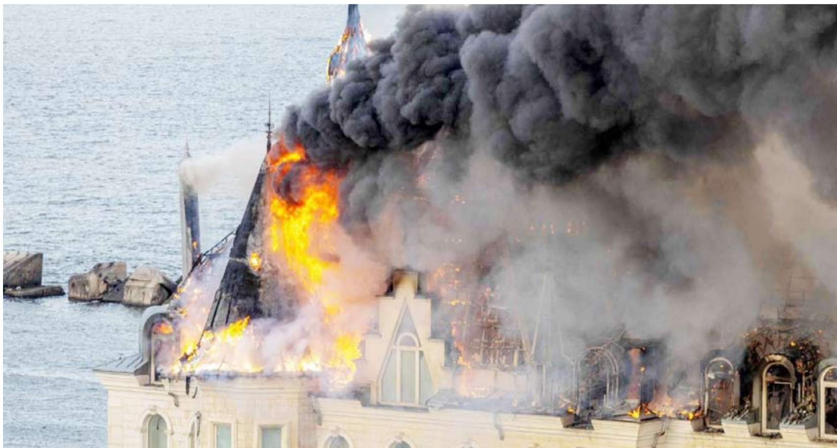
ضربة روسية على مدينة أوديسا الأوكرانية

وقالت إحدى القنوات الإعلامية إن مستودع شركة نونفا بوشتا، وهي شركة كبيرة لخدمات البريد والبريد السريع، تعرض للقصف. ونشرت مقطعاً مصوراً يظهر تطاير الحطام داخل المنشأة. وأوديسا هدف متكرر للهجمات الروسية، وأصبحت صواريخ مواقع في المدينة خلال اليومين الماضيين مما تسبب في مقتل ثمانية أشخاص. وأتهمت الولايات المتحدة، الجيش الروسي باستخدام «سلاح كيميائي»، هو مادة «الكلوروبيرين»، ضد القوات الأوكرانية، في انتهاك لمعاهدة حظر استخدام الأسلحة الكيميائية. وقالت وزارة الخارجية الأميركية في بيان، إن روسيا لجأت أيضاً إلى مواد كيميائية مخصصة أساساً لمكافحة الشغب (قنابل الغاز المسيل للدموع) واستخدامتها ضد القوات الأوكرانية «كأسلوب للحرب في أوكرانيا، وهو ما يشكل أيضاً انتهاكاً للمعاهدة».