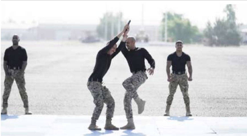
استعراض القررات في القتال المتلاحم

وأضاف البيان أنه بعد إعلان النتائج النهائية للطلبة وتلاؤهم للقسم القانوني قام راعي الحفل بتوزيع الشهادات والجوائز على الخريجين والمفوقين وتمني لهم التوفيق والنجاح وأن يترجموا ما تلقوه من علوم ودروس إلى واقع عملي في حياتهم العسكرية. وحضر حفل التخرج عدد من الضباط في الحرس الأميري.