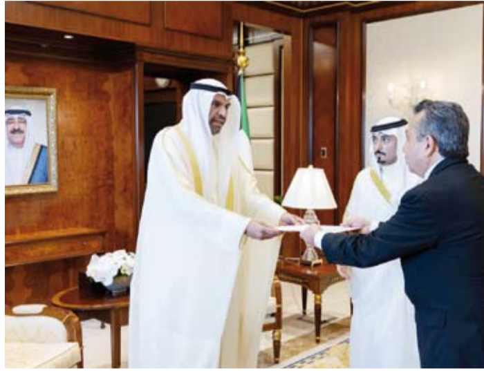
وزير الخارجية يتسلم نسخة من أوراق اعتماد سفير المكسيك

نغوين دو ك تانغ، وذلك خلال اللقاء الذي تم أمس في ديوان عام الوزارة. وتمنى الوزير للسفير الجديد التوفيق في مهام عمله وللعلاقات الثنائية الوثيقة التي تجمع البلدين الصديقين المزيد من التقدم والازدهار.