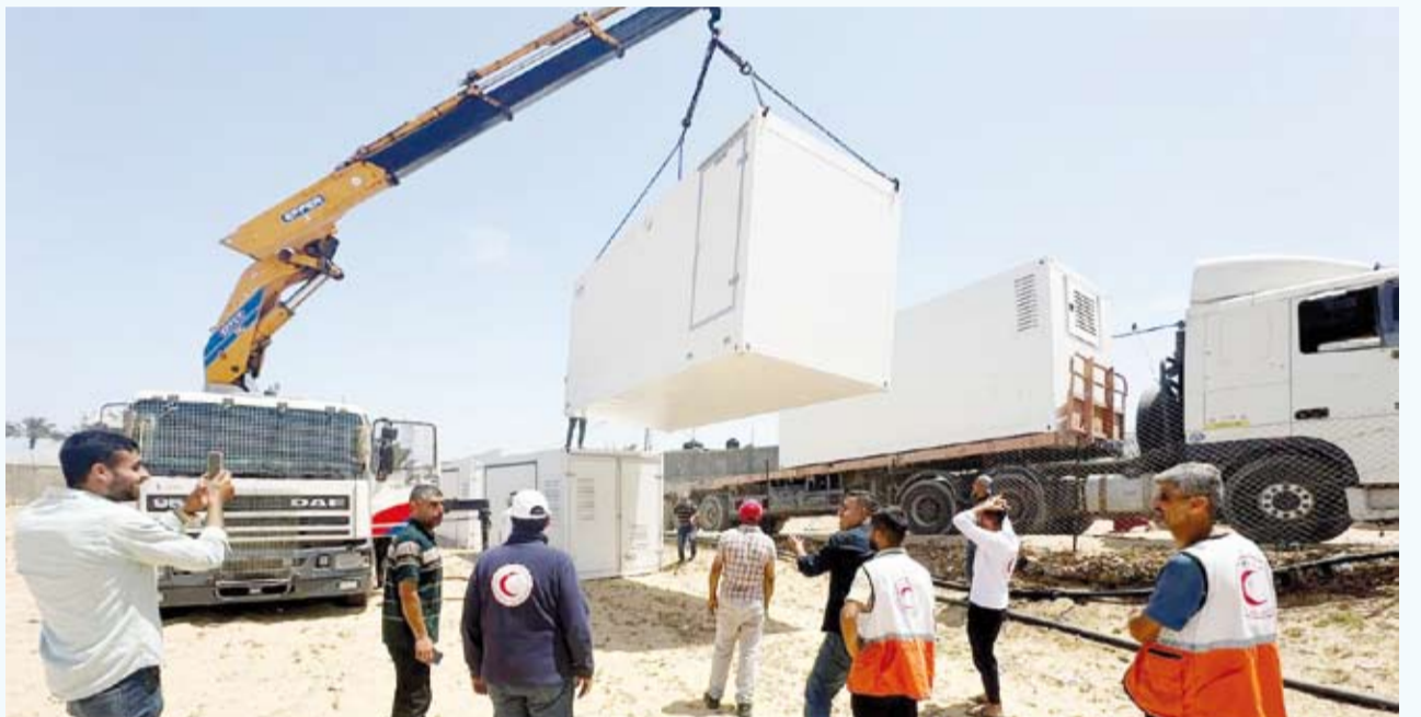
26 شاحنة مساعدات كويتية تصل الأردن تمهيداً لإدخالها إلى غزة وفي الصورة استكمال تجهيزات المستشفى

750 متراً مربعاً ويضم غرف عمليات وغرفاً للعناية المركزة وغرف استقبال المرضى.