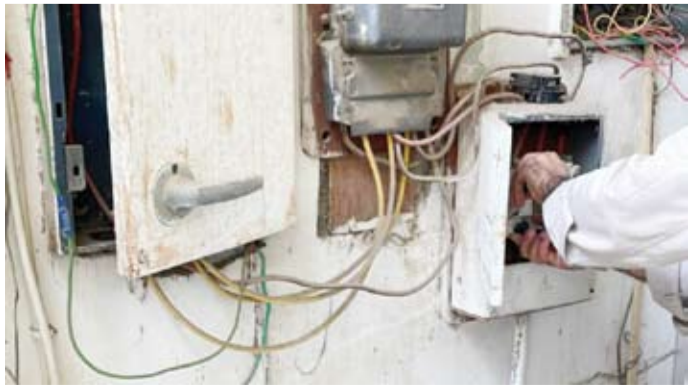
قطع التيار الكهربائي

13 مخالفة، وذكر أن مخالفات البناء المزالة طوعاً بلغ 34 وعدد وضع البلوكات للعقارات 64 مشيداً بدور الجهات المختصة في لجنة مكافحة ظاهرة العزاب والفرق الميدانية. وبين أن ذلك يأتي ضمن تعاون البلدية مع الجهات المشاركة والمثلة في "لجنة سكن العزاب" التي تضم وزارات الداخلية والكهرباء والماء والأشغال العامة والهيئة العامة للبيئة والهيئة العامة للقوى العاملة لحل مشكلة سكن غير العائلات في مناطق السكن الخاص والنموذجي. ودعا الجمهور إلى تقديم الشكاوى ضد أي سكن يشغله العزاب في مناطق السكن الخاص والنموذجي عبر موقع البلدية أو الواتساب الخاص بتلقي البلاغات أو تطبيق برنامج الشكاوى والبلاغات لبلدية الكويت.