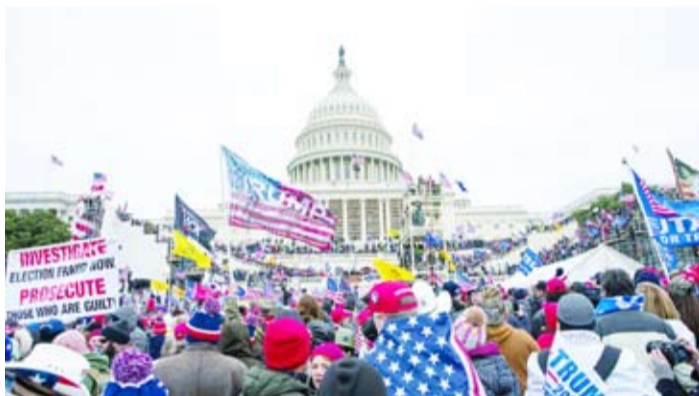
مناصرو ترامب أمام الكابيتول، يوم اقتحامه

لم يستبعد الرئيس الأميركي السابق دونالد ترامب احتمال وقوع أعمال عنف من جانب مؤيديه، إذا لم ينجح في الانتخابات الرئاسية المقررة في نوفمبر حسبما نقلته شبكة «سي إن إن». وقال ترامب، خلال مقابلة مع مجلة «تايم»، الأميركية، نُشرت «أعتقد أننا سنفوز، وإذا لم نَفز، فكما تعلمون، الأمر يعتمد دائماً على نزاهة الانتخابات». وقال ترامب خلال المقابلة التي جرت خلال جليستين في وقت سابق من هذا الشهر، في البداية، من احتمال وقوع أعمال عنف مماثلة للهجوم الذي وقع في 6 يناير 2021 على مبنى «الكابيتول»، حسب «سي إن إن».