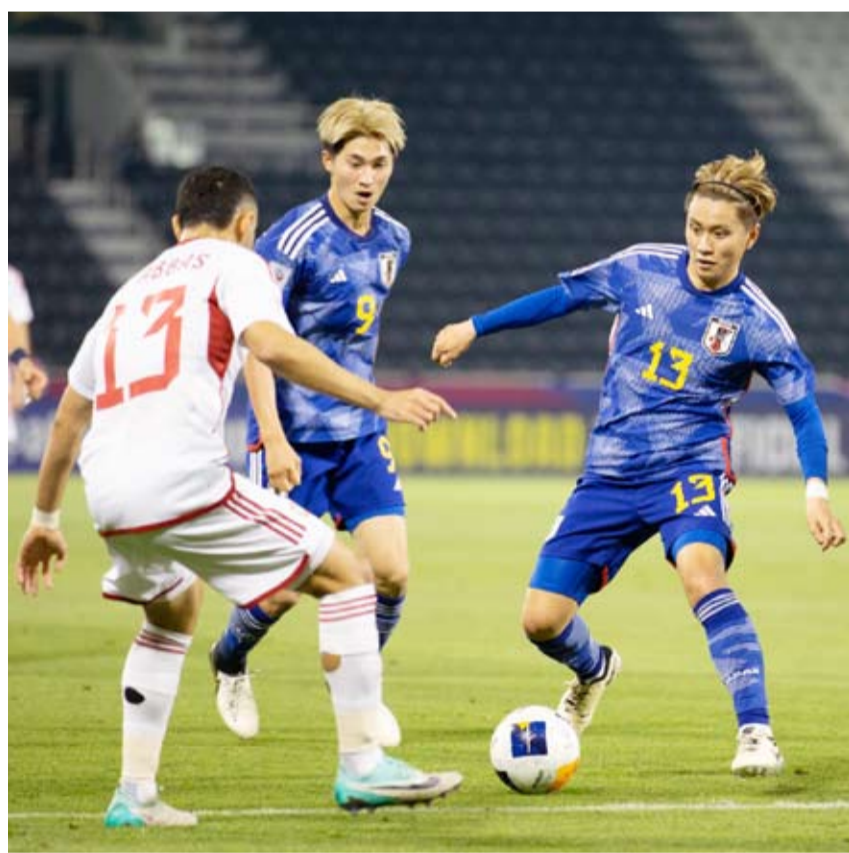
نهائي مرتقف بين اليابان والمنتخب الأوزبكي