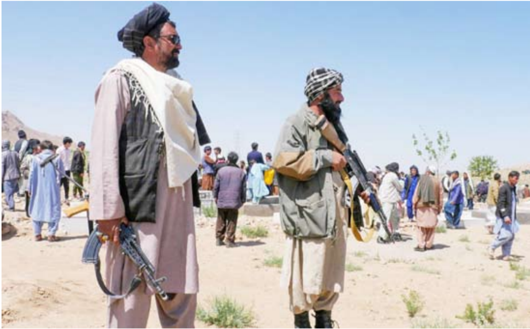
مسلمون من «طالبان» في مراسم دفن ضحايا الهجوم

وتبنى تنظيم «داعش - ولاية خراسان» هجوماً مسلحاً على مسجد في هرات بغرب أفغانستان، أوقع ستة قتلى بينهم إمام المسجد. وقال التنظيم عبر منصة «تلغرام»، إنه نفذ هجوماً على المسجد الشيعي، أدى إلى مقتل إمام المسجد، كما نقلت وكالة «الصحافة الفرنسية». وكانت وزارة الداخلية الأفغانية أعلنت، أنه نحو الساعة التاسعة «أطلق مسلح مجهول النار على مصدّن في مسجد بمنطقة غوزارا، غرب مدينة هرات، مضيئاً: «قتل ستة مدنيين، وأصيب آخر بجروح».