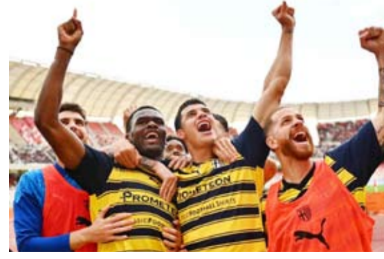
عودة بارما لدوري الدرجة الأولى بعد غياب 3 سنوات

المالية لإفلاسه ويهبط للدرجات الأدنى في الدوري الإيطالي. وكان بارما تمكن من العودة للدرجة الأولى عام 2018، غير أنه هبط مرة أخرى للدرجة الثانية عام 2021.