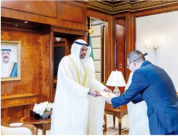
.. ويتسلم نسخة من أوراق اعتماد سفير فيتنام