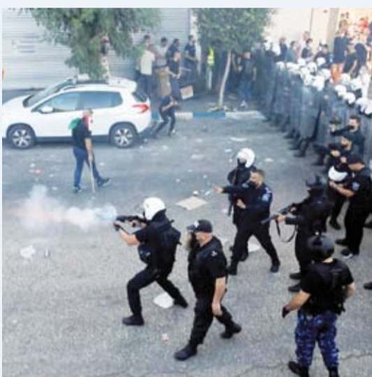
المدن الفلسطينية تشهد اشتباكات مسلحة بين أجهزة الأمن ومسلحين

تبادلت الأجهزة الأمنية الفلسطينية ومجموعة من المسلحين في مدينة طولكرم الاتهامات بعد مقتل مسلح وفق ما أوردته وكالة «رويترز».