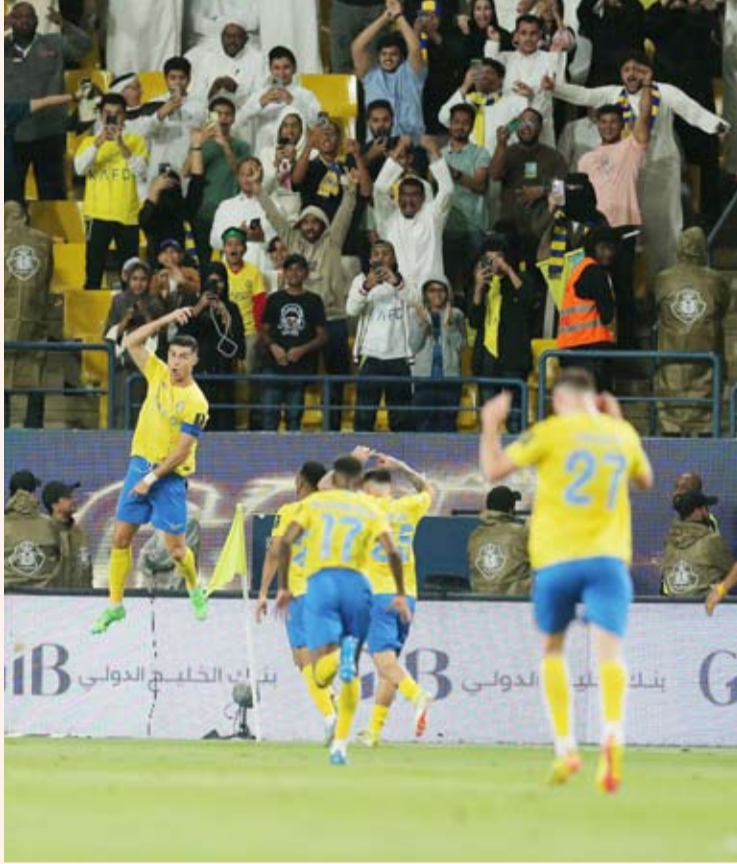
رونالدو يواصل التآلق مع النصر

وضرب النصر موعداً في المباراة النهائية مع الهلال الذي تأهل هو الآخر بعد فوزه على الاتحاد (2-1) مساء الثلاثاء الماضي. جدير بالذكر أن الأهلي يملك الرقم القياسي في عدد مرات الفوز بلقب مسابقة كأس خادم الحرمين الشريفين برصيد 13 لقباً مقابل 10 ألقاب للهلال و9 ألقاب للاتحاد و6 ألقاب للنصر و3 ألقاب للشباب، ولقبين لكل من الاتفاق والوحدة ولقب واحد لكل من الفيحاء والفيصلية والتعاون.