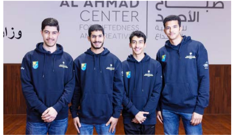
فريق جامعة الكويت