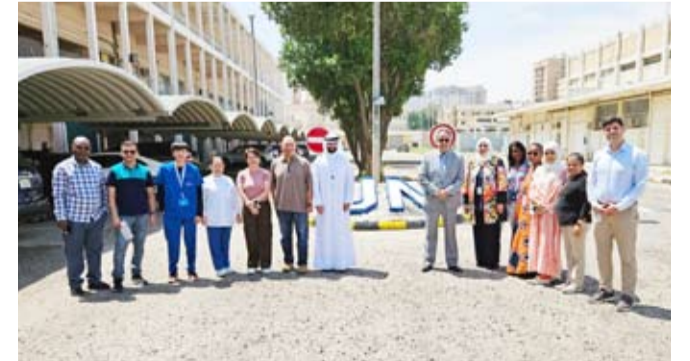
المشاركون في الحملة التوعوية

نظم معهد دسمان للسكري، أحد مراكز مؤسسة الكويت للتقدم العلمي مؤخراً حملة توعوية في مكتب الأمم المتحدة للدعم المشترك في الكويت، حيث تواجد على متن العيادة المتنقلة الخاصة بالمعهد فريقاً طبيياً لإجراء فحوصات السكري وضغط الدم والعلامات الحيوية وغيرها وتقديم الاستشارات الدوائية والطبية بالإضافة للكتيبات والمواد التوعوية وذلك للعاملين والمتواجدين في مقر المبنى التابع للأمم المتحدة.