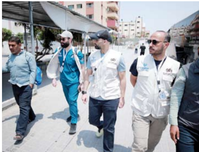
الفريق الطبي الكويتي يعلن عن حملة إنسانية لدعم المنظومة الصحية بغزة