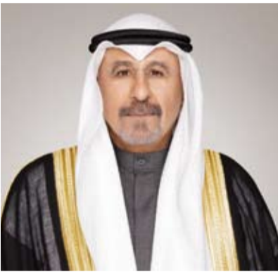
سمو الشيخ د.محمد الصباح

بعث سمو الشيخ د.محمد الصباح رئيس مجلس الوزراء المكلف بتصريف العاجل من الأمور، ببرقية تعزية إلى الرئيس شي جينبينغ رئيس جمهورية الصين الشعبية الصديقة، ضمنها سموه خالص تعازيه وصادق مواساته بضحايا انهيار جزء من الطريق السريع في مدينة ميتشو بمقاطعة قوانغدونغ جنوبي الصين.