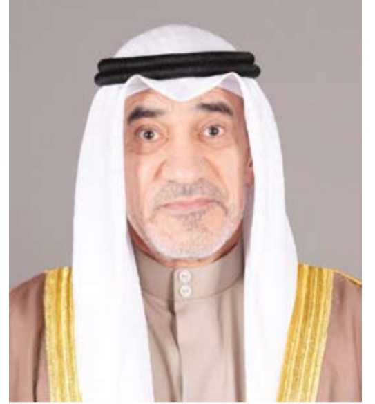
الشيخ فهد اليوسف

بعث نائب رئيس مجلس الوزراء ووزير الدفاع ووزير الداخلية بالوكالة الشيخ فهد اليوسف، ببرقية تعزية إلى نائب رئيس مجلس الوزراء ووزير الداخلية بدولة الإمارات العربية المتحدة الشقيقة الفريق الشيخ سيف بن زايد بوفاته المغفور له الشيخ طحنون بن محمد ممثل الحاكم في منطقة العين. وقالت الإدارة العامة للعلاقات والإعلام الأمني في بيان صحفي، أول أمس: إن الشيخ فهد اليوسف أعرب في البرقية عن خالص تعازيه وصادق مواساته بوفاته الشيخ طحنون بن محمد، داعياً المولى عز وجل أن يتغمد الفقيد بواسع رحمته ويسكنه فسيح جناته مع الأبرار والصالحين والصدّيقين وأن يلهم ذويهم والشعب الإماراتي الشقيق جميل الصبر وحسن العزاء.