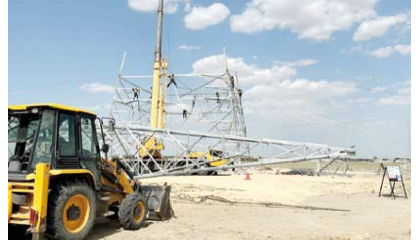
إنجاز 75 بالمئة من مشروع توسعة الربط الكهربائي الخليجي

وأكد أن المشروع من أهم مشاريع ربط البنى الأساسية التي أقرها المجلس لتخفيض الاحتياطي الكهربائي المطلوب في الدول الأعضاء، لافتاً إلى أن تنفيذه سيتم عبر مشروع إنشاء محطة الوفرة، مبيناً أن إجمالي تكلفة المشروع تبلغ حوالي 270 مليون دولار أمريكي.