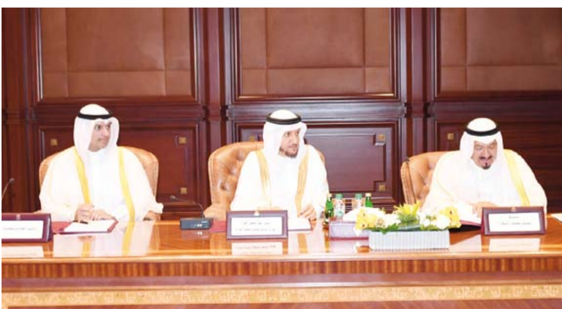
جانب من الاجتماع الاستثنائي لمجلس الوزراء