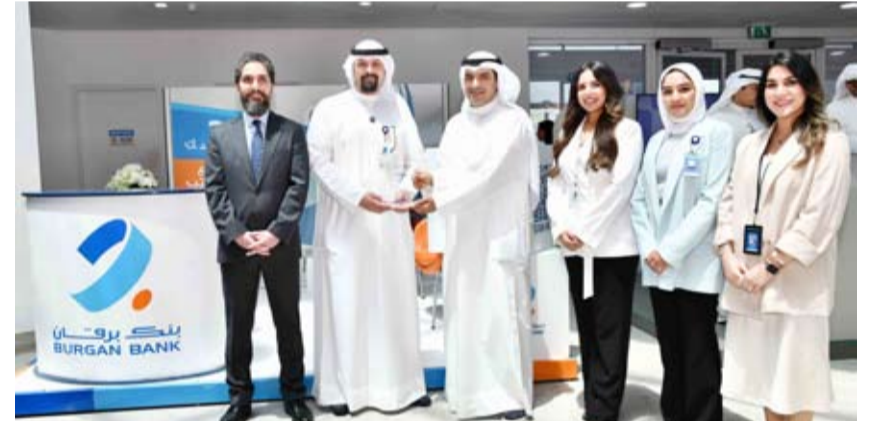
فريق برقان في جناح البنك

به خلال المناسبات والفعاليات الخاصة بهذا الشأن، على غرار معرض الفرص الوظيفية هذا. كما إن تواجدهم بشكل شخصي يعزّز قدرتهم على التواصل المباشر مع الرواد بما يناسب توجهاتهم وتطلعاتهم، حيث يتمّ التعرف إلى إمكانات المرشحين وتحديد قدراتهم الوظيفية مما يؤدي إلى نجاح موظفيهم في أداء مهمتهم وضمان رضى جمهور الباحثين عن فرص العمل.