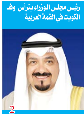
رئيس مجلس الوزراء يتراس وفد الكويت في القمة العربية

بين السطور التوجهات السامية من صاحب السمو إلى وزراء الحكومة الجديدة، تمثل خارطة طريق حقيقية رسمت معالم السنوات المقبلة، والتي يجب على أعضاء الحكومة تنفيذها بدقة، خاصة وأن سموه أكد متابعة الحكومة في تنفيذ أعمالها وواجباتها ومحاسبة من يقصر في أداء عمله. صاحب السمو أكد أن المرحلة الجديدة تركز على العمل الجاد والعطاء اللا محدود للإسراع في تنفيذ مشاريع استراتيجية تنموية طال انتظارها، لذا فمن الضروري وضع خطة عمل وجدول زمني واضح لتنفيذ برنامج عمل استثنائي يعكس سريعا على المجتمع الكويتي... الكرة الآن في ملعب الحكومة