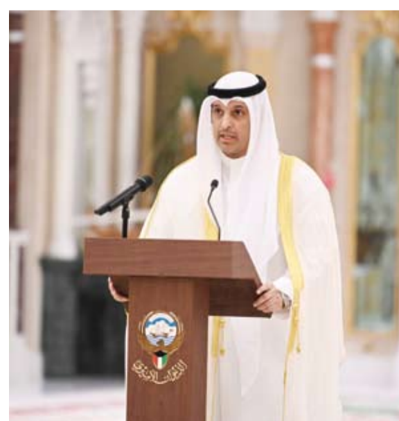
وزير الإعلام والثقافة عبدالرحمن المطيري يؤدي اليمين الدستورية