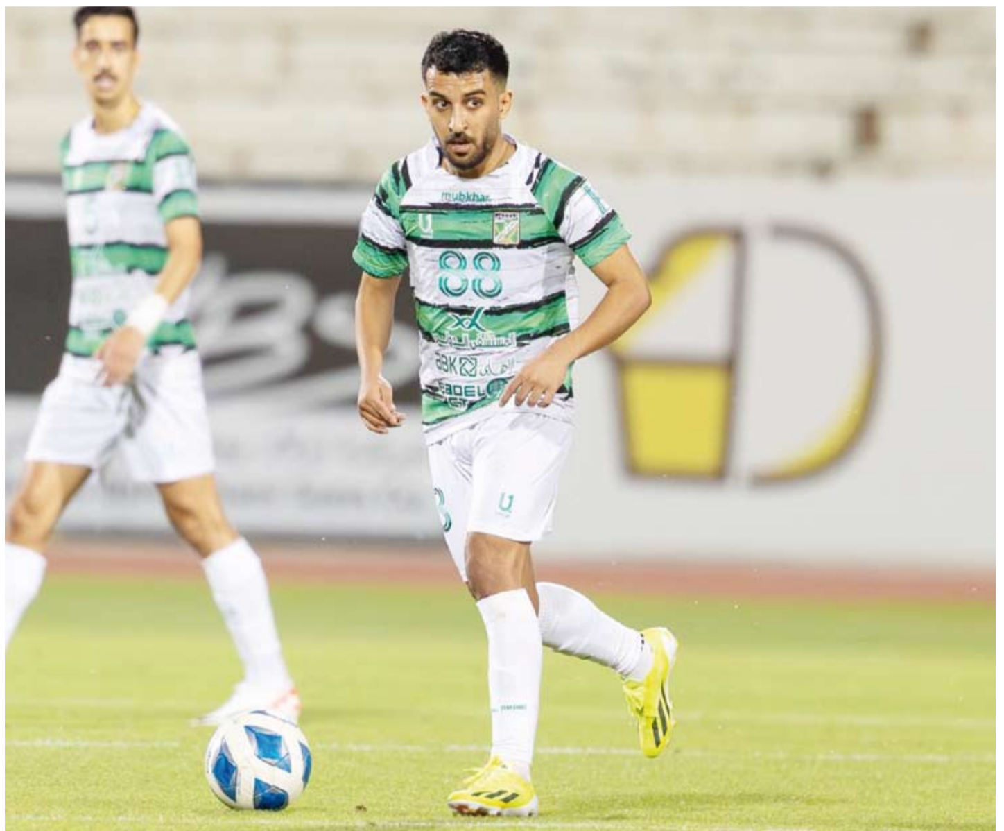
الأخضر يلاحق الكويت على صدارة دوري زين