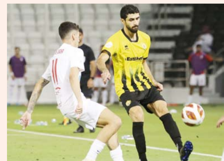
منافسة قوية في كأس أمير قطر لكرة القدم

التي توج بلقبها الوكرة على حساب الريان. وواجه السد صعوبات كبيرة في تحطيم الوكرة بعد مباراة شهدت سجلا بين الفريقين على مدار أطوارها، وعرفت الكثير من فواصل الإثارة والندية، بيد أن الحظ ابتسم لصالح السد الذي لعب بواقعية كبيرة وتمكن من خطف هدف الفوز والمباراة الوحيدة بواسطة مهاجمه الجزائري بغداد بونجاح الذي تمكن من فرض نفسه نجما للقاء، مستعيدا مستوى المعهود ليقود فريقه للدور قبل النهائي والاقتراب خطوة من بلوغ النهائي وتحقيق اللقب التاسع عشر له في تاريخه.