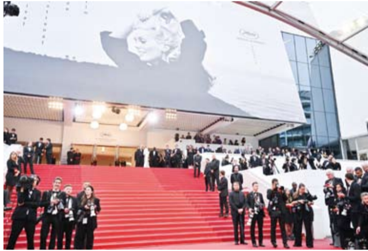
انطلاق مهرجان كان السينمائي

انطلقت فعاليات الدورة الـ 77 (من مهرجان كان) السينمائي، أول أمس، بعرض الفيلم الكوميدي (الاختيار الثاني) لكويتيين. واستقبلت السجادة الحمراء في مدينة (كان) جنوبي فرنسا، المصنف نجوم الفن الذين حضروا حفل افتتاح المهرجان الذي يستمر حتى الـ 25 من الشهر الجاري. ويتنافس في هذه النسخة من المهرجان في المسابقة الرسمية 22 فيلماً من مدارس مختلفة أهمها فيلم (مغالوبوليس) للمخرج فرانسيس فورد كوبولا يميزانية باهظة (120 مليون دولار). ويترأس لجنة التحكيم المخرجة الأمريكية غريتا غيرويغ وتضم اللجنة في عضويتها المخرجة اللبنانية نادين لبكي وكاتب السيناريو والمصور التركي إبروسيلان إلى جانب آخرين من أبرز الأسماء في عالم الإخراج والفن. ومن المقرر أن يستضيف