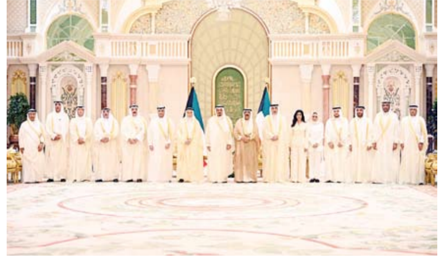
سمو أمير البلاد خلال استقباله رئيس مجلس الوزراء والوزراء أداء اليمين الدستورية