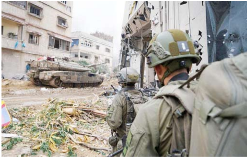
دورية للجيش الصهيوني في قطاع غزة

الفلسطيني إن 10 أشخاص قُتلوا جراء قصف إسرائيلي على عيادة طبية في حي الصبرة بجنوب مدينة غزة في شمال القطاع. وأشارت قناة «الأقصى» التلفزيونية إلى أن العيادة تابعة لوكالة الأمم المتحدة لغوث وتشغيل اللاجئين الفلسطينيين (الأونروا). ودارت اشتباكات عنيفة بين الفصائل والقوات الإسرائيلية أيضاً في مخيم جباليا؛ حيث نفذت القوات الإسرائيلية أيضاً عملية عسكرية واسعة منذ عدة أيام. وأعلنت «سرايا القدس»، الجناح العسكري لحركة «الجهاد الإسلامي»، في بيان أنها خاضت اشتباكات عنيفة مع جنود إسرائيليين قرب مخيم جباليا، وأوقعت عدداً منهم بين قتيل وجريح. وكانت «كتائب القسام»، الجناح العسكري لحركة «حماس»، قد قالت إنها قتلت 7 جنود إسرائيليين شرق معسكر جباليا.