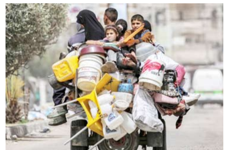
35233 شهيداً و 79141 جرحياً منذ 7 أكتوبر الماضي