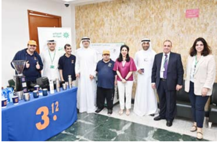
الشيخ أحمد الدعيج الصباح مع فريق الإدارة

انطلاقاً من حرصه على الاهتمام بجميع شرائح المجتمع ودعم المشاريع الصغيرة لا سيما المشروعات التي يقوم عليها ذوي الهمم ومتحدي الإعاقة، يؤكد البنك التجاري الكويتي اهتمامه الدائم بتقديم الدعم والرعاية عن طريق برامج خاصة مصممة لخدمة هذه الشريحة الجديرة بكل اهتمام. وفي هذا الإطار قام البنك التجاري الكويتي بالتعاون مع «كافيه 312»، المقهى الأول من نوعه في الكويت والذي يُدار بالكامل من قبل ذوي الهمم، لتقديم القهوة والماكولات الخفيفة لجميع موظفي البنك لمدة يومين في مقر البنك الرئيسي.