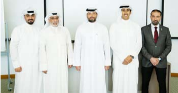
مشركون في ورشة العمل

وفي ختام الندوة، تقدّم فريق الجامعة بالشكر والتقدير لإدارة العقارية في KIB، لجهودهم في إعداد وتقديم ورشة العمل الغنية بالمعرفة والمعلومات القيمة. وكذلك، توجّه الصالح بالشكر على هذه الدعوة لمشاركة خبرات KIB الواسعة والشاملة في مجال الاستثمار والتقييم العقاري.