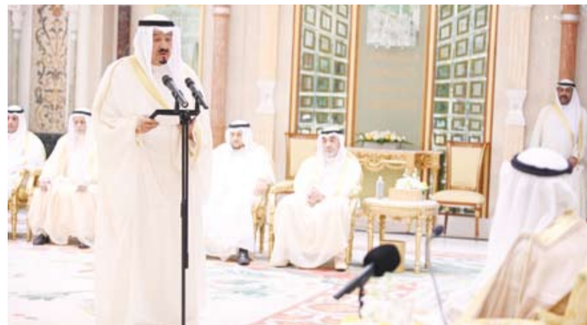
سمو الشيخ أحمد عبدالله رئيس مجلس الوزراء خلال أداء اليمين الدستورية

متمسكين بوثابتنا القوية ووحدتنا الوطنية، غايتنا تحقيق نهضة شاملة لكويت الحاضر والمستقبل. وإننا أؤكد متابعتي للحكومة في تنفيذ أعمالها وواجباتها، ومحاسبة من يقصر في أداء عمله، فإنني أوجهها إلى ما يلي: