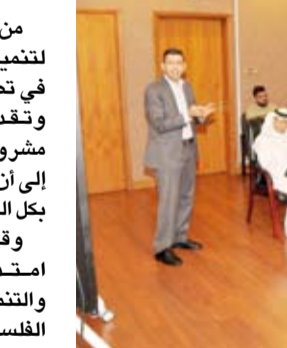
جانب من الاجتماع مع وفد «وفا»

وأضاف أن الاعتداء الصهيوني مستمر على قطاع غزة وخلف آلاف الأيتام بلا عائل في قطاع محاصر يخلو من أبسط مقومات الحياة، موضحاً أنه سيتم تقديم خدمات متكاملة للأيتام بما يمكنهم من العيش بكرامة ليصبحوا أشخاصاً فاعلين في مجتمعاتهم وبناء مستقبل أفضل لهم.