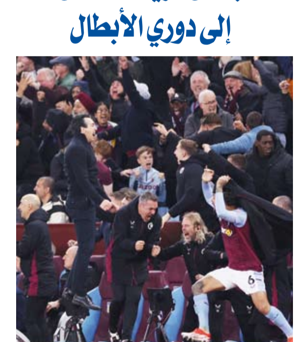
استون فيلا فريق الأمير وليام المفضل

احتفل الأمير ويليام ولي العهد البريطاني وأمير ويلز بتأهل فريقه المفضل أستون فيلا إلى دوري أبطال أوروبا لأول مرة منذ 4 عقود، وذلك بعد فوز مانشستر سيتي على توتنهام. ونشر الأمير ويليام على حساب "كيبسينغتون رويال" الذي يتشاركه مع زوجته كاثرين: نحن في دوري الأبطال! موسم تاريخي وإنجاز مذهل. شكرا أو تاي، شكرا للفريق ككل ولكل من بالنادي. لا يمكنني الانتظار للموسم المقبل. وستكون هذه هي المشاركة الأولى للفريق منذ ظهوره الأخير في كأس الأندية الأوروبية البطلة في موسم 1982 - 1983. وكان الفريق توج بلقب بطل أوروبا موسم 1982-1981 بعد أن سجل بيتر ويت الهدف الوحيد في المباراة النهائية التي أقيمت في روتردام أمام بايرن ميونخ.