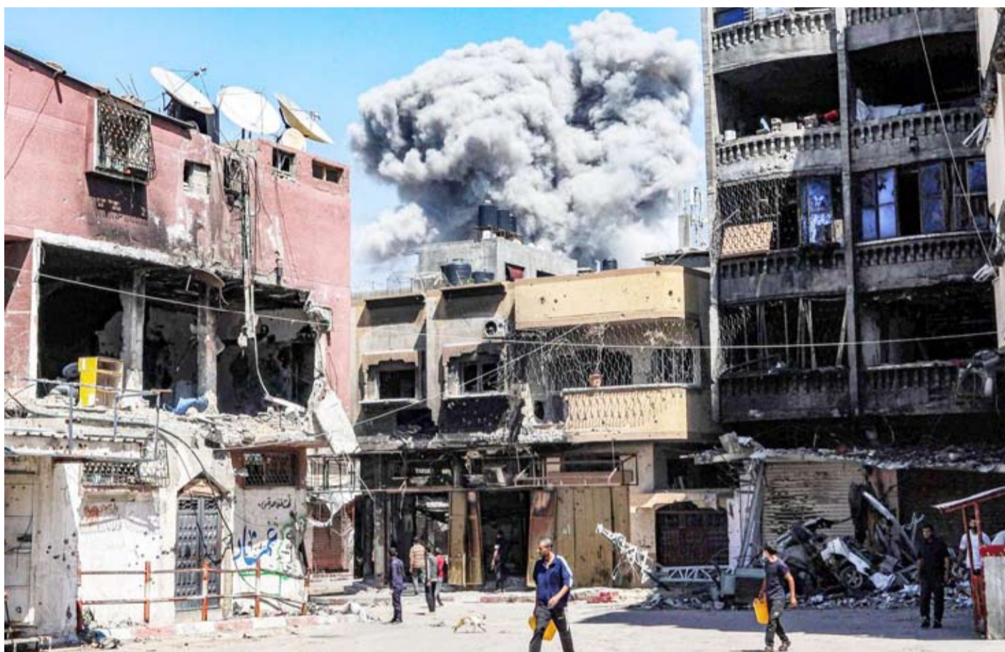
غارات صهيونية على موقع في جباليا

قالت مسؤولة في منظمة اليونيسيف، إن المنظمة ستواجه مأساة كبرى إذا لم يتم فتح المعابر إلى غزة، مشيرة إلى أن نقص الوقود يمثل مشكلة كبرى. وفي بيان للمنظمة، قالت المديرية الإقليمية لليونيسيف لمنطقة الشرق الأوسط وشمال أفريقيا، أدبيل خضّر: «منذ بدء هذا التصعيد الأخير، تواجه اليونيسيف تحديات متزايدة لنقل أي مساعدات إلى قطاع غزة. ولا يزال نقص الوقود يمثل مشكلة حرجة». ودعت خضّر إلى فتح المعابر الحدودية مع غزة بسرعة، والسماح للمنظمات الإنسانية بالتنقل بحرية، وتقديم المساعدة الحيوية المنقذة للحياة. وأضافت خضّر أن عدم فتح المعابر الحدودية مع غزة سريعاً «سيؤدي إلى مأساة أكبر مما شهدناه بالفعل، وهو أمر يجب أن نعمل بشكل عاجل على تجنبه». وتابعت: «المستشفيات الرئيسية في الشمال داخل مناطق الإخلاء، بما في ذلك كمال عدوان، ومستشفى العودة، والمستشفى الإندونيسية، في مرمى النيران، ما يعطل بشدة إيصال الإمدادات الطبية الحيوية، ويعرض حياة كثير من الأشخاص للخطر».