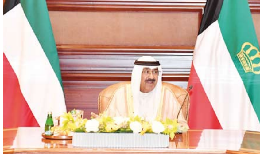
أمير البلاد يت رأس اجتماعاً استثنائياً لمجلس الوزراء

ودعا المولى عز وجل أن يتمتع بموفقو الصحة وتمام العافية وأن يحفظ الكويت العزيزة ويديم عليها وعلى شعبها نعم الأمن والأمان والاستقرار والتقدم والازدهار في ظل القيادة الحكيمة نخرا للبلاد.