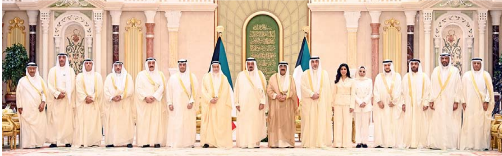
صاحب السمو الأمير متوسلا سمو رئيس مجلس الوزراء والوزراء الجدد عقب أداء اليمين الدستورية