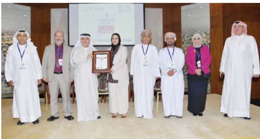
الشيخة سهيلة الصباح خلال منحها لقب «سفير أممي للشراكة المجتمعية»

تعزير الشراكات وتحقيق الأهداف الاجتماعية والبيئية. وبينت الشبيخة سهيلة الصباح أن دور السفير الأممي للشراكة المجتمعية يتعدى ذلك أيضاً إلى بناء جسور التواصل والتعاون لتحقيق التنمية المستدامة وتعزيز السلام والاستقرار في العالم. وكانت مراسم التقليد الرسمي للشيخة سهيلة قد تمت ضمن فعاليات مؤتمر وجائزة الشراكة والمسؤولية المجتمعية الثامن للمؤسسات المالية والمصارف الإسلامية لعام 2024 الذي استضافته دولة الكويت أمس الأول برعاية رئيس مجلس إدارة الهيئة الخيرية الإسلامية العالمية