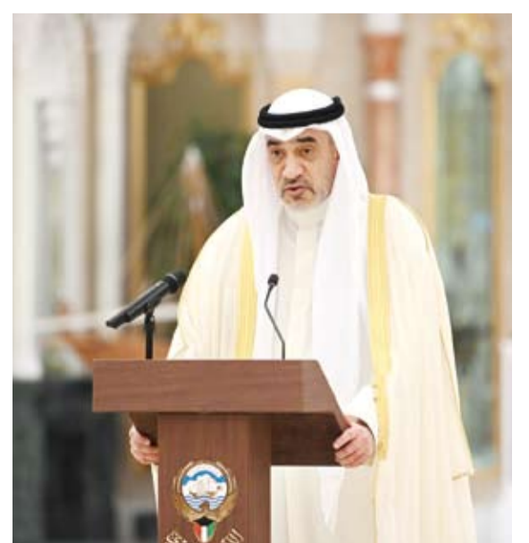
النائب الأول لرئيس مجلس الوزراء ووزير الدفاع والداخلية الشيخ فهد يوسف