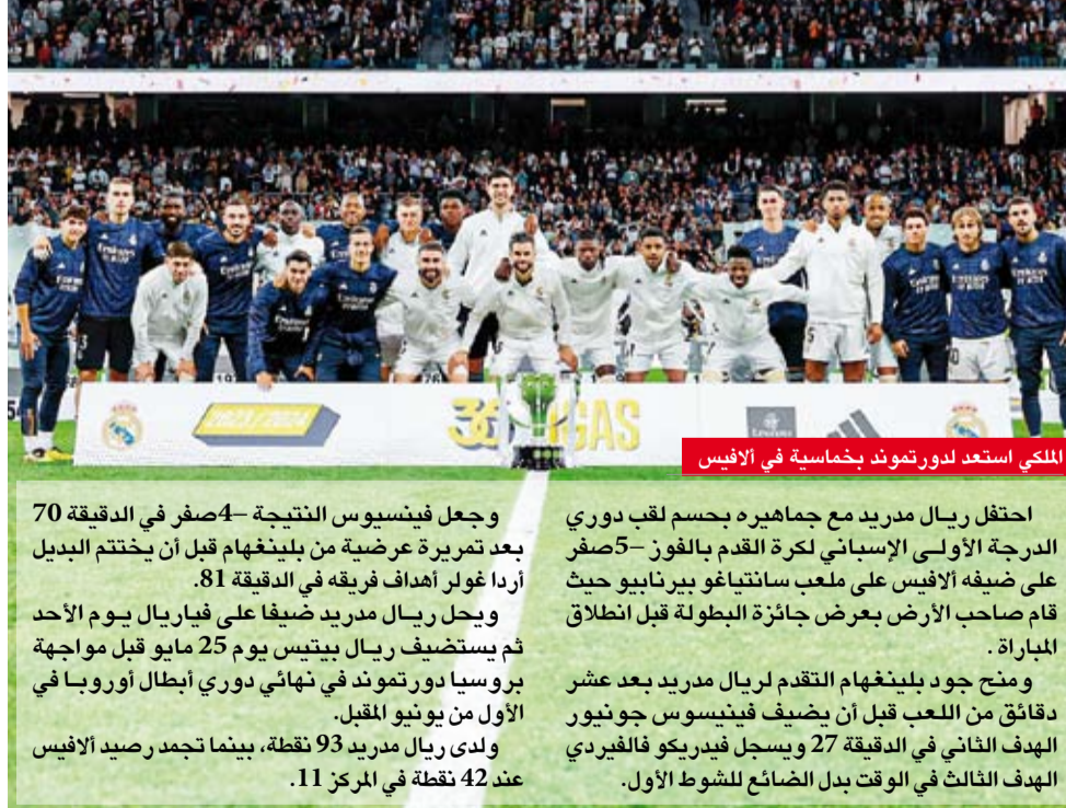
الملك استعد لدورتموند بخماسية في الأفيس

وجعل فيشوس النتيجة 4-صفر في الدقيقة 70 بعد تمريرة عرضية من بلينغهام قبل أن يحتتم البديل أندا غولر أهداف فريقه في الدقيقة 81. ويحل ريال مدريد ضيفا على فياريال يوم الأحد ثم يستضيف ريال بيتيس يوم 25 مايو قبل مواجهة بروسيا دورتموند في نهائي دوري أبطال أوروبا في الأول من يونيو المقبل. ولدى ريال مدريد 93 نقطة، بينما تجمد رصيد الأفيس عند 42 نقطة في المركز 11.