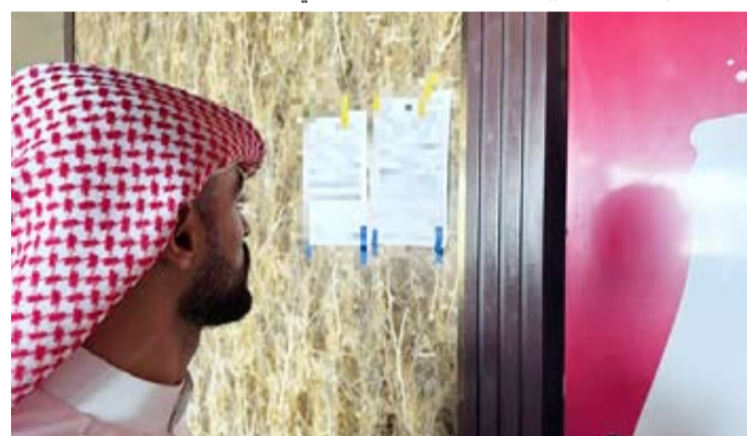
اغلق محل مخالف