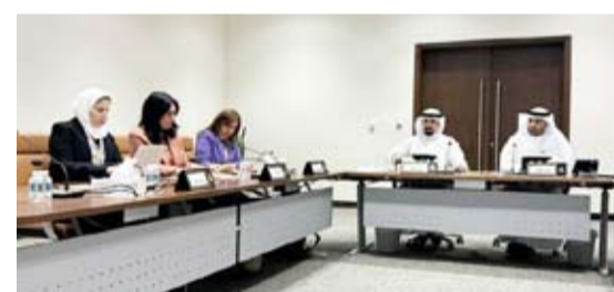
جانب من اجتماع اللجنة