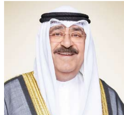
سمو أمير البلاد الشيخ مشعل الأحمد

بعث صاحب السمو أمير البلاد الشيخ مشعل الأحمد، بمرقية تهنئة إلى الرئيس سانتياغو بينيا رئيس جمهورية باراغواي الصديقة، عبر فيها سموه عن خالص تهنائه بمناسبة العيد الوطني لبلاده. متمنياً سموه لفخامته موفور الصحة والعافية ولجمهورية باراغواي وشعبها الصديق كل التقدم والأزدهار.