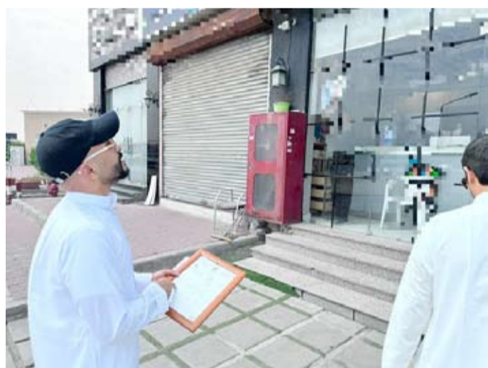
موظفي البلدية يعاينون اعلنا لاحد المحلات