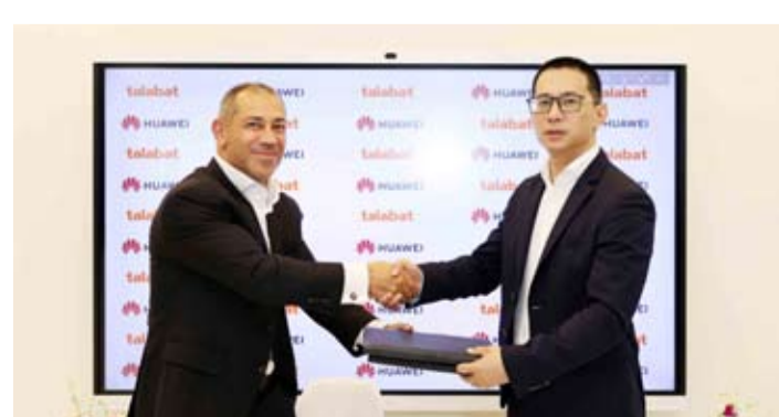
هاواي تعقد شراكة مع طلبات

فارقة كونه يمثل تحالفاً استثنائياً وغير مسبق بين اثنين من الأسماء البارزة في القطاع، وللذان يجمعهما التزام مشترك بأبحاث تقنية نوعية في مشهد الإعلانات الرقمية وزيادة مشاركة المستخدم.