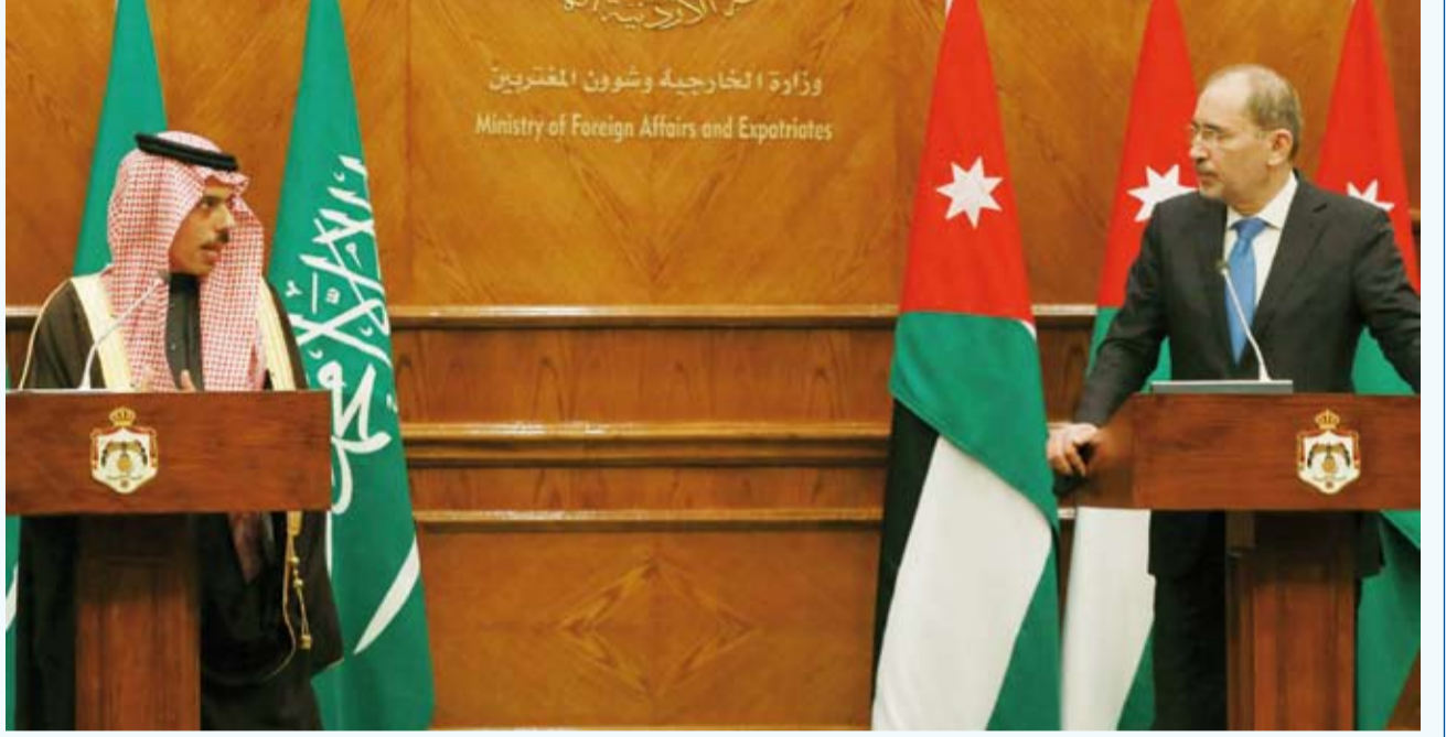
وزير خارجية المملكة طالب اللبنانيين بإصلاحات لاستعادة حكم الدولة

قال وزير الخارجية السعودي فيصل بن فرحان أمس إنه على إيران أن تبني الثقة من أجل التعاون المستقبلي، مشيراً إلى تحقيق بعض التقدم في المحادثات مع إيران لكن ليس بشكل كاف. وأكد بن فرحان، خلال مؤتمر صحفي مع نظيره الأردني، أيمن الصفدي بأنه على اللبنانيين أن يقوموا بإصلاحات لاستعادة حكم الدولة، مضيفاً بأن التغيير وموضوع حزب الله بيد اللبنانيين. وشدد على ضرورة دفع عملية السلام الفلسطينية-الإسرائيلية للأمام، مضيفاً أن دول مجلس التعاون الخليجي تسعى لاستقرار وسلام منطقة الشرق الأوسط وضمان أمن الطاقة، وحول انتخابات لبنان، قال إنها «قد تكون خطوة إيجابية لكن من السابق لأوانه قول ذلك».