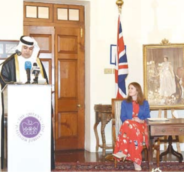
جانب من الحفل