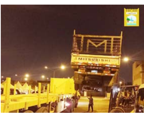
رفع إحدى السيارات