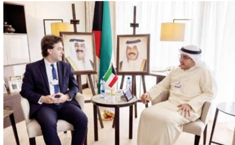
الشيخ الدكتور أحمد ناصر المحمد خلال لقائه بنائب رئيس الوزراء وزير الخارجية والتكامل الأوروبي في جمهورية مولدوفا

وزير الخارجية، مع رئيسة شركة غوغل كلاود الدولية Google Cloud International، أديب فوكس مارتن، وذلك على هامش مشاركة وزير الخارجية في المنتدى الاقتصادي العالمي المنعقد في دافوس. حيث تناول اللقاء بحث التعاون المشترك وفرص تعزيز التنمية الاقتصادية.