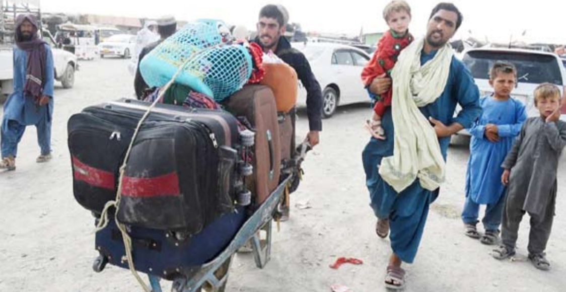
العائلات يعودون إلى باكستان

والمسلمين من الأراضي الباكستانية. وبدأت حركة «طالبان» الباكستانية في العودة إلى الأراضي الباكستانية في 2018 بعد إحياء أنشطة «طالبان» الباكستانية داخل المناطق الحدودية الباكستانية - الأفغانية. وبعد أن كشفت «طالبان» هجماتها ضد قوات الأمن الباكستانية، طلبت الحكومة الباكستانية من حركة «طالبان» الأفغانية الحد من نشاطات الحركة الأصولية داخل المناطق الحدودية. ويعتقد أن المحادثات الأخيرة جزء من هذه الجهود، خصوصا أن حكومة «طالبان» وافقت لا تزال متنتعة عن اتخاذ أي إجراء ضد حركة «طالبان باكستان»، وبدلاً من ذلك تبدو حريصة على إيجاد مخرج لها من خلال المحادثات.