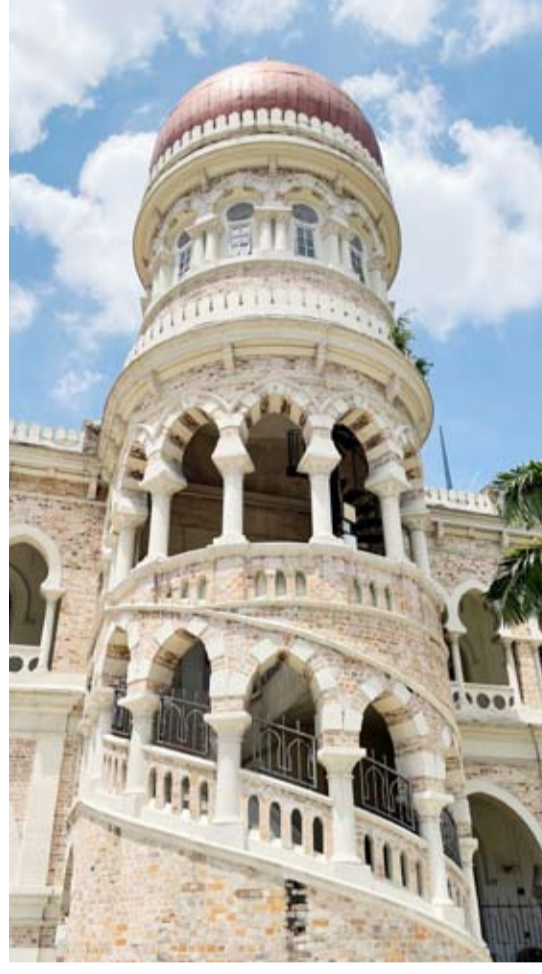
أحد البرجين في المبنى