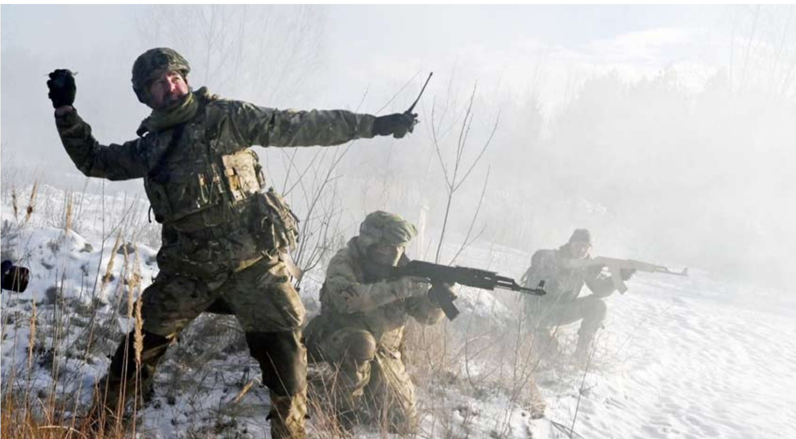
الحرب في أوكرانيا

قال الرئيس الأميركي جو بايدن في اجتماع للمجموعة الرباعية (الولايات المتحدة، بريطانيا، فرنسا، ألمانيا)، إن الأزمة في أوكرانيا قضية عالمية وليست إقليمية، وفقاً لوكالة «رويترز». وأضاف بايدن «هذه أكثر من مجرد قضية أوروبية. إنها قضية عالمية». وشدد على أن واشنطن ستقف إلى جانب «شركائها المحليين المقربين» للضغط من أجل أن تكون منطقة المحيطين الهندي والهادي حرة ومفتوحة. وقال «هجوم روسيا على أوكرانيا إنما يبرز بحسب من أهمية تلك الأهداف الأساسية للنظام الدولي ووحدة الأراضي والسيادة». و يلتقي بايدن بقيادة الآخرين لما تسمى مجموعة «الرباعية» - اليابان وأستراليا والهند - في طوكيو في إطار اليوم الأخير