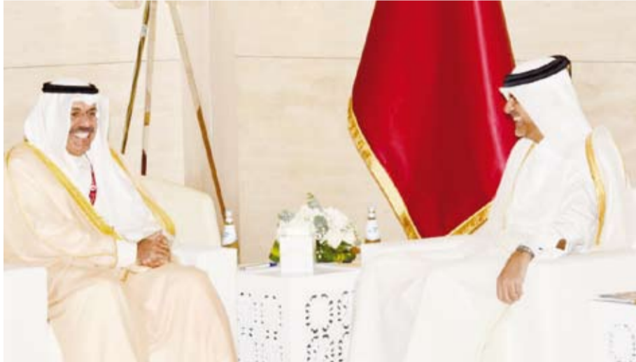
النواف بحث مع رئيس الوزراء القطري الملفات الأمنية ذات الاهتمام المشترك

بحث النائب الأول لرئيس مجلس الوزراء ووزير الداخلية الفريق أول متقاعد الشيخ أحمد النواف مع رئيس مجلس الوزراء ووزير الداخلية في دولة قطر الشيخ خالد بن خليفة آل ثاني عدداً من الملفات الأمنية ذات الاهتمام المشترك. وخلال لقائهما أمس على هامش افتتاح معرض الأمن والسلامة (ميليبول قطر 2022) أشار النواف إلى عمق العلاقات الأخوية بين البلدين. وبحث الجانبان سبل تعزيز التعاون في مجالات تبادل الخبرات والمعلومات وإقامة التمرينات المشتركة لزيادة آفاق العلاقات الراضية بين البلدين الشقيقين.