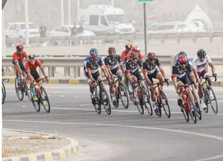
برنزية الدراجات الهوائية من نصيب الكويت