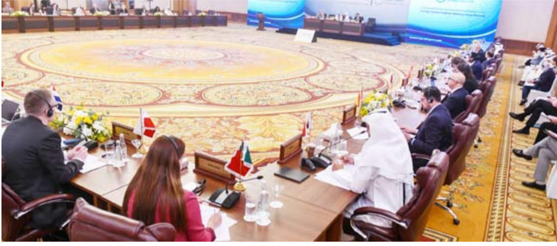
جانب من الجلسة الافتتاحية للاجتماع الدولي لمكافحة الإرهاب