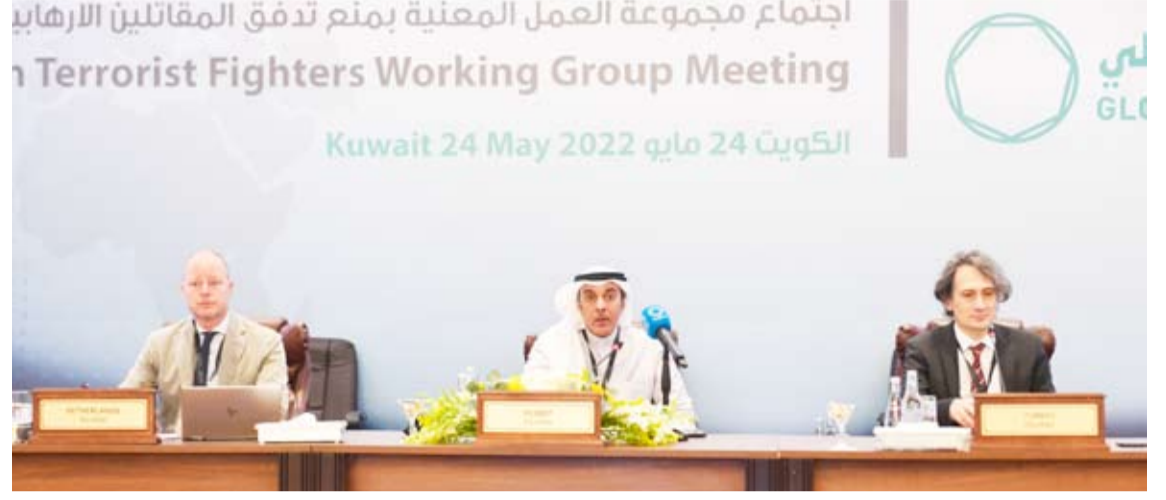
مساعِد وزير الخارجية لشؤون التنمية والتعاون الدولي الوزير المفوض حمد المشعان خلال الجلسة

تهدف إلى استكمال الأعمال التي قاموا بها من خلال اجتماعهم السابقة. وأكد التزام دولة الكويت بقراري مجلس الأمن رقمي (2178) و(2253) ودعمها لدول التحالف الدولي والمجموعات المنبثقة منها ضد تنظيم داعش. ويناقش الاجتماع الدولي لمكافحة الإرهاب الذي تستضيفه دولة الكويت إيجاد طرق جديدة وتشريعات حول كيفية إعادة تأهيل واستقبال المقاتلين في مناطق النزاع بعد إخضاعهم لحاكمات عادلة إضافة إلى أهمية خلق برامج تساهم في تأهيلهم وادماجهم في المجتمع. كما يبحث الاجتماع كافة التحديات الرئيسية لإيجاد حلول للمرحلة المقبلة، مشيراً إلى ضرورة التنسيق وتبادل المعلومات بين الدول الأعضاء في التحالف الدولي ضد داعش وكيفية الاستفادة من التجارب الوطنية وتعزيز بناء القدرات في مجال مكافحة الإرهاب. يذكر أن مجموعة المقاتلين الإرهابيين الأجانب والتي تترأسها كل من دولة الكويت وتركيا وهولندا تعتبر أحد المجموعات المنبثقة من التحالف الدولي ضد داعش والذي يضم 85 دولة.