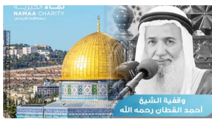
وقفية القطان رحمه الله

وقفية الشيخ أحمد القطان لعموم الخير ودعم المسجد الأقصى