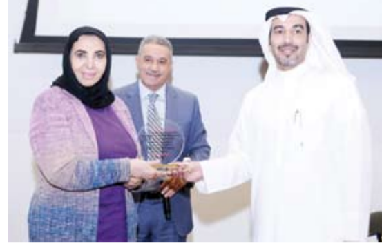
جانب من تكريم د. سعاد الصباح

حيث قالت: "أشكرُكم لأنكم أخرجتموني من وراء الجدران.. فممن أكثر من سنتين وأنا حبسيت سعادتها بهذه الدعوة الكريمة التي وجهت إليها. وخنمت كلمتها بكلمة شكر شملت فيها كل من ساهم بهذه الندوة إعداداً وحضوراً، وإليه توجوب وإن لكل باب مفتاحاً ومعطياتها الثقافية"، معربة عن لغتها يصاب العالم بالصمت المطبق وبالجهل التام بل اللغة تكون المعرفة، ومن واجبا أن نسعى إلى تآلف اللغتين العربية والفرنسية، للاستفادة