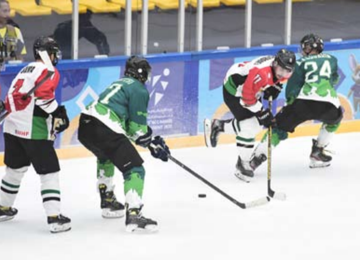
السعودية والإمارات في افتتاح هوكي الجليد