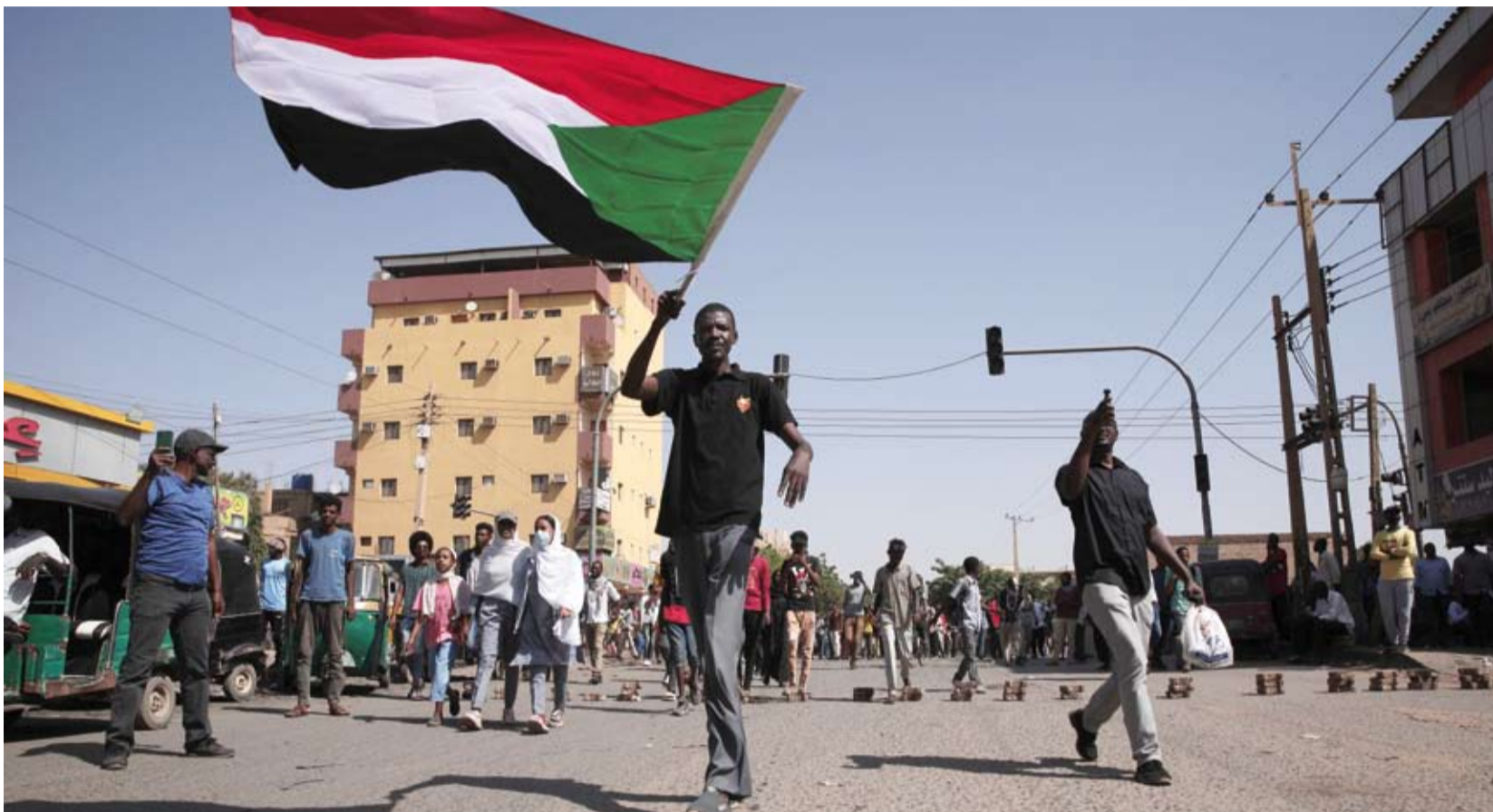
احتجاجات في السودان

بما ذلك استخدام «الخرابيش» التي سقط بها قاتل واحد وأصابت العشرات، بالإضافة إلى عرفقتها وصول المصابين إلى المستشفيات لتلقى الإسعافات. الأمر الذي عرض بعضهم للخطر. وصدت اللجنة في تقريرها عن أحداث أم درمان الأحد الماضي إصابة نحو 77 شخصاً؛ بينها 3 بالرصاصة الحية، و53 بطلق ناري متناثر من سلاح «الخرطوش»، وإصابات عديدة بعبوات الغاز المسيل للدموع وأجسام صلبة.