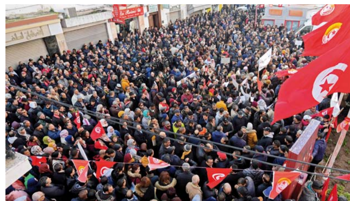
مظاهرات سابقة في تونس

المعارض مقاطعة لكل المحطات الانتخابية المقبلة، ورفضه المشاركة في الاستفتاء الشعبي المقرر في 25 يوليو المقبل، وكذا الانتخابات البرلمانية المنتظرة نهاية السنة الجارية. ودعا الأحزاب السياسية والمنظمات الوطنية والمجتمع المدني إلى مقاطعة «مسار التأسيس للجمهورية الجديدة». من ناحية، قال زهير الحدي، رئيس «التيار الشعبي» الداعم للمسار التصحيحي للرئيس