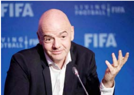
جيانى إنفانتينو رئيس الاتحاد الدولي لكرة القدم

في دافوس «حتى اليوم، لايزال هناك أناس لا يقلقون فكرة أن دولة عربية إسلامية ستستضيف بطولة مثل كأس العالم». «أقول إن قطر، مثل دول أخرى، «ليست مطالبة» لكنها زادت وتيرة الإصلاحات والتنمية. وتشمل الإصلاحات رفع الحد الأدنى للأجور وتبني قواعد جديدة تقوّل السلطات إنها مصممة لحماية العمال. وتعرضت قطر لانتقادات شديدة من جماعات حقوق الإنسان بسبب معاملتها للعمال المهاجرين الذين يشكلون مع أجانب آخرين الجزء الأكبر من سكان البلاد.