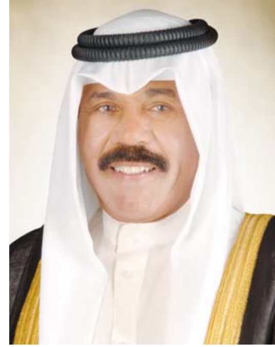
سمو أمير البلاد الشيخ نواف الأحمد

بعث صاحب السمو أمير البلاد الشيخ نواف الأحمد، ببرقية تهنئة إلى الرئيس إسياس أفورقي رئيس دولة إرتيريا الصديقة، عبر فيها سموه عن خالص تهانئه بمناسبة العيد الوطني لبلاده، متمنياً لفخامته موفور الصحة والعافية وللبلد الصديق دوام التقدم والازدهار.