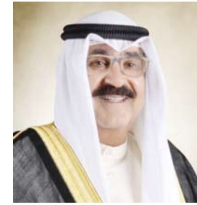
سمو نائب الأمير وولي العهد الشيخ مشعل الأحمد

استقبل سمو نائب الأمير وولي العهد الشيخ مشعل الأحمد، بقصر بيان، صباح أمس، سمو الشيخ ناصر المحمد. كما استقبل سمو نائب الأمير وولي العهد، نائب رئيس مجلس الوزراء ووزير النفط ووزير الدولة لشؤون مجلس الوزراء الدكتور محمد الفارس.