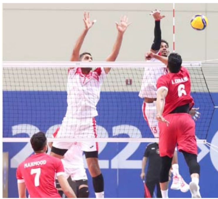
البحرين تفوز على عمان في منافسات الكرة الطائرة

الي ذلك، خسّر المنتخب الكويتي امام نظيره القطري صفر3-3، ضمن كرة الطاولة التي تقام منافساتها في مقر اللجنة الأولمبية الكويتية. وحقق المنتخب السعودي فوزاً مهماً على نظيره الإماراتي بالنتيجة ذاتها. ويتصدر المنتخب القطري جدول الترتيب برصيد 6 نقاط، تليه السعودية (4) و الكويت والبحرين (3) والإمارات (2). وقال رئيس اللجنة الفنية للعبة في الدورة ومدير الاتحاد الكويتي أحمد القلاف