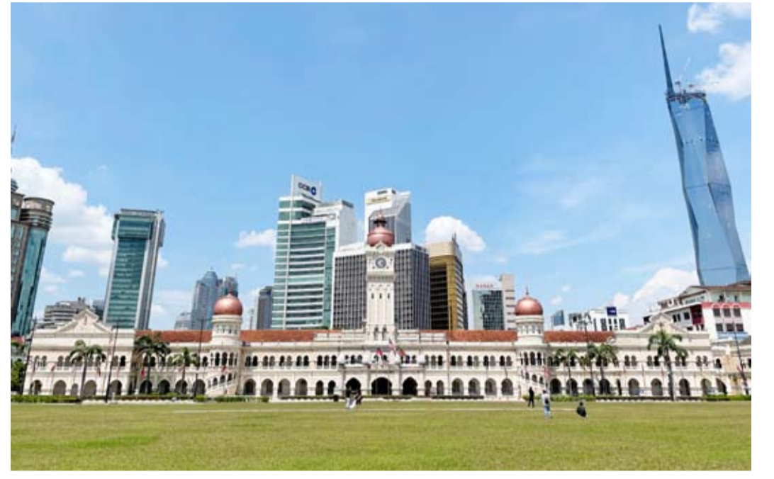
لقطة عامة لمبنى السلطان عبدالصمد

النهضة الكلاسيكي في أوروبا أوائل القرن الخامس عشر ويتميز ببرج الساعة الذي يشبه ساعة (بيغ بن) في لندن ويبلغ ارتفاعه 41 متراً. كما يتميز المبنى الذي تبلغ مساحته 4208 أمتار مربعة ببرجين آخرين لولبيي التصميم تعلوهما بفتان نحاسيتان إضافة إلى الشرفات