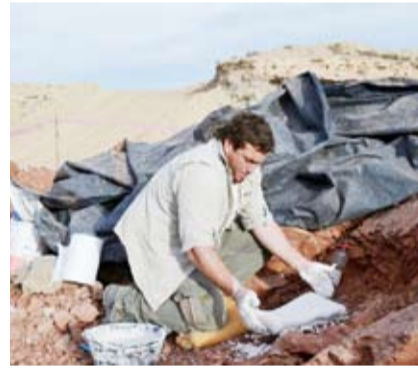
فريق العلماء اكتشف حفرة فاناتوسدراكون أمارو

اكتشف علماء أرجنتينيون نوعاً جديداً من الزواحف الطائرة الضخمة أطلق عليه "تنتين الموت" عاش قبل نحو 86 مليون سنة بجانب الديناصورات، في اكتشاف يسلط المزيد من الضوء على حيوان مفترس كان جسمه بطول حفلة مدرسية. ويبلغ طول هذا الزاحف المنجح القديم، أو التيروصور، نحو تسعة أمتار ويقول الباحثون: إنه سبق الطيور في التحليق باعتباره من بين أول المخلوقات على الأرض التي استخدمت الأجنحة لاصطياد فرائسها من السماء في فترة ما قبل التاريخ. واكتشف فريق العلماء حفرة فاناتوسدراكون أمارو، التي تمت تسميتها حديثاً، في جبال الأنديز بمقاطعة ميندوزا في غرب الأرجنتين. ووجدوا أن الصخور التي حفلت بغايا هذا الزاحف تعود إلى 86 مليون سنة، إبان العصر الطباشيري. ويعني هذا التاريخ أن تلك الزواحف الطائرة الخفيفة عاشت ما لا يقل عن 20 مليون سنة قبل أن يتسبب اصطدام كويكب بما يعرف الآن بشبه جزيرة يوكاتان المكسيكية في القضاء على معظم أشكال الحياة على الأرض منذ حوالي 66 مليون سنة.