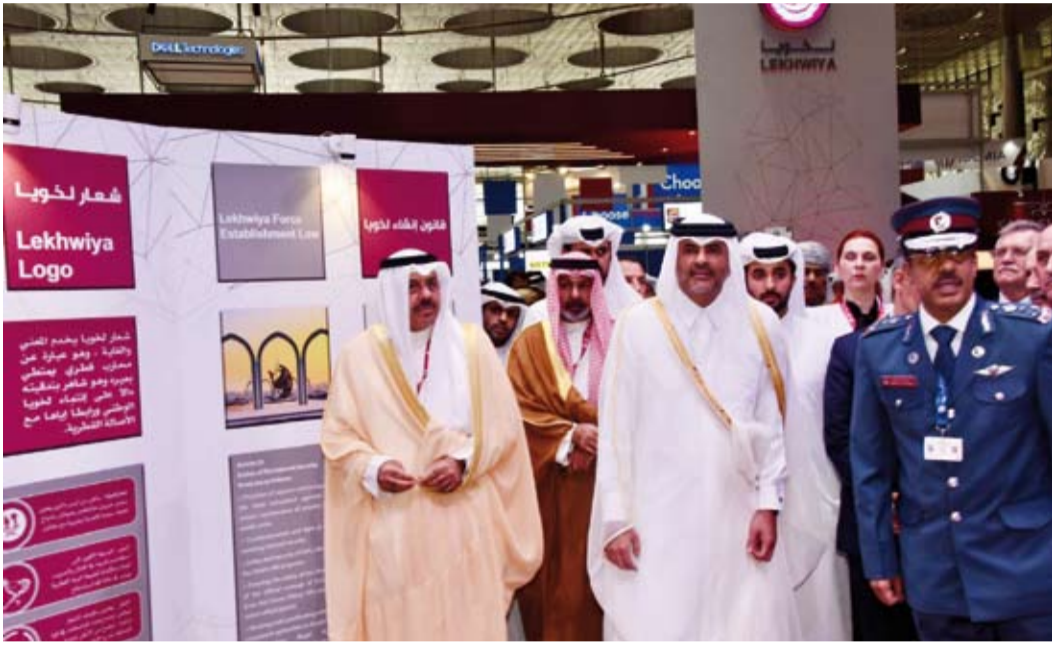
الشيخ أحمد النواف والشيخ خالد بن خليفة بن عبدالعزيز آل ثاني خلال جولتهم في المعرض

كما تشارك في الفعالية 30 دولة من مختلف أنحاء العالم وأكثر من 240 من الوفود وكبار الشخصيات. ونجح (ميليبول قطر 2022) في ترسيخ مكانته المتميزة بوصفه الفعالية الرائدة دولياً وإقليمياً في مجال الأمن الداخلي والدفاع المدني.