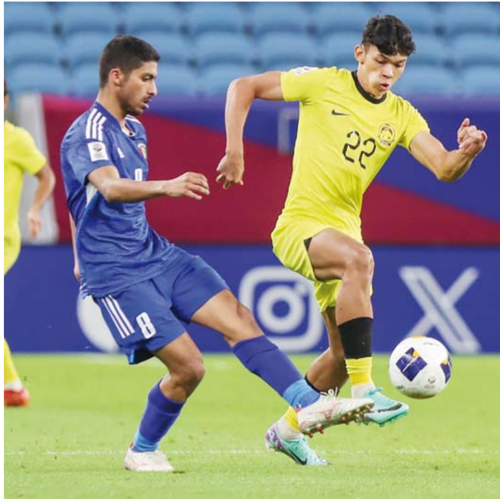
فوز شرفي للازرق على ماليزيا

أعرب مدرب منتخب الكويت لكرة القدم تحت 23 عاماً إيميليو بيكسي عن سعادته بفوز المنتخب على نظيره الماليزي بهدفين مقابل هدف في بطولة كأس آسيا لكرة القدم تحت 23 عاماً والمقامة في الدوحة وذلك على الرغم من عدم تمكنه من التأهل لربع نهائي البطولة.