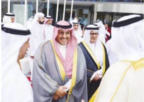
نائب رئيس اللجنة الأولمبية الكويتية الشيخ مبارك الصباح

أكد نائب رئيس اللجنة الأولمبية الكويتية رئيس وفد الكويت الرياضي المشارك في دورة الألعاب الخليجية الأولى للشباب (إمارات) الشيخ مبارك فيصل نواف الأحمد الصباح أهمية البطولات الرياضية الخليجية في تعزيز العلاقات والتلاحم ما بين شباب دول مجلس التعاون الخليجي.