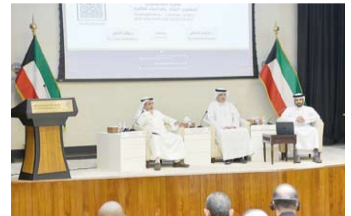
جانب من الندوة

الحضارات بين الإسلام والغرب» خصوصاً بعد أحداث الحادي عشر من سبتمبر وما تلاها من حروب. وأضاف الخضر أن تلك الحقبة شهدت ظهور حركات مسلحة ذات خلفية متطرفة مما أدى إلى انفجار ظاهرة الإسلاموفوبيا التي ترى أن «الإسلام لم يعد تهديداً للحضارة والثقافة الغربية بل أصبح يرى بأنه تهديد سياسي وديني». وبيّن أن الإسلاموفوبيا امتداد «للاستشراق الذي يحمل تحيزاً عاماً ضد العرب ومن حولهم ثم ظهر هذا