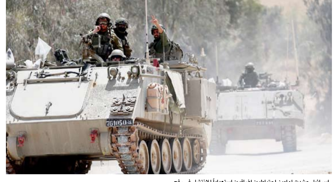
اسرائيل حشدت لواءين احتياطيين إضافيين استعداداً للانتشار في رفح

أعلن جيش الاحتلال، امس، أن قواته حشدت لواءين احتياطيين إضافيين، استعداداً للانتشار محتمل في مدينة رفح، جنوب قطاع غزة. وقال في بيان: تدرب الجنود على فنون قتالية، وتعلموا الأفكار والدروس الرئيسية من القتال والمناورات البرية في قطاع غزة. وذكرت وسائل إعلام محلية أن إسرائيل تستعد لإرسال قوات إلى مدينة رفح، ونقلت صحيفة «يسرائيل هيوم»، واسعة الانتشار عن قرار للحكومة، بعد تعثر