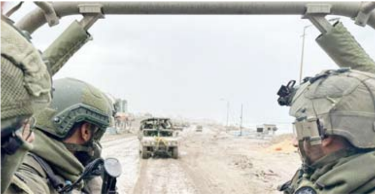
الجيش الصهيوني يواصل اقتحام المدن الفلسطينية

أخرى بقطاع غزة. خلال الحرب المستمرة منذ أكثر من 6 أشهر. ويثير مصيرهم قلق القوى بدا أنها تظهر إقامة مدينة خيام لاستقبال من سيتم إجلاؤهم من رفح. ولم يصدر تعليق بعد عن مكتب رئيس الوزراء بنيامين نتنياهو، ولا مكتب المتحدث باسم الجيش الإسرائيلي. وشنتن ستتم «قريباً جداً». ونشرت عدة وسائل إعلام إسرائيلية أخرى تقارير مماثلة. وأشار البعض إلى