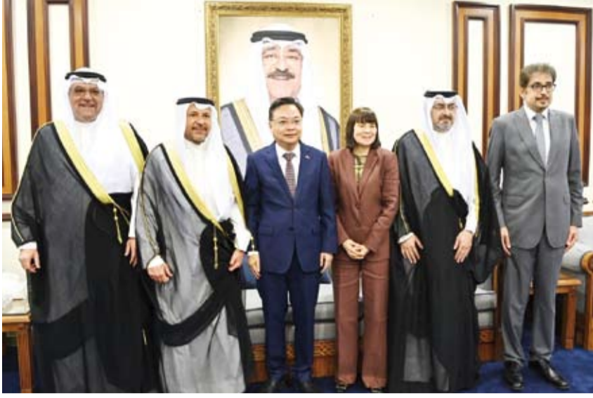
محافظ العاصمة الشيخ عبد الله سالم العلي يستقبل مجموعة من المهنيين

إلى ديوان عام المحافظة في قصر نايف لتقديم التهاني بمناسبة تسلمه مهام عمله الجديد، وتمنياً لهم بمعالجة بالتوفيق والسداد في ظل صاحب السمو أمير البلاد الشيخ مشعل الأحمد. وأعرب المحافظ عن شكره وتقديره لكافة الأخوة المهنيين متمنياً لهم دوام الصحة والعافية.