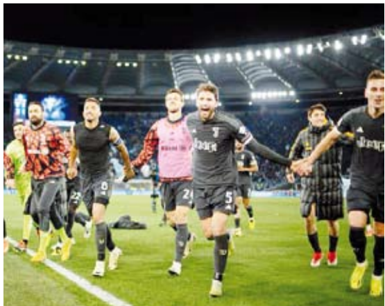
يوفيني يعبر اليوفي

تاهل يوفنتوس لنهائي كأس إيطاليا لكرة القدم رغم الخسارة أمام مضيفه لاتسيو بنتيجة 2-1 في إياب الدور قبل النهائي مستفيداً من فوزه ذهاباً بهدفين دون رد.