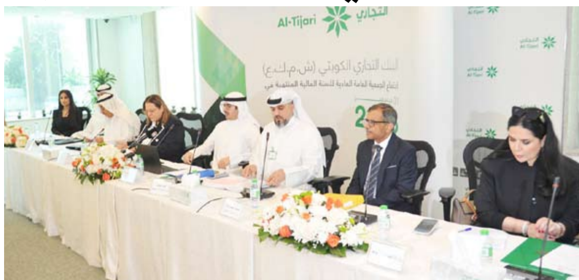
مجلس الإدارة خلال العمومية

أعلن البنك التجاري الكويتي عن تحقيق هدفه الاستراتيجي في رحلته الطموحة نحو توطين العمالة الوطنية في المناصب القيادية ووصولها إلى نسبة 70 بالمئة على مستوى الإدارة التنفيذية كما في نهاية العام 2023. ويأتي هذا الإنجاز نتيجة الجهود الدؤوبة التي يبذلها البنك بصورة متسقة مع توجيهات بنك الكويت المركزي لجذب وتوظيف الكوادر الوطنية في المناصب القيادية. هذا، ويكرس البنك التجاري جهوده نحو دعم توطين العمالة تماشياً مع استراتيجية الدولة على صعيد تطوير رأس المال البشري.