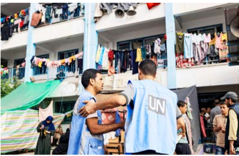
مدرسة لوكالة «الأونروا» في مدينة غزة

وتتهم إسرائيل الوكالة الأممية البالغ عدد موظفيها أكثر من 30 ألف شخص في المنطقة (غزة والضفة الغربية ولبنان والأردن وسوريا) بأنها توظف «أكثر من 400 إرهابي» في غزة، من بينهم 12 موظفاً تؤكّد الدولة العبرية أنهم متورطون بشكل مباشر في الهجوم الذي شنته «حماس» على أراضيها.