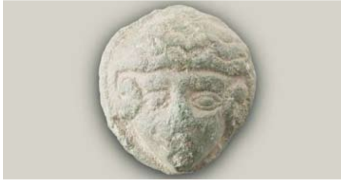
صورة مصنوعة من البرونز للإسكندر الأكبر

اكتشف علماء آثار صورة مصنوعة من البرونز، للإسكندر الأكبر، أثناء إجراء أعمال مسح في حقل خارج مدينة رينجستيد في جزيرة زيلندا الدنماركية، وسلموا القطع الأثرية إلى متحف «ويست زيلاند»، بحسب مجلة «لايف ساينس» العلمية. وبناءً على الصور، عرف علماء الآثار على الفور أنهم كانوا ينظرون إلى وجه الإسكندر الأكبر، الزعيم الأسطوري لمملكة مقدونيا القديمة التي امتدت إمبراطوريتها من البلقان إلى باكستان الحديثة عند وفاته عن عمر يناهز 32 عاماً. وقال فريك أولدنبرغر، عالم الآثار في متحف «ويست زيلاند»: القطعة تحتوي على السمات النموذجية للإسكندر الأكبر،