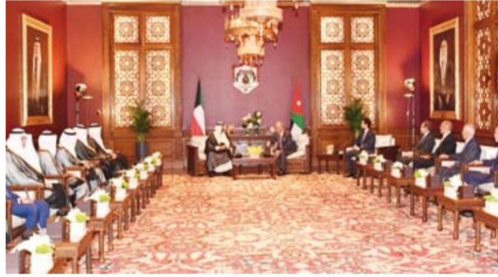
جانب من جلسة المباحثات الرسمية