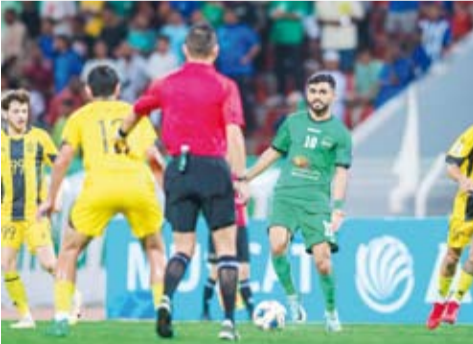
العهد اللبناني تحظى مضيفه النهة العماني