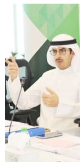
الشيخ أحمد دعيج الصباح