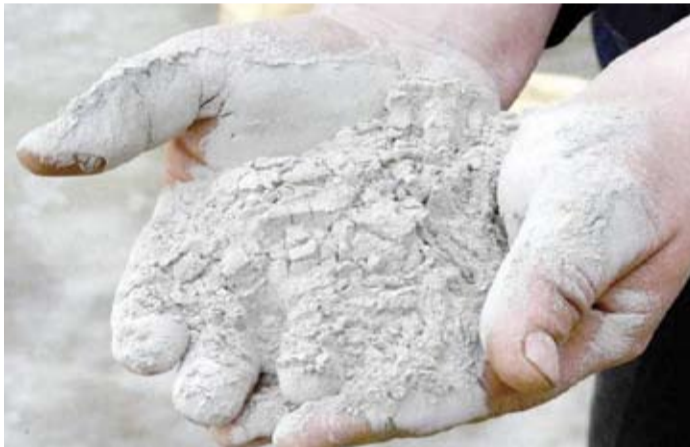
تطوير تركيبة الأسمنت

أعلن العلماء في جامعة «فيرنادسكي» الفيدرالية الروسية في القرم، أنهم قاموا بتطوير تركيبة الأسمنت الخام على أساس النفايات الصناعية والتكنولوجية الواردة من المعامل والمصانع. وكان العلماء قد طوروا في وقت سابق تكنولوجيا تصنيع منتجات البناء القوية والمتينة من الخبث الناتج عن معالمة التعدين. وتم الحصول على ألواح الرصف والطوب بنوعية جيدة. وقالت الخدمة الصحفية للجامعة: إن المتخصصين في الجامعة أجروا مؤخراً دراسة باستخدام الأشعة السينية، مما سمح لهم بتحديد التركيب الكيميائي والمعدني للمواد الخام الثانوية. وقد تراكتت النفايات الصناعية في إحدى شركات القرم التي تقوم بتطوير ملقح في منطقة سيفيروبول على مساحة كبيرة، واستناداً إلى البيانات التي تم الحصول عليها، تم إعداد تركيبة خالط الأسمنت الخام وحرقتها في فرن عالي الحرارة. ونقلت الخدمة الصحفية للجامعة عن نائب مدير العمل التعليمي والمنهجي في أكاديمية البناء والهندسة المعمارية