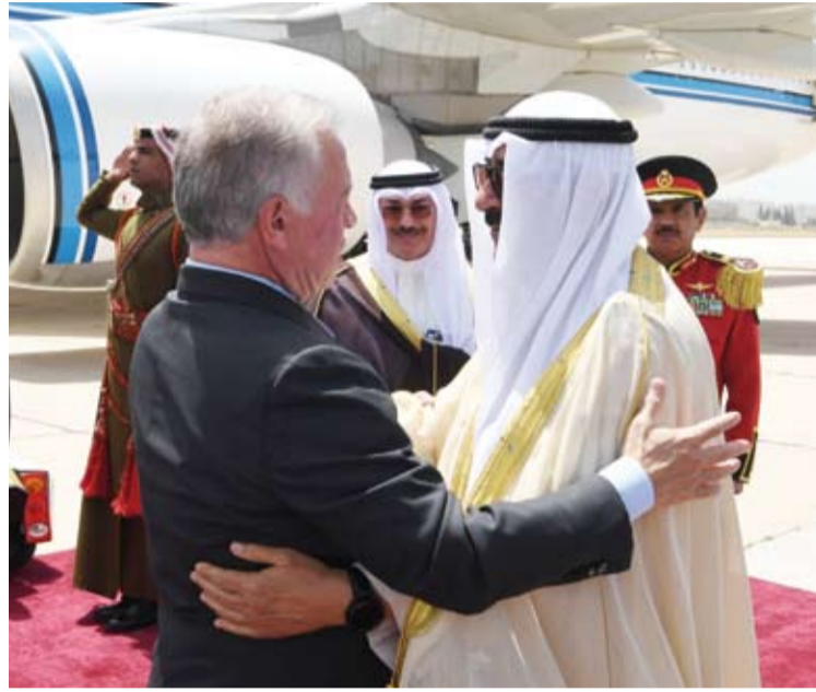
صاحب السمو أمير البلاد الشيخ مشعل الأحمد يغادر العاصمة عمّان

الوفد المرافق من حفاوة استقبال وحسن وفادة عهدناهما على المملكة الشقيقة قيادة كريمة وشعباً مضيافاً، وعكسا عمق الروابط الأخوية والعلاقات المتميزة التي تجمع بلدينا وشعبينا الشقيقين.