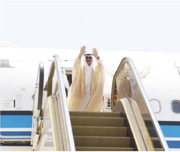
الملك عبدالله الثاني ابن الحسين يودع أخاه سمو أمير البلاد الشيخ مشعل الأحمد