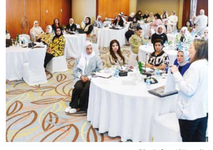
جانب من المشاركين في الورشة

تماشياً مع أهداف التنمية المستدامة بما في ذلك الهدف المتعلق بتحقيق المساواة بين الجنسين وتمكين جميع النساء والفتيات من تحقيق قدرتهن الكاملة والفعالة. وأوضحت أن الورشة تهدف إلى تحسين جودة ودقة التقارير الوطنية حول تنفيذ إعلان ومنهاج عمل (بيجين) وتوفير فرصة مثالية لتبادل الخبرات والتجارب بين مختلف الجهات المعنية في دولة الكويت والوزارات والمؤسسات الحكومية. وأشارت إلى أن دولة الكويت إحدى الدول السباقة في الوفاء بالتزاماتها الدولية من خلال حرصها على تقديم تقاريرها الوطنية بانتظام إيماناً منها بأهمية تعزيز حقوق المرأة وتمكينها في كل مجالات الحياة.