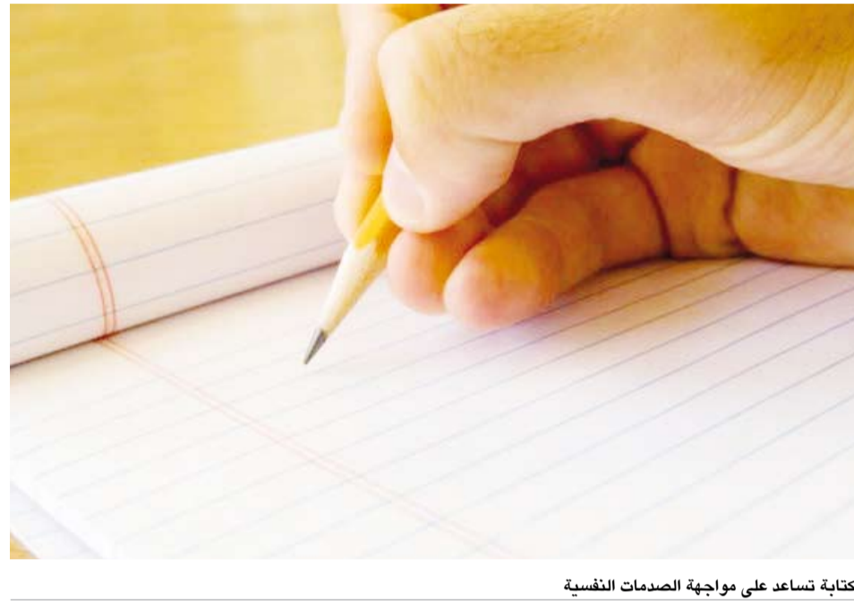
الكتابة تساعد على مواجهة الصدمات النفسية

أفادت دراسة أمريكية، بأن العلاج بالكتابة يساعد مرضى السرطان في مرحلة متأخرة على مواجهة أكبر المخاوف والصدمات النفسية. وأوضح الباحثون، أن الكتابة يمكن أن تقلل من الصدمات المرتبطة بالسرطان والقلق واليأس، ونشرت نتائج الدراسة، بدورية «الطب التطبيقي». وحالياً، يعاني نحو 700 ألف شخص في الولايات المتحدة من السرطان النقي، أو المرحلة الرابعة من السرطان، الذي ينتشر إلى أعضاء متعددة، وفقاً للمعهد الوطني للسرطان. ومع ذلك، فإن معظم علاجات الصحة العقلية مصممة لمساعدة المرضى في المراحل المبكرة، والتي غالباً ما تكون قابلة للشفاء، بهدف مساعدتهم على التغلب على خوف تكرار أو تقدم المرض. لكن الدراسة الجديدة ركزت على 29 بالغاً مصاباً بالسرطان في المرحلة الثالثة أو الرابعة، أو سرطان الدم غير القابل للشفاء؛ إذ تبحث لهم الفرصة للتعبير عن مخاوفهم من خلال كتابة قصصهم. وخضع المشاركون لـ 5 جلسات عبر تطبيق «زووم»، استمرت كل جلسة ساعة واحدة، حيث ناقشوا أكبر مخاوفهم المتعلقة بالسرطان، بما في ذلك الخوف من الألم وفراق أطفالهم. وبعد الجلسة الأولى، طلب منهم كتابة قصة تحتوي على مقدمة ونهاية، تعبر عن مشاعرهم تجاه هذا السيناريو الصعب، وفي الجلسات الأخيرة، تم تحفيزهم لتقييم واقعية السيناريو في قصتهم والعمل نحو كتابة نهاية أفضل. ووجد الباحثون أن مستويات الصدمة، والقلق، والاكتئاب، والخوف من الموت، والتعب، وحتى اليأس، قد تحسنت بشكل ملحوظ بعد العلاج بالكتابة، واستمر التحسن لمدة 5 أشهر ونصف الشهر بعد الدراسة.