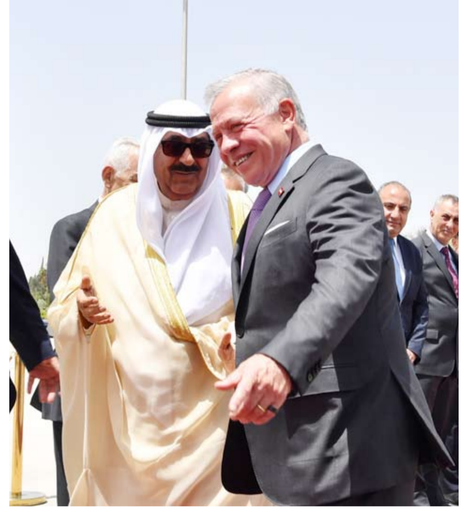
صاحب السمو الأمير مغادرا عقب زيارة دولة قام بها للمملكة وفي وداعه جلالة ملك الأردن

بين السطور عقب زيارة الدولة التي قام بها سمو أمير البلاد، إلى المملكة الأردنية الهاشمية، صدر بيان مشترك يشدد على ضرورة الالتزام بالاتفاقية الموقعة بين الكويت والعراق في 29 أبريل 2012 لتنظيم الملاحة البحرية في خور عبدالله، وأن حقل الدرة يقع بكامله في المناطق البحرية لدولة الكويت، وأن ملكية الثروات الطبيعية في المنطقة المغامرة للمحاذاة للمنطقة المقسومة الكويتية - السعودية بما فيها حقل الدرة بكامله هي ملكية مشتركة بين الكويت والسعودية فقط. التأكيد الخليجي سابقا والأردني حاليا على الحق الكويتي تجاه الادعاءات الإيرانية والعراقية يجب أن يوظف على المستوى الدولي لحشد الدعم الأممي لضمان تلك الحقوق التي باتت مطمعا يجب الانتباه له والحفاظ عليها مهما كلف الأمر.