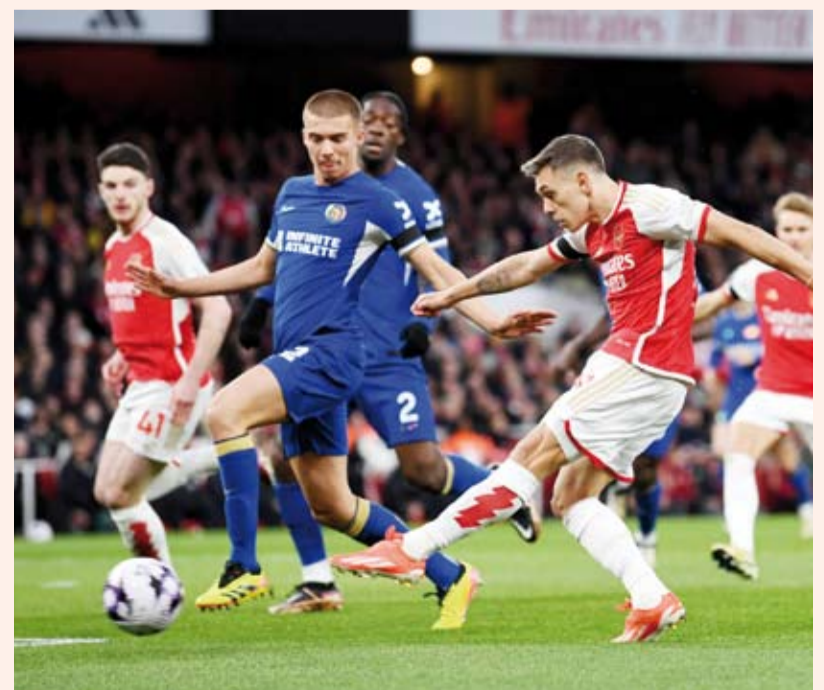
فوز مريح للجانز على البلوز

عزز فريق أرسنال مركزه في صدارة الدوري الإنجليزي لكرة القدم، بفوزه على ضيفه تشيلسي بخمسة أهداف دون رد، في مباراة مؤجلة من الجولة التاسعة والعشرين من المسابقة.