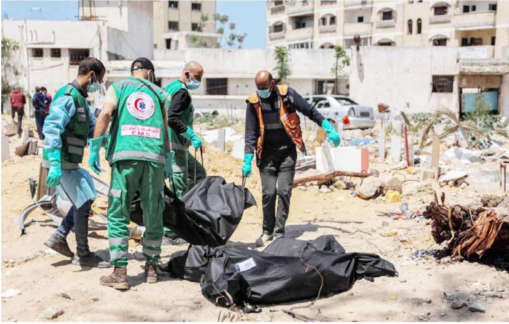
«الأمم المتحدة» تدن المقابر الجماعية في غزة

ووصف المفوض السامي لحقوق الإنسان، فولكر تورك، الدمار الذي لحق بمجمع الشفاء، وهو أكبر مستشفى في غزة، وبمجمع ناصر الطبي في خان يونس، ثاني المراكز الاستشفائية الكبيرة في القطاع، بأنه «مروع»، مشدداً في بيان على الحاجة إلى «تحقيقات مستقلة وفعالة وشفافة»، في هذه الوفيات.