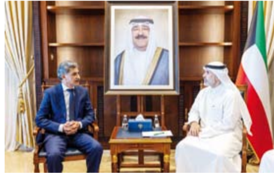
السفير الشيخ جراح الصباح يستقبل سفير باكستان مالك محمد فاروق

تلقى صاحب السمو أمير البلاد الشيخ مشعل الأحمد، رسالة خطية من رئيس وزراء جمهورية باكستان الإسلامية محمد شهباز شريف تتصل بالعلاقات الثنائية بين البلدين الصديقين وسبل توطيدها في كافة المجالات.