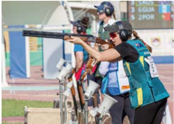
جانب من منافسات البطولة

أشاد الشيخ سلمان الحمود الصباح رئيس الاتحاد الآسيوي للرمية بالتنظيم المميز والمبهج لبطولة العالم النهائية للشون المؤهلة لدورة الألعاب الأولمبية الصيفية باريس 2024، والمقامة حالياً على مجمع ميادين لوسيل للرمية وتستمر حتى 28 أبريل الجاري، بمشاركة 433 رامياً ورامية يمثلون 82 دولة.